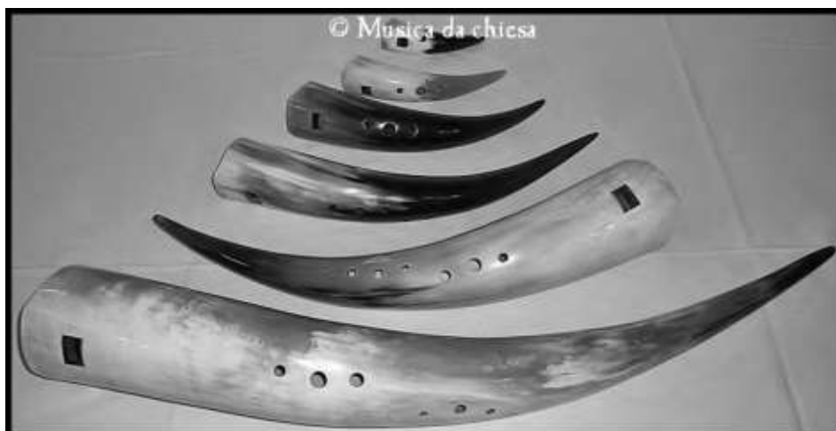
OBRÁZEK 3, SOUBOR KRAVSKÝCH ROHŮ (subbasový, basový, tenorový, altový, sopránový a sopraninový)

Nyní následuje ilustrační seznam skladeb zpívaných během pohřebního obřadu v kostele, skladby jsou zpívány při vstupu, před evangeliem, při obětním průvodu, při přijímání a na závěr (mariánské skladby nejsou provozovány před evangeliem a při přijímání):