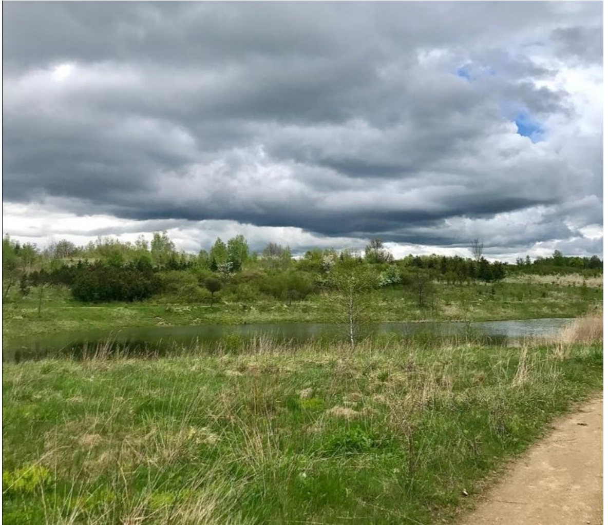
Obr. 5 - pohled na mokřad z jedné z nově vytvořených cest, v pozadí mokřadu je viditelné zalesnění (pořízeno autorkou práce, červen 2022)

Zemědělská rekultivace byla plánována jako 5letá a na rozlohu 36,17 ha. V následujícím postupu: