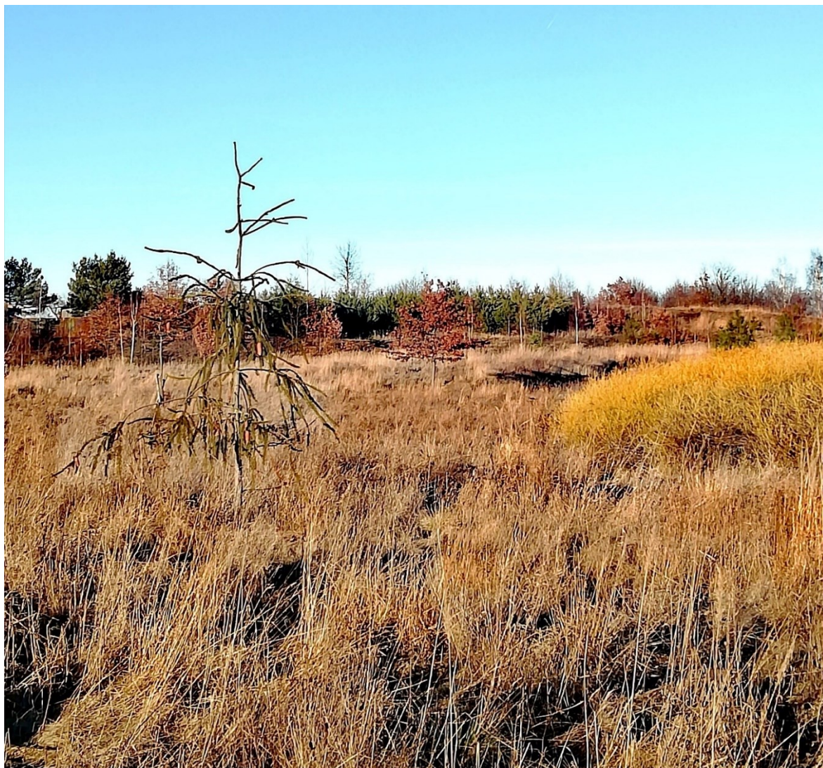
Obr. 4- Smrk ztepilý VIRGATA

arboreta byla i výsadba několika jedinečných jedinců cizokrajného původu, je tak možné pozorovat jejich adaptibilitu v přetvořeném a narušeném prostředí, zároveň zvyšují atraktivitu prostředí a návštěvníkovi je tak umožněna zajímavá procházka s naučným charakterem i bez informačních popisů.