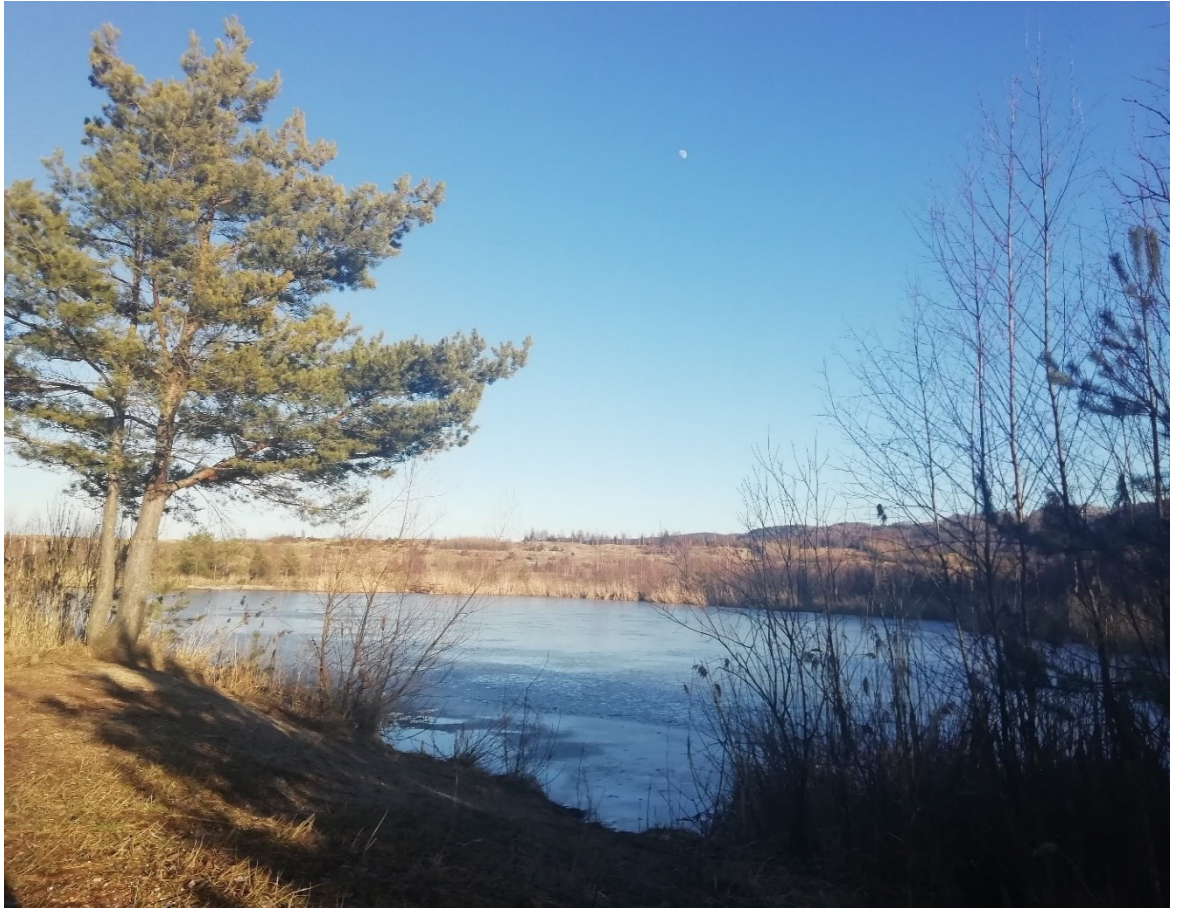
Obr. 3 -Jedna z nově vybudovaných nádrží (pořízeno autorkou práce, únor 2022)

Centrální část lesoparku byla pojata jako arboretum. Součástí této plochy byly výsadby stromů a keřů které měly být v další etapě označeny popisy s názvy a některými zajímavostmi o zvolených dřevinách, tato část měla tedy plnit funkci i naučnou. Označení bylo doporučeno až po dostatečném zakořenění rostlin z hlediska hůře realizovaného odcizení. I z těchto důvodů byl výsadbový materiál již odrostlý, zapěstovaný a sázen s balem, kde došlo ke 100 % výměně půdy. Bohužel k tomu kroku etapy, kde mělo dojít k označení s popisy, zde nedošlo.