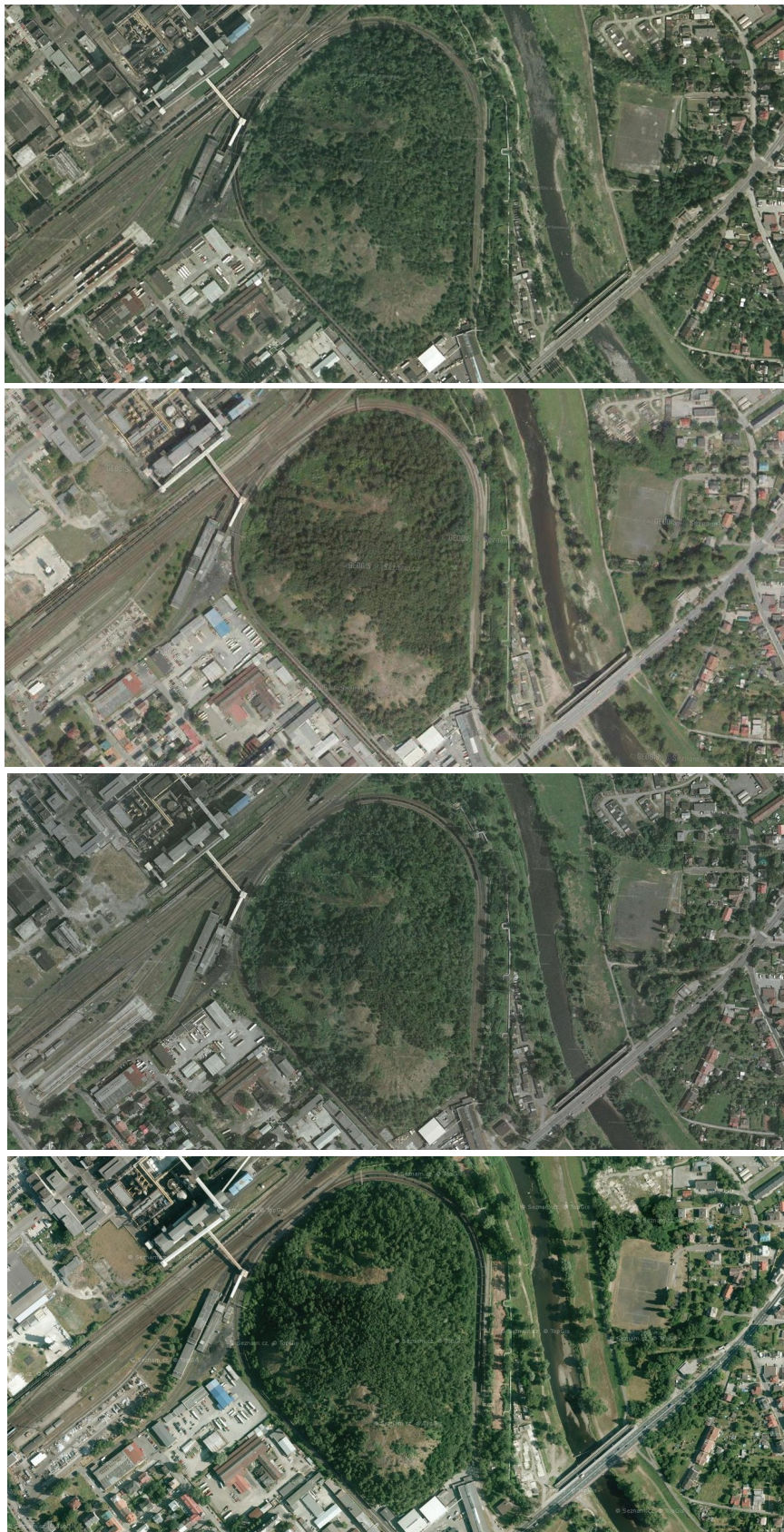
Obr. 7, 8, 9, 10: Série leteckých snímků z let 2003, 2006, 2012 a 2015.