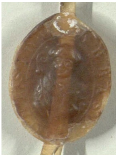
Obrázek 1, Strahov, opat Petr, cca 1240, typ velká pečeť 1. 142