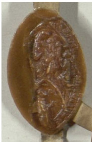
Obrázek 4, Strahov, opat Dětřich II, cca 1306, typ velká pečeť 3. 145