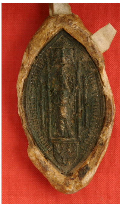
Obrázek 36, Teplá, opat Zikmund Hausman, 1475, typ velká pečeť 5. 177