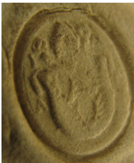
Obrázek 46, Teplá, opat Jan Myšín, 1566, typ sekretní pečeť 2. 187