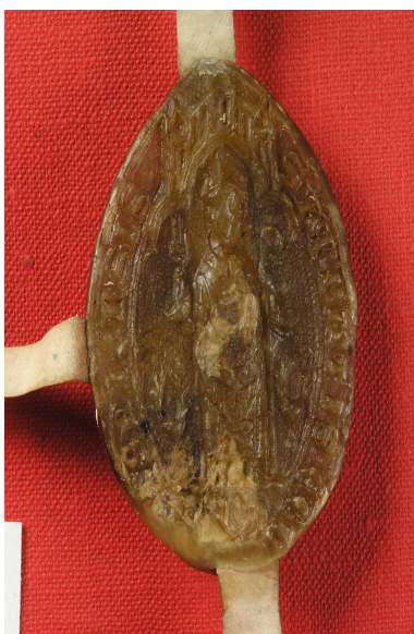
Obrázek 30, Teplá, opat Beneda, 1346, typ velká pečet' 3. 171