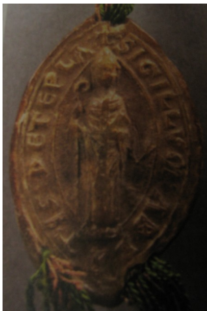
Obrázek 27, Teplá, opat Hugo, 1282, typ velká pečeť 1. 168