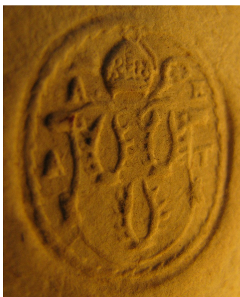
Obrázek 54, Teplá, opat Ondřej Ebersbach, 1615, typ sekretní pečeť 6. 195