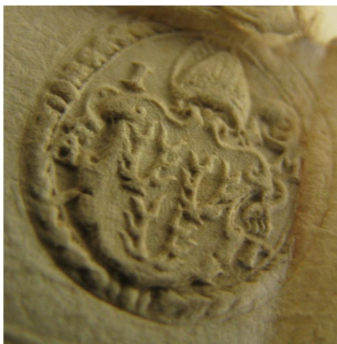
Obrázek 49, Teplá, opat Jan Myšín, 1580, typ sekretní pečet' 4. 190