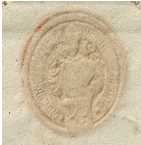
Obrázek 39, Teplá, opat Jan Fröstl, 1509, typ menší pečeť 3. 180