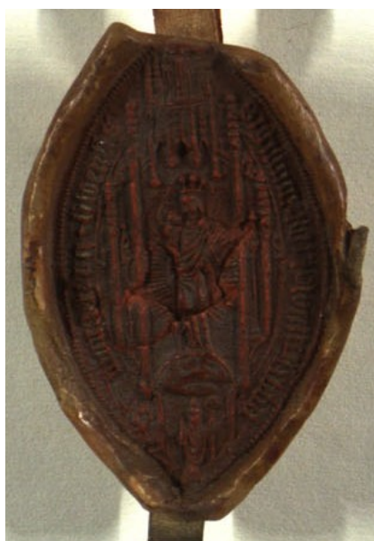
Obrázek 26, Želiv, opat Ondřej, 1548, typ velké pečeť 7. 167