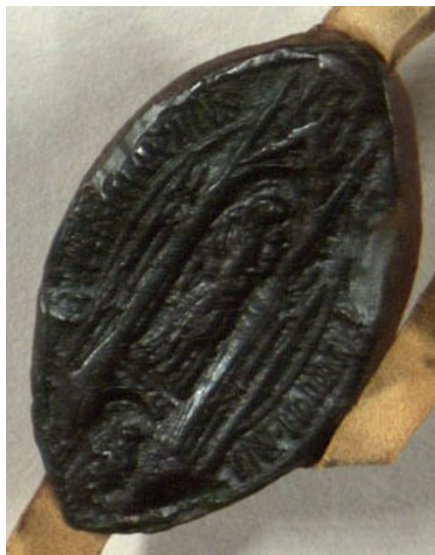
Obrázek 22, Želiv, opat Stibor II, 1400, typ velká pečeť 6. 163