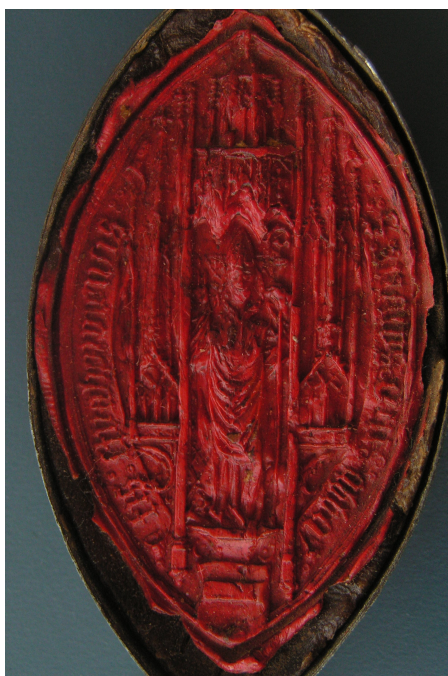
Obrázek 14, Strahov, opat Jan X. Lohel, 1609, typ velká pečet' 7. 155