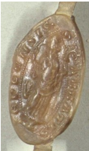
Obrázek 29, Teplá, opat Petr, 1335, typ velká pečet' 2. 170