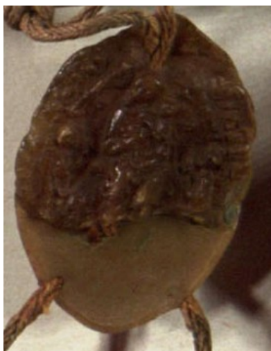
Obrázek 2, Strahov, opat Jordán, 1287, typ velká pečeť 3. 143