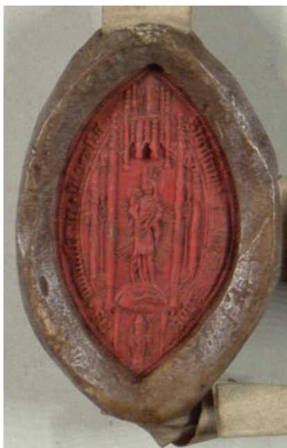
Obrázek 25, Želiv, opat Wolfgang, 1500, typ velká pečeť 7. 166