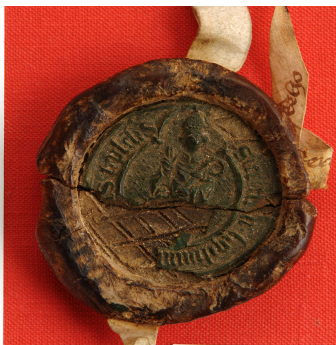
Obrázek 35, Teplá, opat Zikmund Hausman, 1473, typ menší pečeť 2. 176