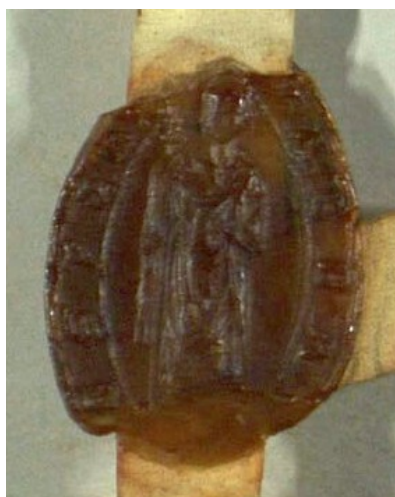
Obrázek 19, Želiv, opat Dětrich II, 1323, typ velká pečeť 4. 160