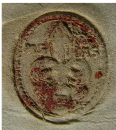
Obrázek 13, Strahov, opat Matěj Ghell, 1582, typ sekretní pečet' 1. 154