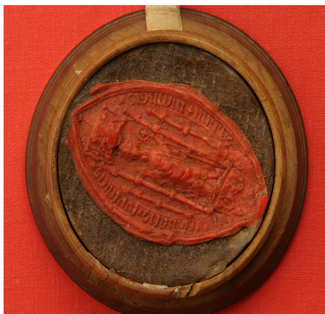
Obrázek 52, Teplá, opat Ondřej Ebersbach, 1600, typ velká pečeť 5. 193