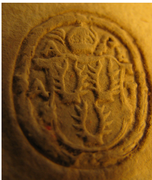
Obrázek 55, Teplá, opat Ondřej Ebersbach, 1617, typ sekretní pečet' 7. 196