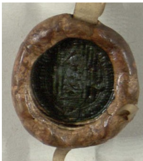
Obrázek 23, Želiv, opat Marek 1445, typ menší pečet' 1. 164