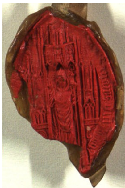
Obrázek 10, Strahov, Jan Kurtz, 1531, typ velká pečeť 7. 151