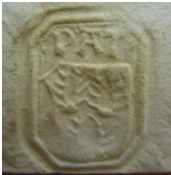
Obrázek 40, Teplá, opat Petr, 1514, typ signet 3. 181