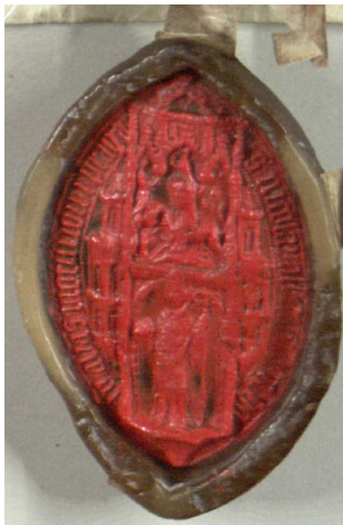
Obrázek 7, Strahov, opat Mikuláš Durynk, 1413, typ velká pečeť 5. 148