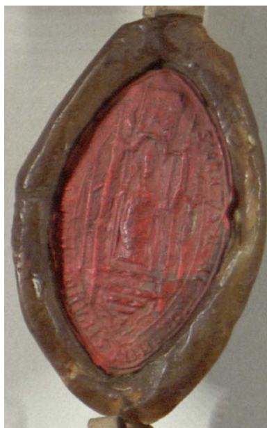
Obrázek 8, Strahov, opat Jan V. Starustka z Hranic, 1474, typ velká pečeť 6. 149