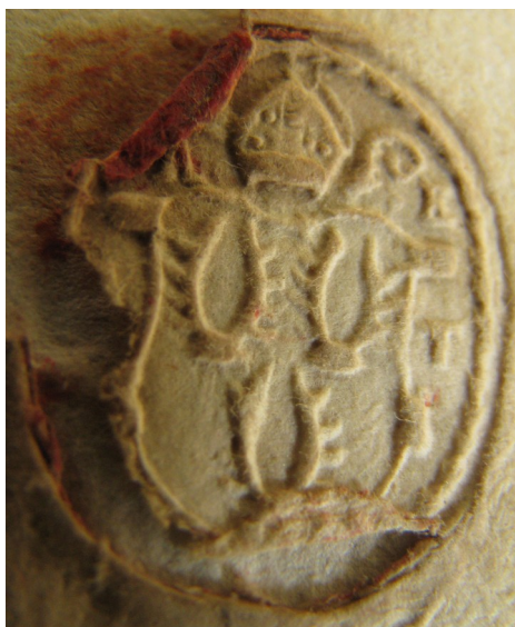
Obrázek 53, Teplá, opat Ondřej Ebersbach, 1613, typ sekretní pečeť 5. 194