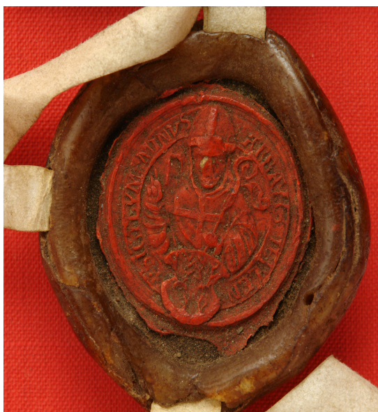
Obrázek 42, Teplá, opat Antonín, 1531, typ menší pečet' 4. 183