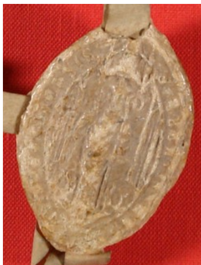
Obrázek 31, Teplá, opat Bohuš z Otošic, 1391, typ velká pečeť 4. 172