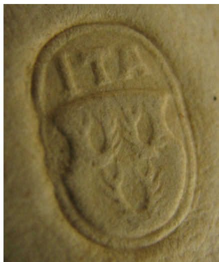
Obrázek 45, Teplá, opat Jan Myšín, 1566. typ sekretní pečeť 1. 186