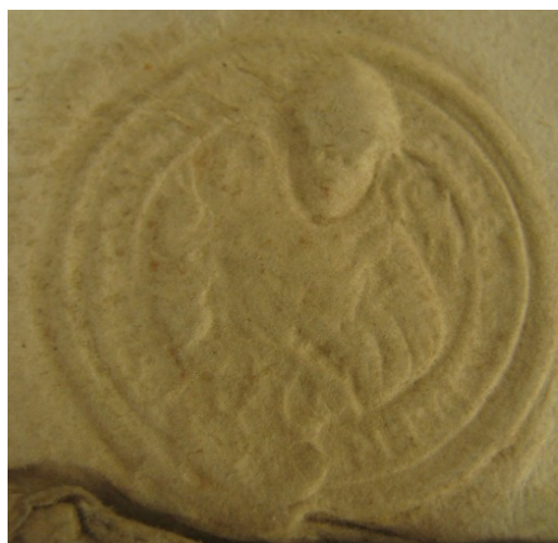
Obrázek 44, Teplá, opat Jan Myšín, 1565, typ menší pečet' 4. 185