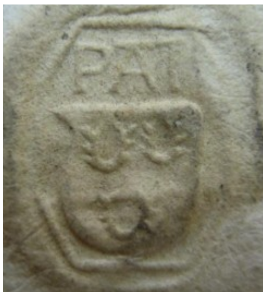
Obrázek 41, Teplá, opat Petr, 1524, typ signet 4. 182