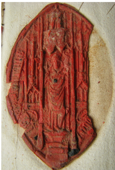
Obrázek 12, Strahov, opat Jakub ze Šternovic, 1569, typ velká pečeť 7. 153