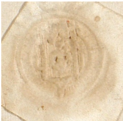
Obrázek 24, Želiv, opat Petr, 1494, typ menší pečet' 2. 165