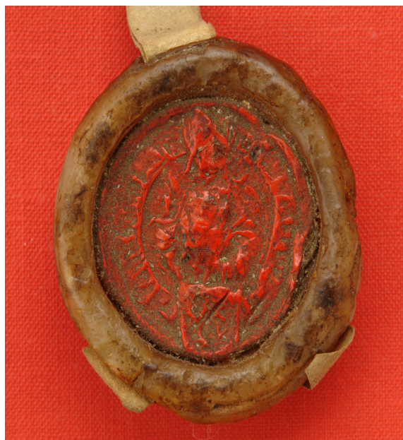
Obrázek 43, Teplá, opat Jan Kurtz, 1559, typ menší pečet' 5. 184