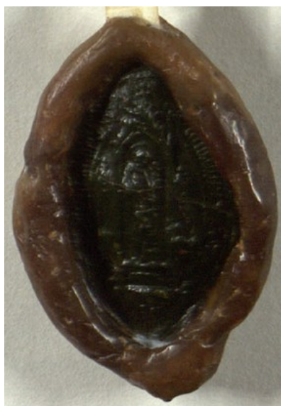
Obrázek 20, Želiv, opat Bohuslav, 1361, typ velká pečeť 5. 161