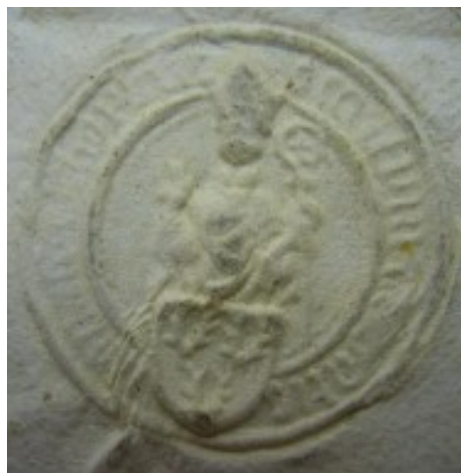
Obrázek 33, Teplá, opat Zikmund Hausman, 1467, typ menší pečeť 1. 174