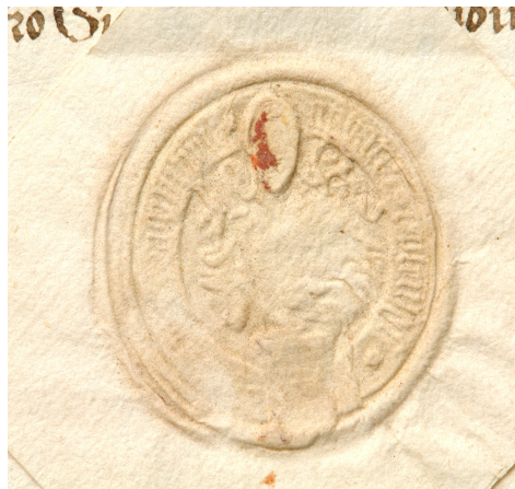
Obrázek 38, opat Zikmund Hausman, 1500, typ menší pečet' 3. 179