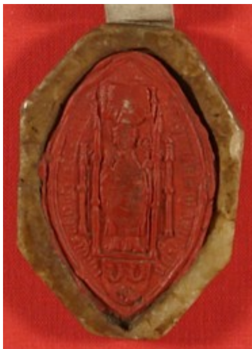
Obrázek 48, Teplá, opat Jan Myšín, 1579, typ velká pečeť 5. 189