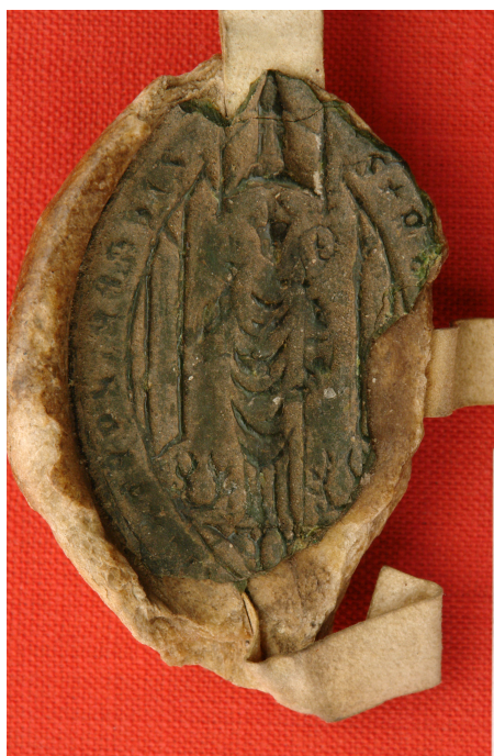
Obrázek 32, Teplá, opat Racek z Rýzmburka, 1443, typ velká pečeť 4. 173