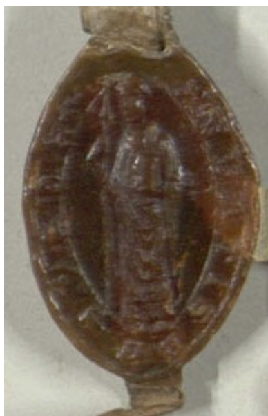
Obrázek 17, Želiv, opat Jakub, 1289, typ velká pečeť 2. 158