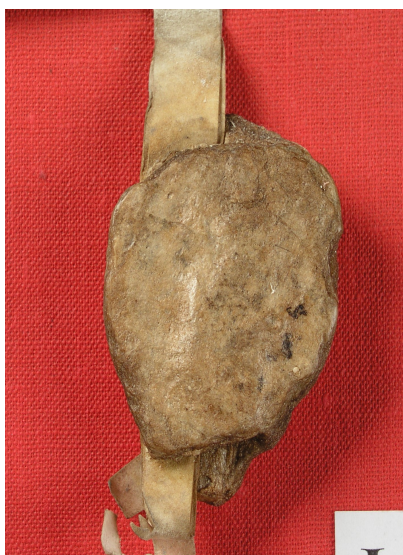
Obrázek 28, Teplá, opat Ivan, 1300, typ nelze určit. 169