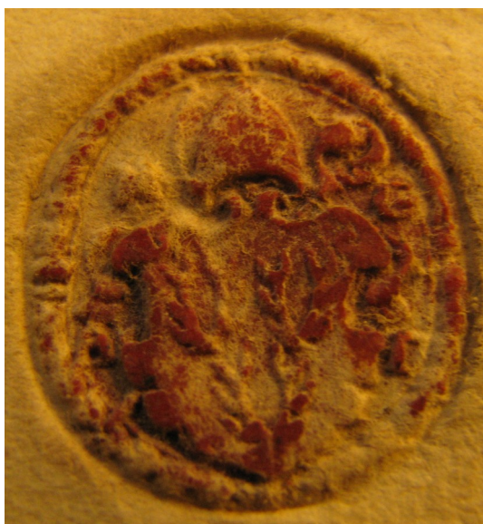
Obrázek 51, Teplá, opat Matěj I. Ghel, 1585, typ sekretní pečeť 3. 192