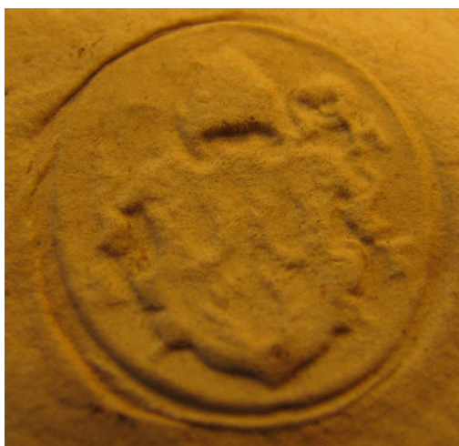
Obrázek 50, Teplá, opat Jan Myšín, 1583, typ sekretní pečet' 5. 191