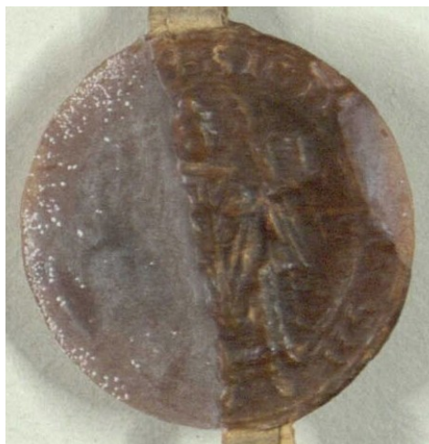
Obrázek 16, Želiv, opat Heřman, 1236. typ velká pečeť 1. 157