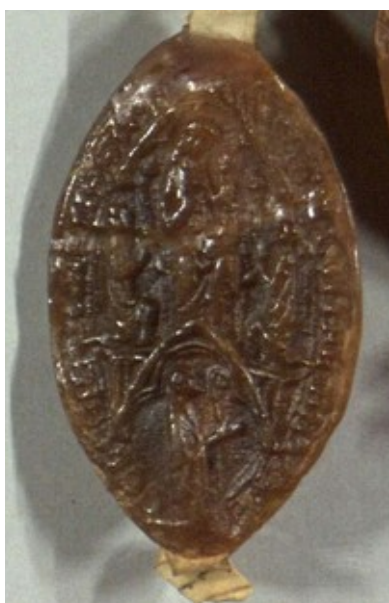
Obrázek 3, Strahov, opat Edmund, 1304, typ velká pečeť 3. 144