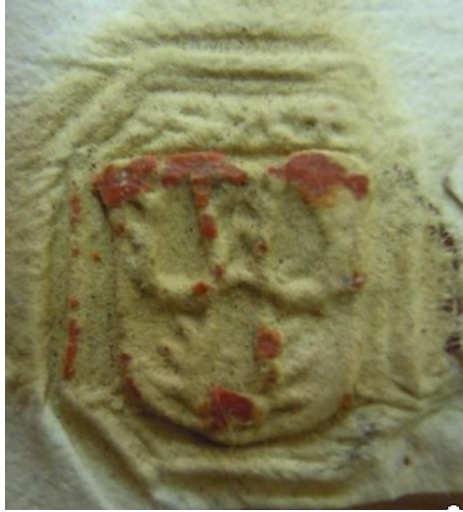
Obrázek 37, Teplá, opat Zikmund Hausman, 1487, typ signet 2. 178