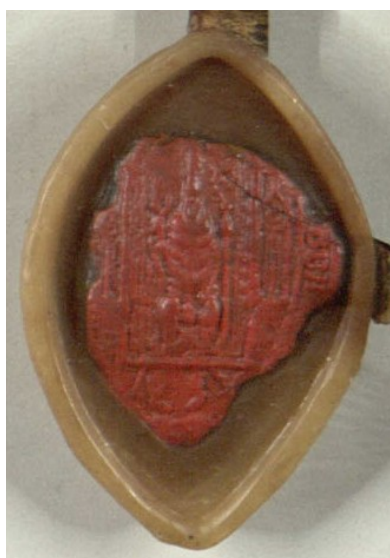
Obrázek 6, Strahov, opat Jan II. ze Štědré, 1407, typ velká pečeť 4 147