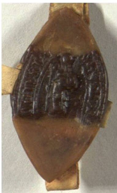
Obrázek 18, Želiv, opat Thilman, 1311, typ velká pečeť 3. 159