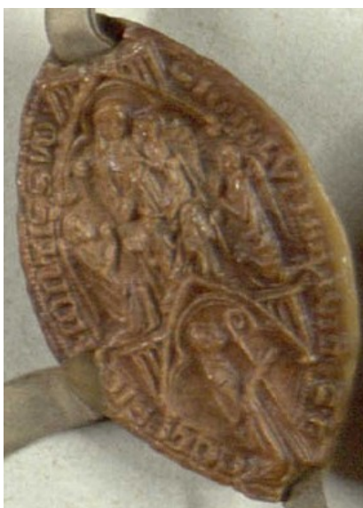
Obrázek 5, Strahov, opat Gerard de Kunststadt, 1320, typ velká pečeť 3 146