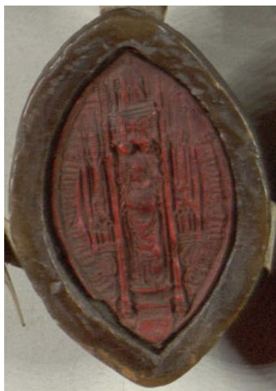
Obrázek 9, Strahov, opat Kašpar I., 1511, typ velká pečeť 7. 150