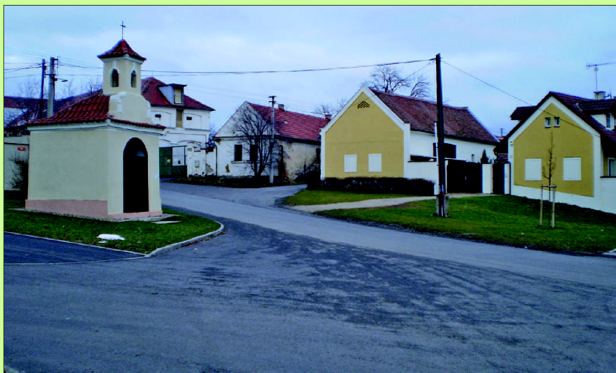
Náves v Bašti s pozdně barokní kapličkou se zvoničkou. Domy byly postaveny na konci 19. století a v nedávné době byly rekonstruovány.

Podle Historického lexikonu obcí ČR 1869–2005 určete, kdy došlo k většímu nárůstu počtu domů, vypočítejte intenzitu výstavby domů a porovnejte ji s údaji pro vyšší územní celky (okres, kraj). Porovnejte architekturu domů (tvar domu, počet podlaží, tvar střechy, počet a druh místností) z jednotlivých období (konec 19. století, mezi světovými válkami, 1945–1970, 1971–1990, po r. 1990) a doložte to fotodokumentací. Porovnejte strukturu a funkci původního starého sídla se sídlem dnešním, funkci zahrad kolem domů z různých období, velikost parcel, počet veřejných prostor v lokalitách se starší zástavbou a v lokalitách s novou zástavbou. Uveďte, které dřeviny se zde vysazují. Fotodokumentaci upozorněte