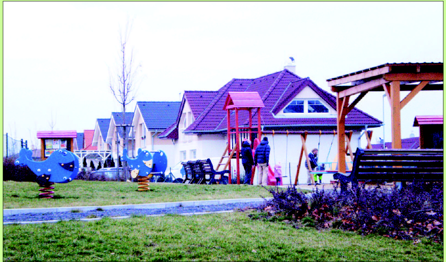
Dětské hřiště otevřené v roce 2009 v lokalitě Nová Bašť. Je to jediný veřejný prostor s novou zástavbou, kde byly na počátku tohoto století firmou Central Group postaveny unififikované domy.

Každá skupina prezentuje získané výsledky před třídou. Cílem je zjistit vliv suburbanizace na život v suburbii, a to jak pozitivní, tak negativní. Zhodnotit současný stav života v suburbii pomocí SWOT analýzy (strengths – silné stránky, weaknesses – slabé stránky, opportunities – příležitosti, threats – hrozby)