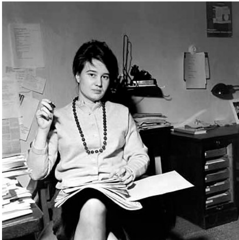
Abb. 1: Ulrike Meinhof