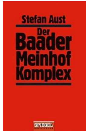
Abb. 3: Buchumschlag – Der Bader Meinhof Komplex