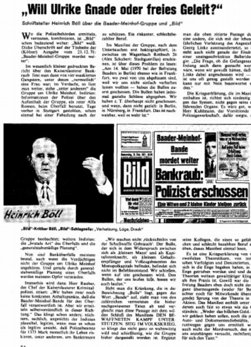
Abb. 5: Titelseite, „Will Ulrike Gnade oder freies Geleit?“