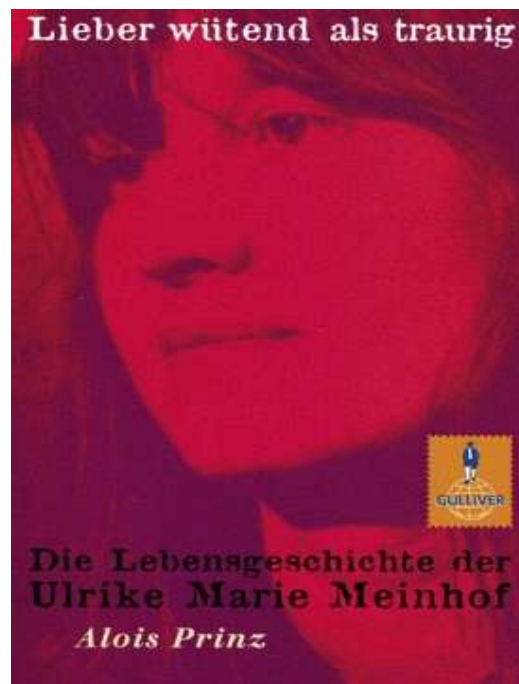
Abb. 4: Buchumschlag – Lieber wütend als traurig