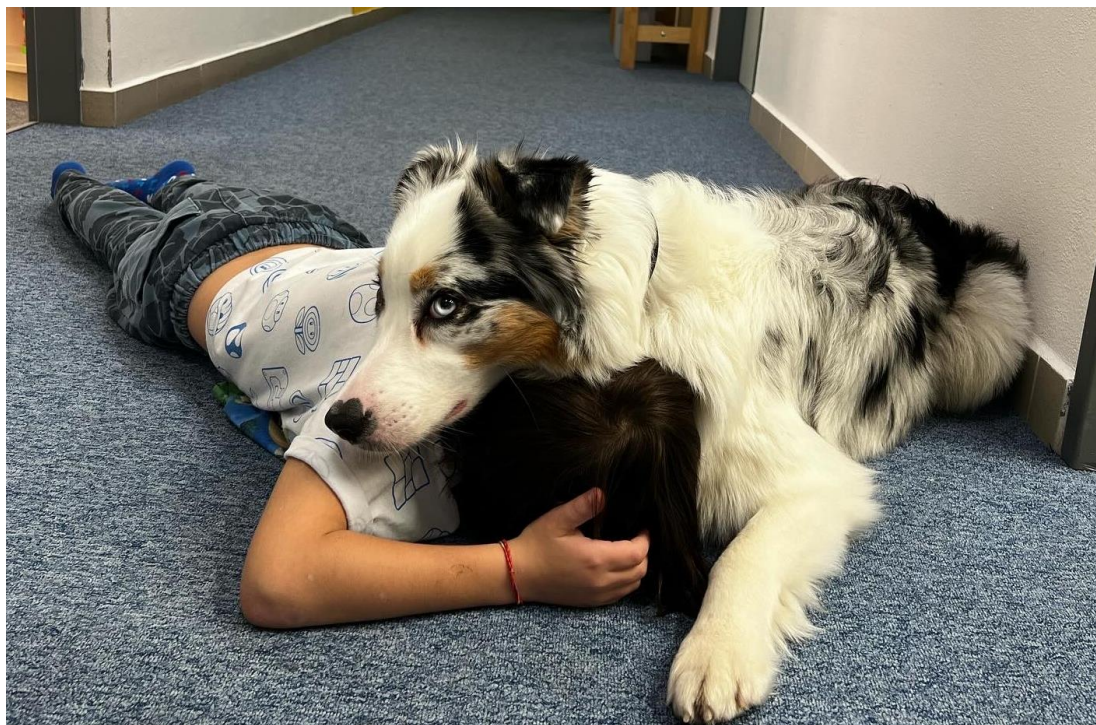
Příloha č. 6