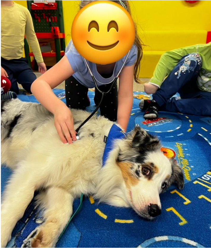
Příloha č. 9