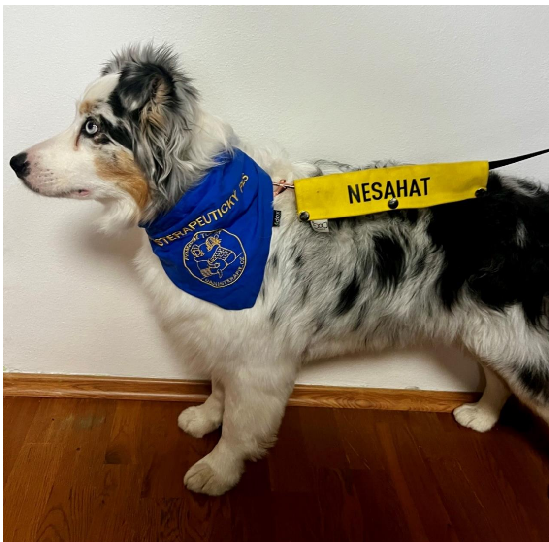
Příloha č. 16