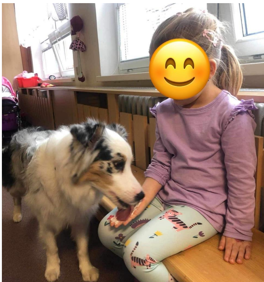
Příloha č. 12