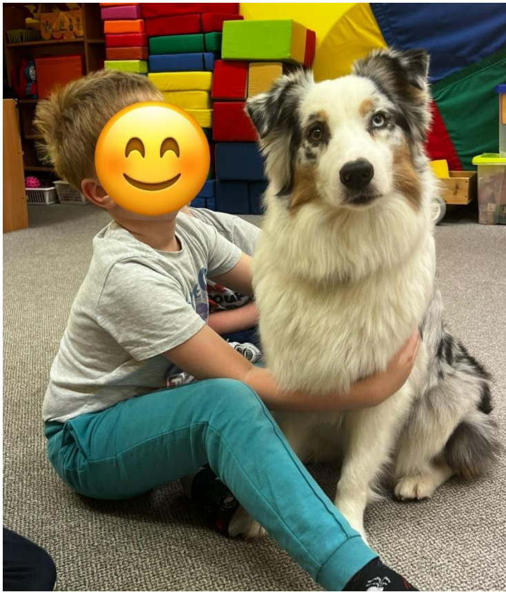
Příloha č. 17