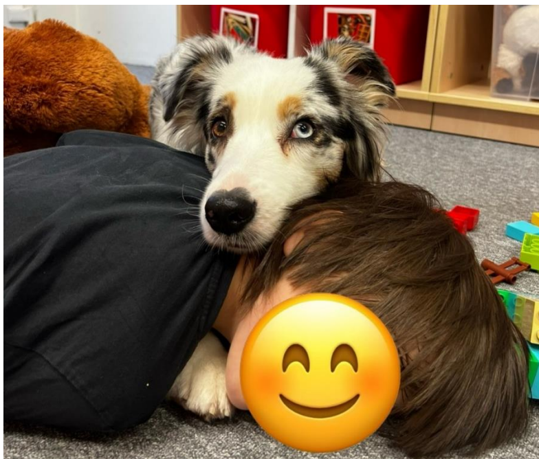
Příloha č. 8