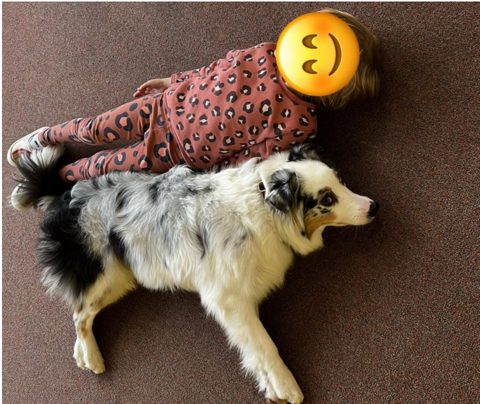
Příloha č. 7