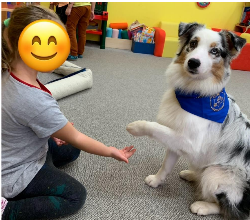
Příloha č. 11