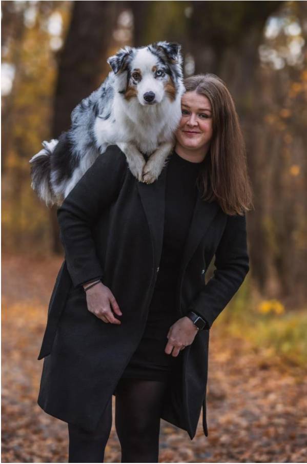
Příloha č. 1