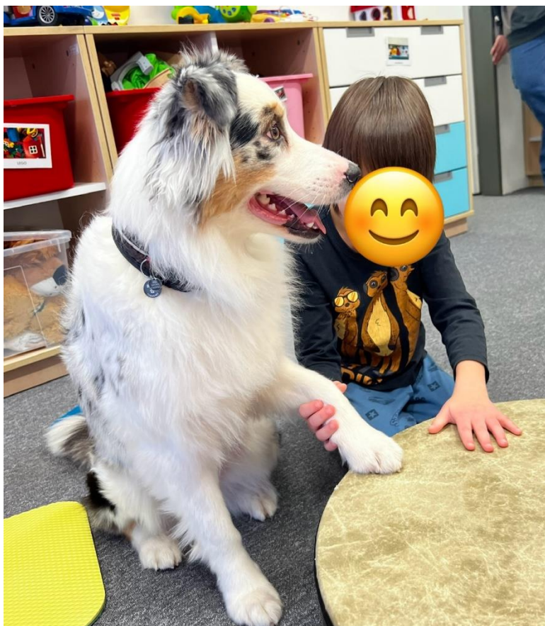
Příloha č. 5