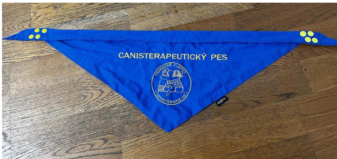
Příloha č. 15