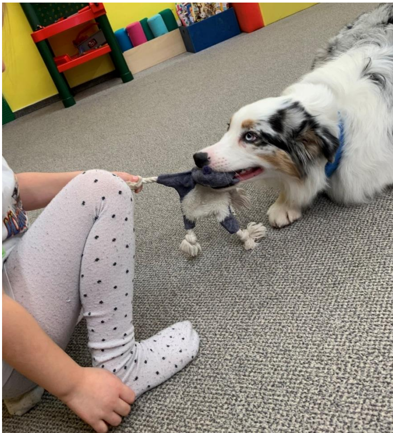
Příloha č. 10