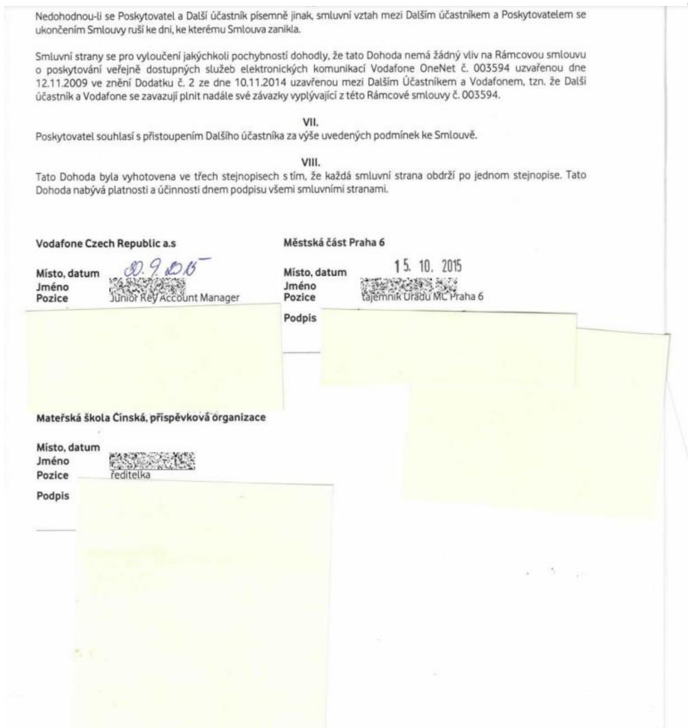
Obrázek 5 Dohoda o přistoupení Vodafone 2