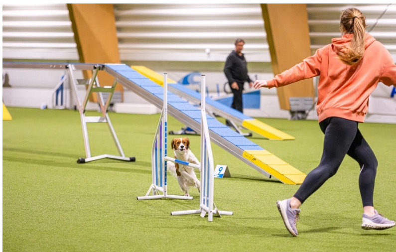
Obrázek 2 - agility soutěž

Zapojení do agility může posílit vztah mezi majiteli a jejich psy, a zároveň poskytnout motivaci pro zvýšenou fyzickou aktivitu. Předpokládá se, že účast majitelů psů na psích sportech, jako je agility, může posilovat emocionální pouto mezi majiteli a jejich psy. Zájem majitelů o výcvikové aktivity, včetně agility, pravděpodobně vychází z jejich silného vztahu se psy, a účast v těchto aktivitách dále upevňuje tuto citovou vazbu. Výzkum také ukazuje, že závodníci v agility často uvádějí spojení s psem jako hlavní motivaci pro svou účast v tomto sportu, což dále podtrhuje důležitost citového spojení mezi majiteli a psy při těchto aktivitách (Karvinen & Rhodes 2021).