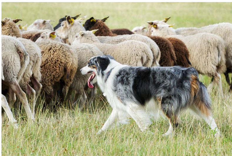
Obrázek 4 - border kolie korigující směr stáda ovcí