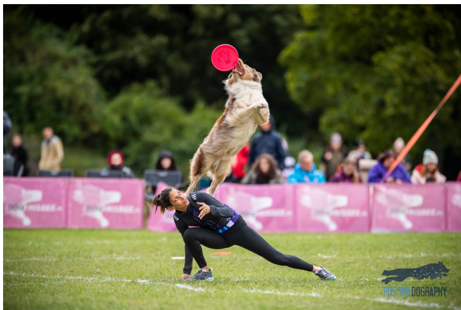
Obrázek 6 - psovod se svým psem při freestylu

Freestyle zahrnuje choreografickou sestavu z různých prvků za doprovodu hudby (Obrázek 6). Cílem je provést co nejrozmanitější, neoriginálnější a nejplynulejší sestavu, dle vlastní fantazie a individuálních schopností psa. Sestava se pohybuje v rozmezí 1–2 minut (Brunke et. 2023).