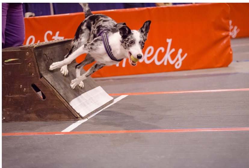
Obrázek 5 - flyballový box

Flyball je kolektivní kynologický sport, který vyžaduje spolupráci mezi psy a psovody. Jeho oblíbenost mezi majiteli stále stoupá a má své řídicí organizace po celém světě. Při flyballu mezi sebou soutěží dva týmy. Každý tým se skládá z pěti lidí a čtyř psů, kteří závodí na dvou paralelně postavených drahách. Dráha se skládá z celkem 4 překážek umístěných ve vzdálenosti 3 metrů od sebe. Výška překážek, na kterou dané družstvo běží, je dána velikostí nejmenšího psa v týmu. Na konci je umístěn odpružený flyballový box s tenisovým míčkem (Obrázek 5), který si musí pes sám spustit, aby míček získal. Následně se musí přes dráhu vrátit a míček přinést. Další pes nemůže překročit startovní čáru, dokud se předchozí pes nevrátí přes všechny 4 skoky a nepřekročil cílovou čáru. Vyhrává tým, který má rychleji v cíli všechny psy a míčky (The North American Flyball Association 2019).