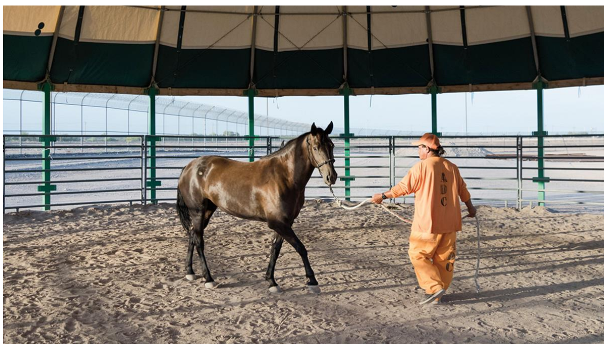
Obrázek 1: Vězeň budující pouto a důvěru s koněm z programu WHIP

Výsledkem této činnosti je posílení vlastního respektu a sebevědomí. Tato zvýšená sebeúcta a sebevědomí se vytvářejí na úkor mustangů, kteří při svém odchytu, domestikaci a prodeji ztrácejí svou samostatnost a autonomii. Možnost zkrotit divokost u mustangů evokuje podobný scénář s koňmi, jaký představuje vlastní uvěznění odsouzených (Hansen 2011).