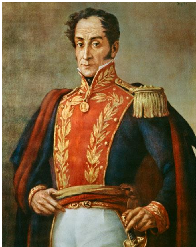
Obrázek 6. Simón Bolívar 140

Ukázka dobového portrétu Simóna Bolívara může sloužit jako vhodná didaktická pomůcka při prezentaci historického kontextu Venezuely a Bolívie.