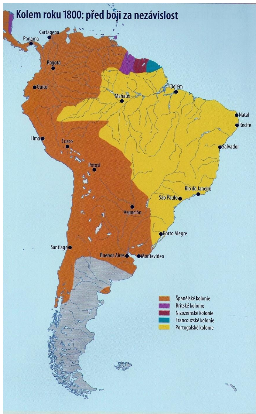
Obrázek 5. Mapa Jižní Ameriky kolem roku 1800. 139