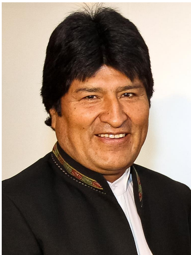
Obrázek 7. Evo Morales 141

Pro zpestření hodin je vhodná také ukázka prezidenta Bolívie Evo Moralese s indiánskými rysy.