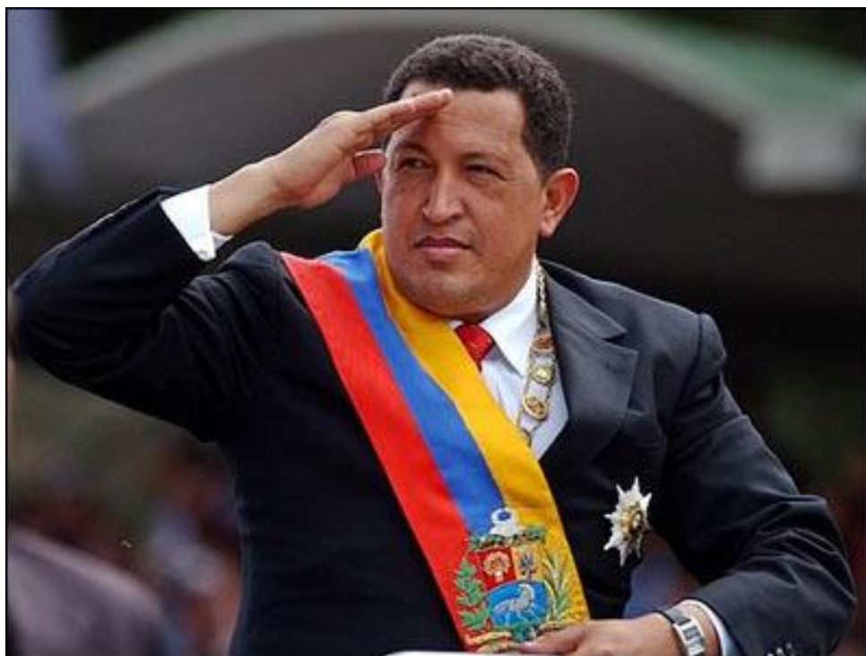
Obrázek 8. Hugo Chávez 142

Na fotografii je zachycen bývalý vůdce Venezuely Hugo Chávez. Jeho charismatický vzhled může do hodin posloužit jako vhodná ukázka.