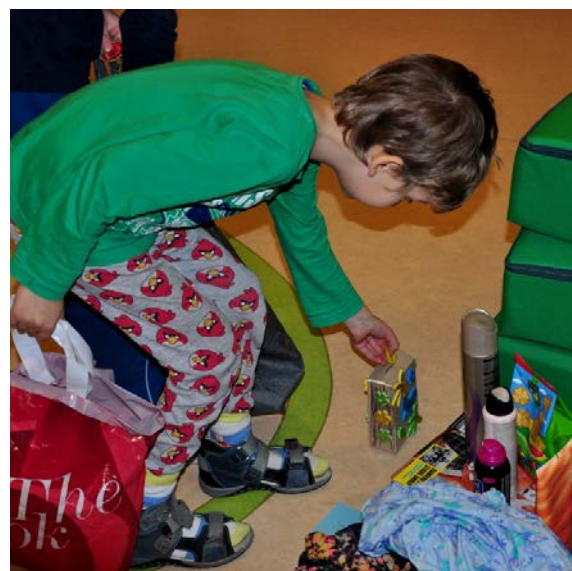
Aktivita č. 18: Nakupování předmětů, vložení mincí do pokladničky.