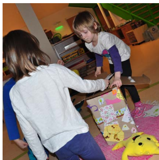
Aktivita č. 14: Na co mám talent? Vložení hvězdy do aflatouní krabice.