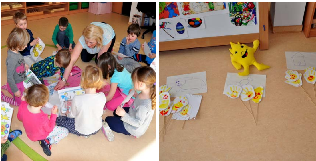
Aktivita č. 20: Co vidím, hlasování o naložení s vydělanými penězi.