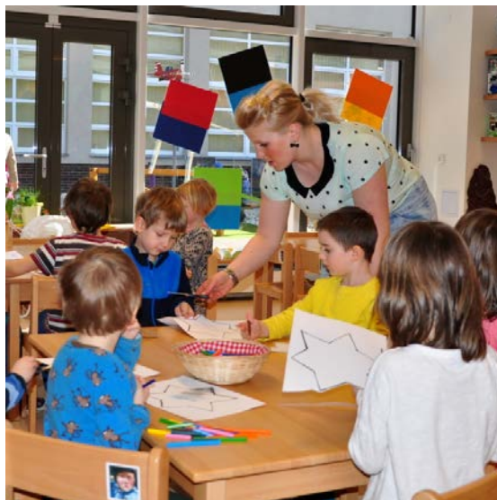
Aktivita č. 14: Co mi jde, co dělám to rád? Výroba hvězdy.