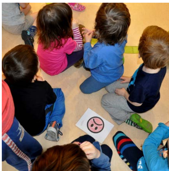
Aktivita č. 19: Obrázky o šetření peněz, nakupování a půjčování, hra na pravdivé/nepravdivé výroky.