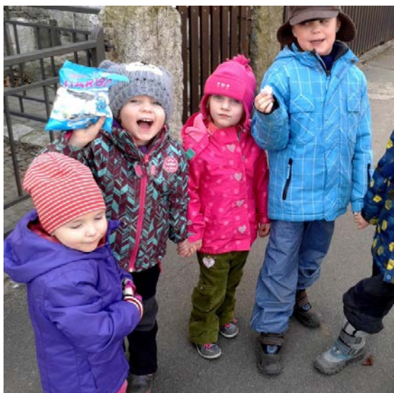
Aktivita č. 12: Návštěva obchodu, nákup zboží.