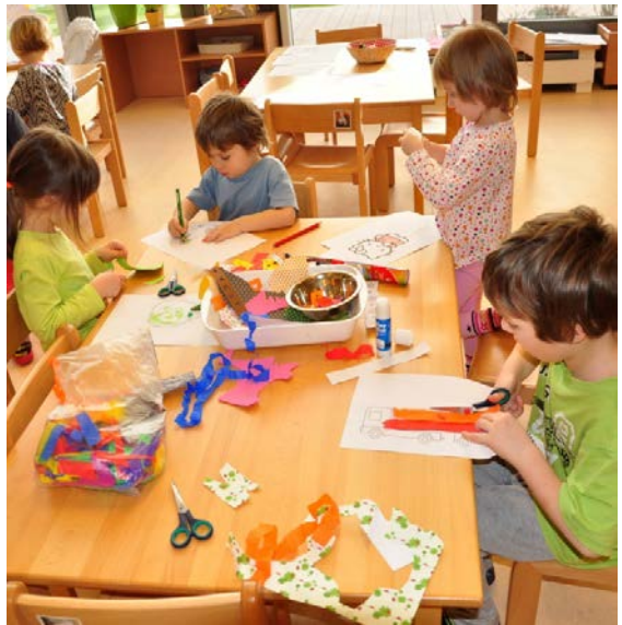
Aktivita č. 7: Hra na emoce, výroba přáníček.