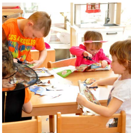
Aktivita č. 3: Co je živé a neživé, výroba koláže.