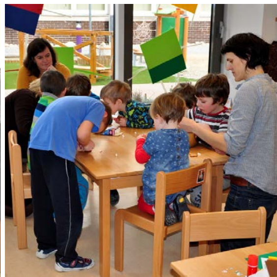
Aktivita č. 15: Předvelikonoční dílna -keramika, zdobení perníčků.