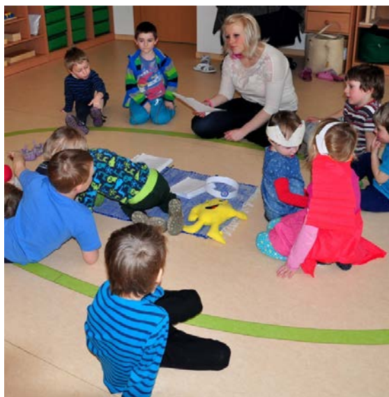
Aktivita č. 15: Prohlížení mincí, příběh O minci.