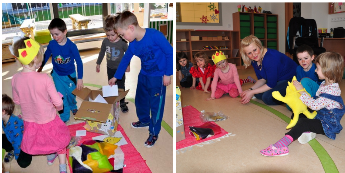
Aktivita č. 13: Vložení domácího úkolu do aflatouní krabice, seznámení s plyškem Aflatouna.