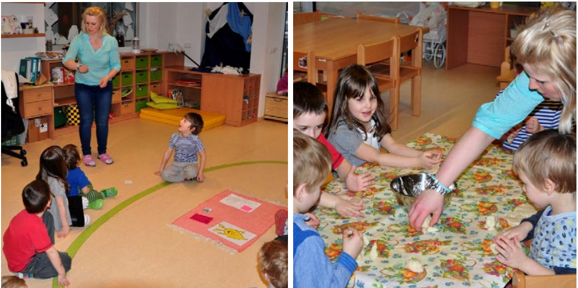
Aktivita č. 9: Pantomima povolání -děti hádají, modelování toho, co potřebují rodiče ke svému zaměstnání.