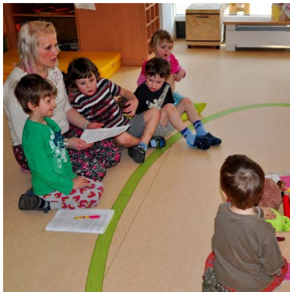
Aktivita č. 16: Volná hra dětí s oblíbeným předmětem/hračkou, příběh O mravenci a luční kobylce.