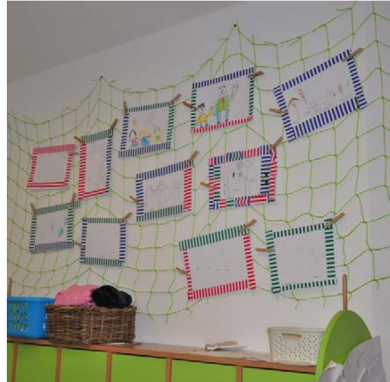
Aktivita č.6: Výroba rámečku na obrázek rodiny, vystavená díla