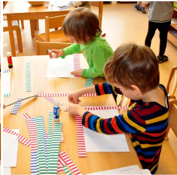
Aktivita č. 6: Výroba rámečku na obrázek své rodiny.