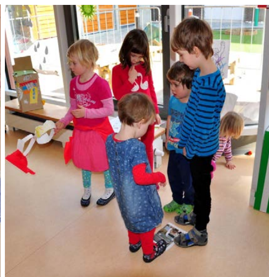
Aktivita č. 15: Hra Na minci, kde se vyrábí peníze?