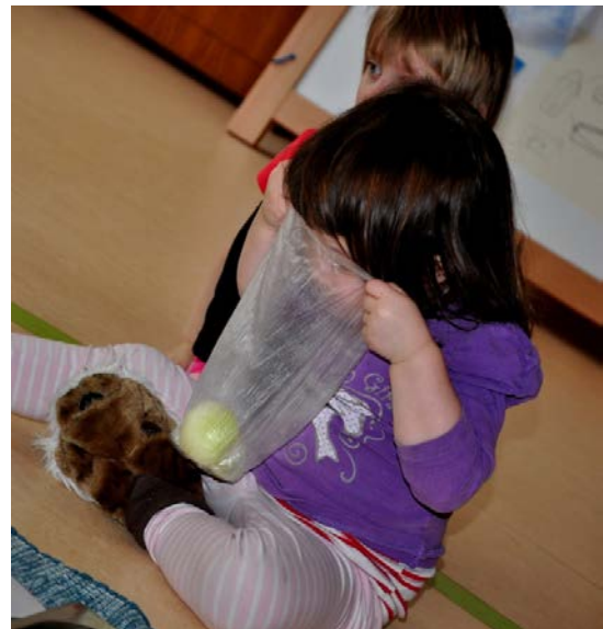
Aktivita č. 5: Ochutnávání potravin, co nám voní a nevoní.