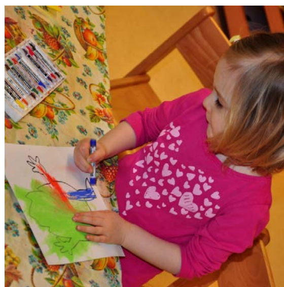
Aktivita č. 4: Malba barevných Aflatounů, podle oblíbené barvy.