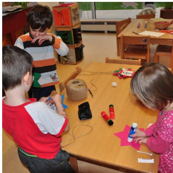
Aktivita č.10: Čím bych chtěl být? Výroba hvězdy.