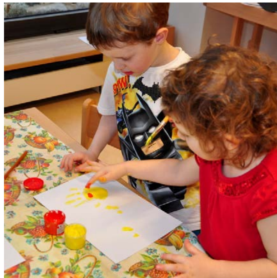
Aktivita č. 1: Otisk ruky, výroba loutky.