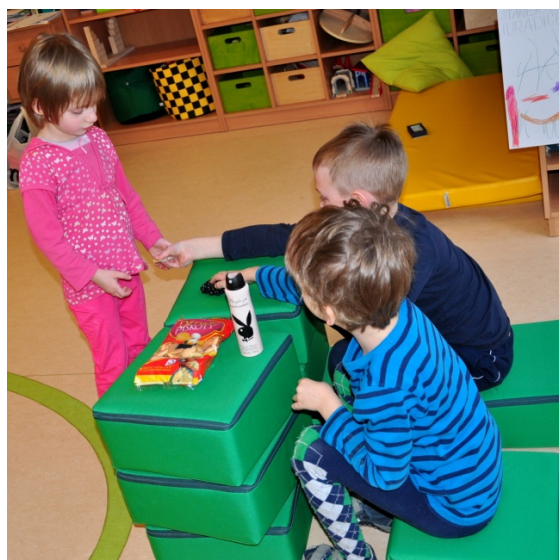
Aktivita č. 12: Hra na obchod.