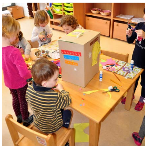
Aktivita č. 2: Ptačí hnízdo a výroba aflatouní krabice.