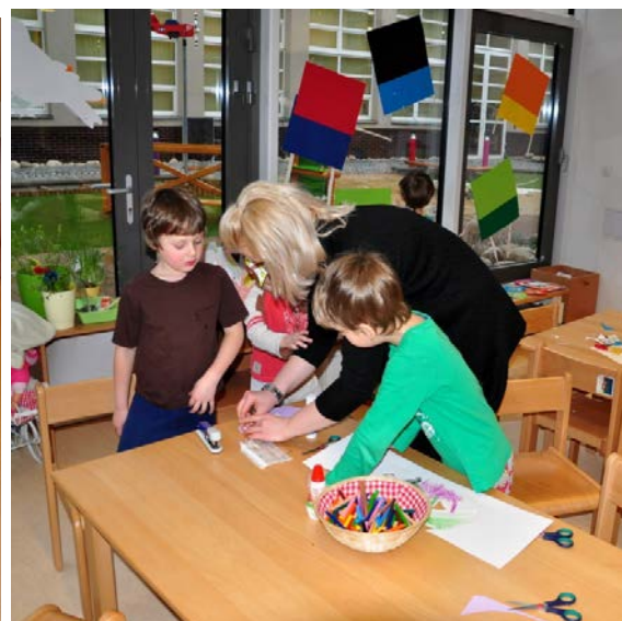
Aktivita č. 17: Příběh o jeřábovi, tvorba společné koláže "Můj nejlepší kamarád".