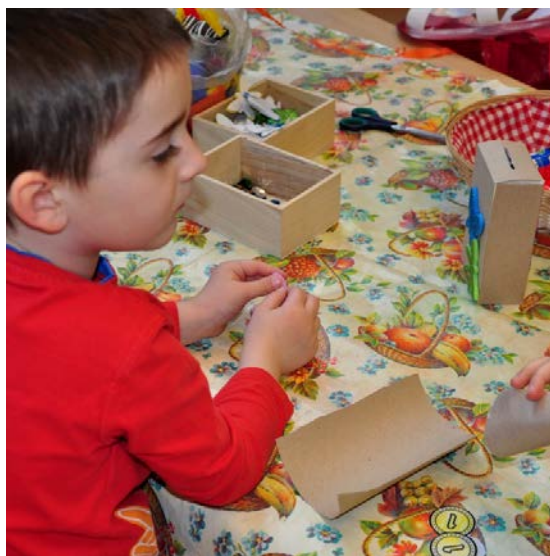
Aktivita č. 11: Výroba aflatouních peněz, výroba pokladničky.