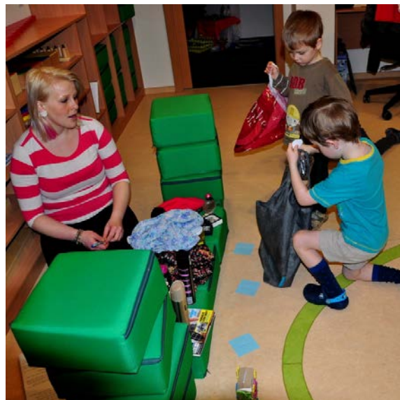
Aktivita č. 18: Rozdělení do skupin, proces nakupování.