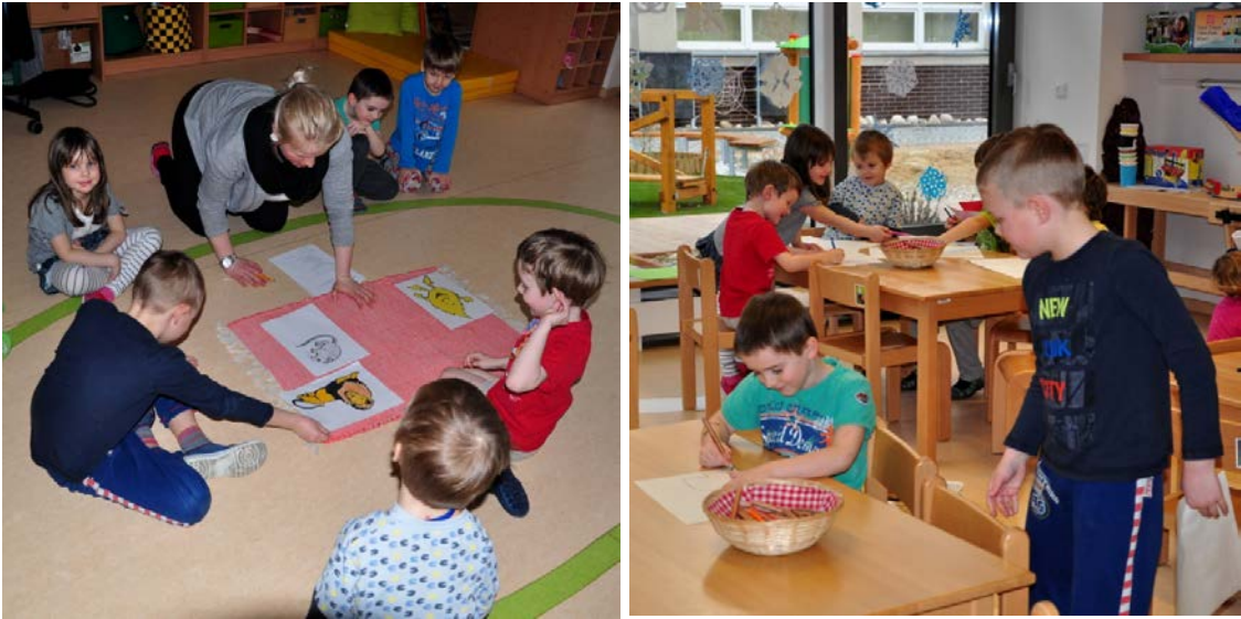
Aktivita č. 8: Příběh O lvovi a myšce, kreslení nejlepšího kamaráda.