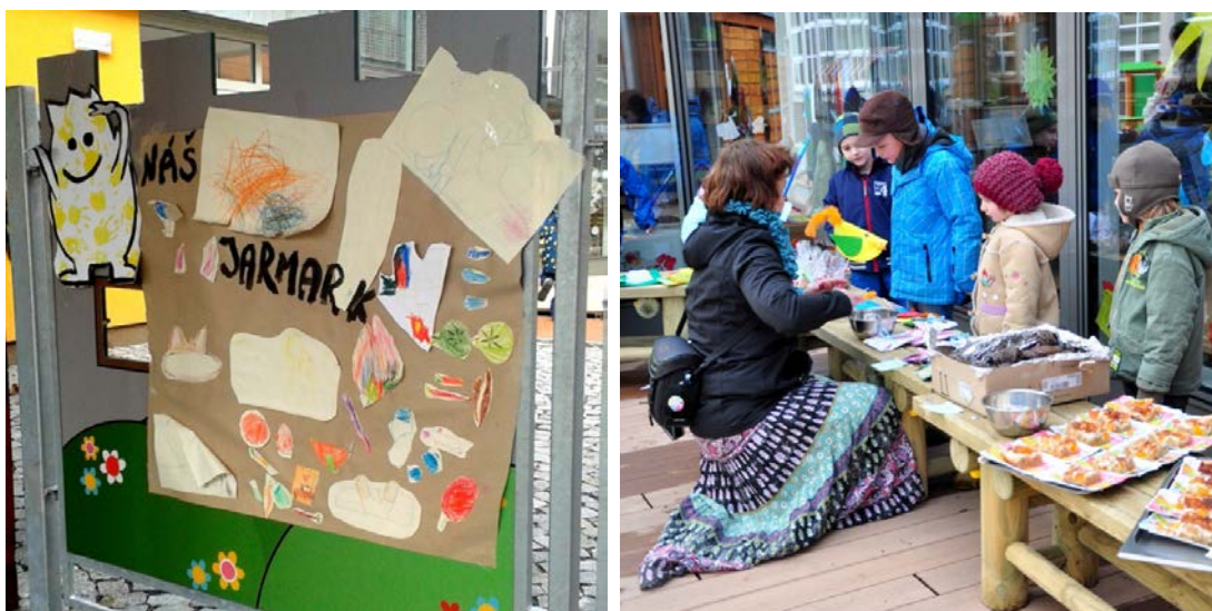
Aktivita č. 20: Společný plakát, děti v roli prodavačů.