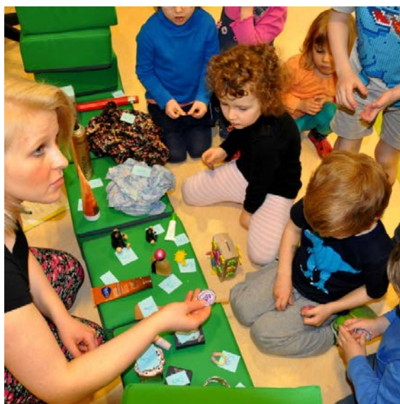
Aktivita č. 19: Prohlédnutí nabízeného zboží, nákup.