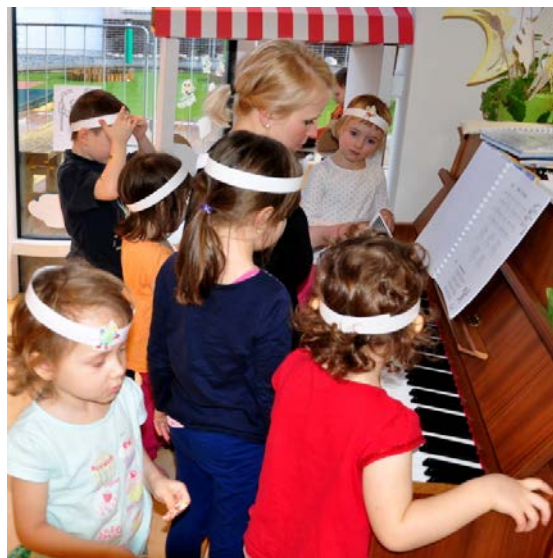
Aktivita č. 1: Výroba aflatouní čelenky, zpěv písně.