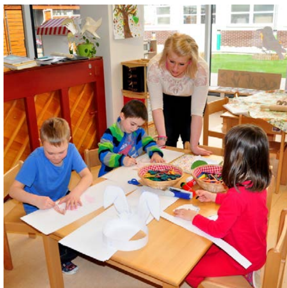
Aktivita č. 15: Předvelikonoční dílna - výroba přáníček, králičích uší.