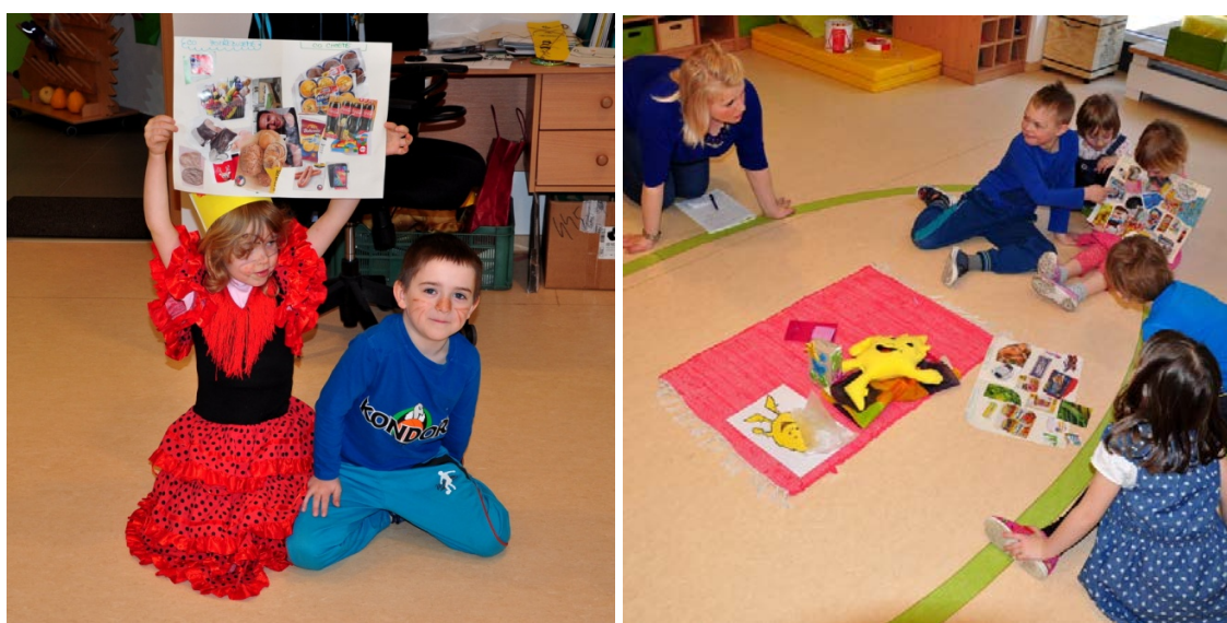
Aktivita č. 13: Co potřebujeme X co chceme, práce ve dvojicích.