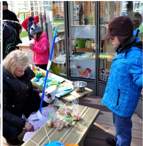
Aktivita č. 20: Prodej vyrobeného zboží.