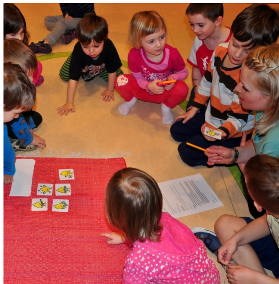
Aktivita č. 10: V čem vyniká Aflatoun?