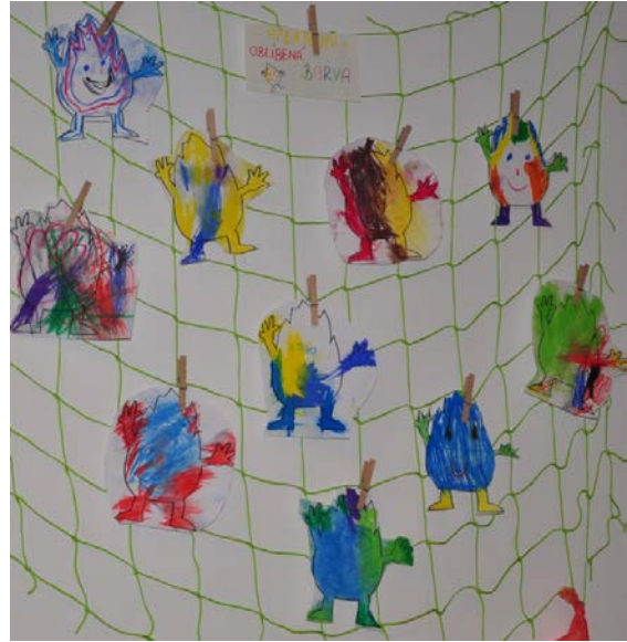
Aktivita č. 4: Pohádka O pěti bratřech, nástěnka z barevných Aflatounů.