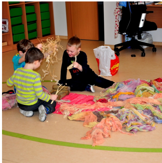
Aktivita č. 2: Výroba ptáčka Sinty a ptačího hnízda, dělení na skupiny.