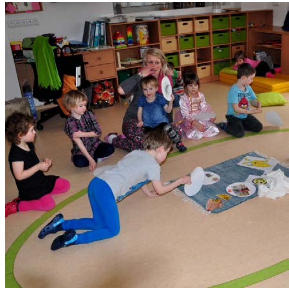
Aktivita č. 5: Výroba koláže - Co máme rádi, reflexe obrázků na elipse.