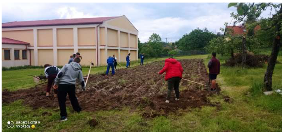
Obrázek č.4: Zoráný pozemek na jaře 2021 a pracovní vyučování

Již druhým rokem byla na jaře část pozemku zorána a snažíme se alespoň v hodinách pracovního vyučování na pozemcích hospodařit. Někteří žáci ovšem vědomě ničí nářadí, neuposlechnou pokynů a nevnímají instruktáž, jak držet a obsluhovat nářadí (viz obrázek č.4) a o to náročnější tak práce je. Na to, aby vše rostlo a dosáhli jsme úrody, samozřejmě musí navázat i mimoškolní péče. Tam se nám první rok úplně nepovedlo navázat dokonale, protože vychovatelé mají směnný provoz, komunikace mezi školou a výchovou tedy o prázdninách selhala. V červenci tedy nikdo nezaléval a bohužel ani nesklidil námi zasazenou sadbu. Minulý školní rok se nám podařilo nasázet cibuli, sehnat sadbu košťálovin (zelí, květák, brokolice, kedluben), plodové