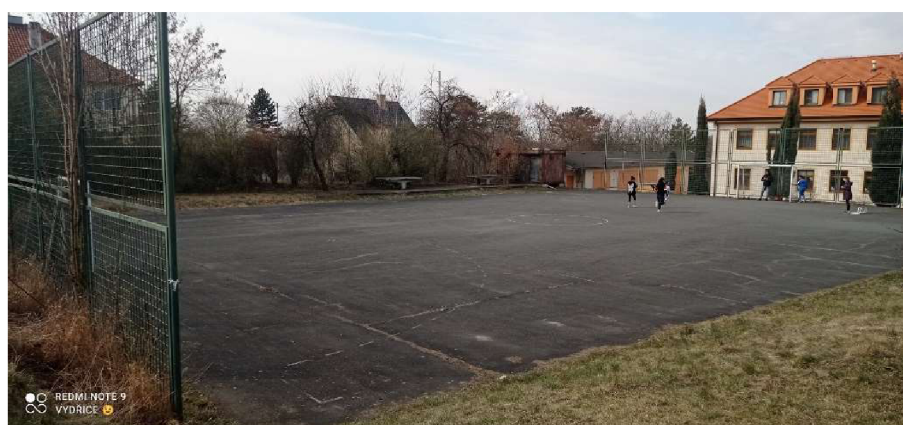
Obrázek č. 7: Funkční asfaltové hřiště (stav v březnu 2022)

Sportoviště, které se zde ve velké míře využívá nejen při venkovním tělocviku, ale často na výchově při odpolední aktivitě, je bohužel zanedbané a neudržované. Hřiště, které je základem asfaltové fotbalové hřiště s bránami. U tohoto hřiště jsou 2 venkovní stoly na stolní tenis, který ale pro absenci laviček mnohdy žáci vyžívají spíše k sezení. Vlivem počasí a minimální údržby jsou stoly již zcela nefunkční a zarostlé nálety.