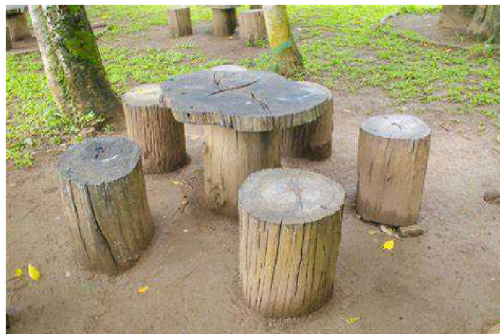
Obr.č. 15. – inspirace možného sezení

Lavičky, které jsou opravdu nutnost není třeba pořizovat nové, naopak. Vhodnější a výchovnější je pořídit přírodní a nízkonákladové sezení. Tzn. renovovat či opravit staré lavičky, použít např. vyvrácený kmen stromu, kameny.