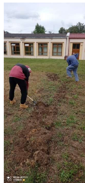
Obr. č. 11. – fyzická práce na poli

V současné době má pole výměru 40m 2 . Pěstuje se jarní zelenina (ředkvičky, jarní cibulka, kedlubny, polní salát), ale i plodová zelenina (rajče tyčkové, okurka hadovka, nakládačka).