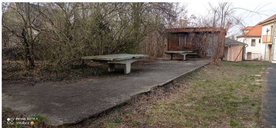
Obrázek. č. 10 Nefunkční stoly na tenis (stav v březnu 2022)

Hřiště, které je součástí areálu je základem asfaltové velké fotbalové hřiště s bránami. U tohoto hřiště je venkovní stůl na stolní tenis, který ale pro absenci laviček mnohdy žáci využívají spíše k sezení. Je vlivem počasí a minimální údržby již nefunkční a zarostlý nálety.