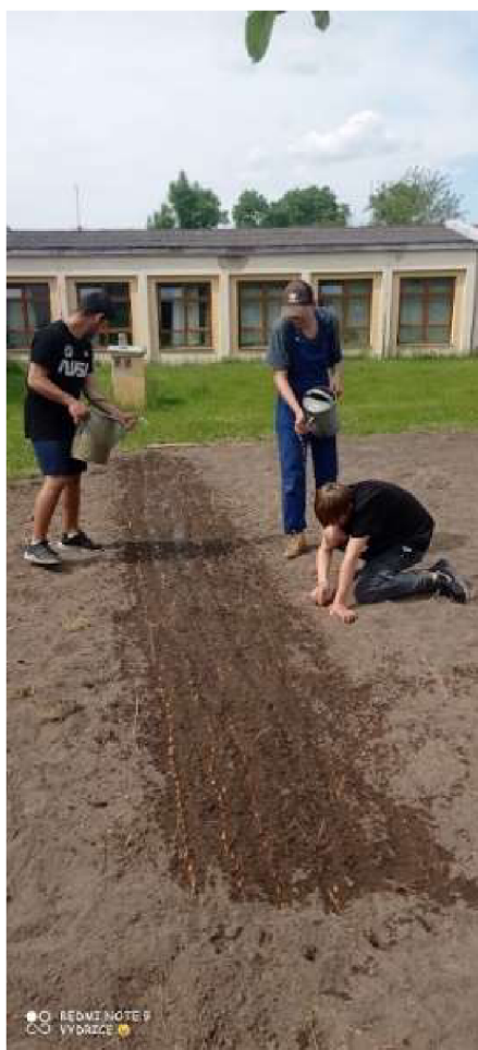
Obrázek č. 9: Obhospodařovatelné pole (2021)

Důležitou součástí naší školní zahrady je kompost. Snažíme se tam ukládat veškerý rostlinný materiál ze zahrady, ale i z kuchyně či přípravy jídel. Nutný je dohled, aby se na kompost vyváželo, tak jak je potřeba, aby se jednotlivé vrstvy promíchaly. Prosátá zemina bude využita na pozemku.