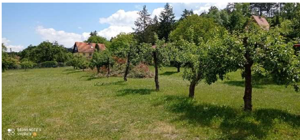
Obrázek č. 12. Ovocné stromy - jabloně

Na zahradě DDŠ je jabloň domácí ( Malus domestica – 12 ks), hrušeň obecná ( Pyrus communis 3ks), třešen ( Prunus – 2ks).