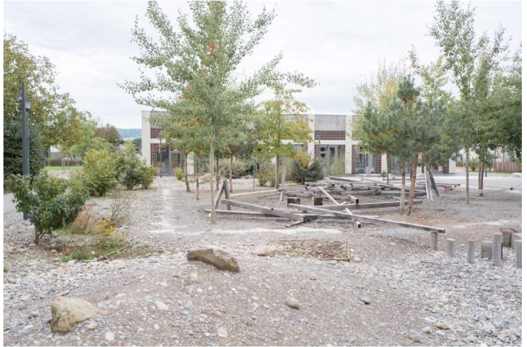
Landezine, Slovinsko

Vše bylo navrženo tak, aby jednotlivé prvky byly funkční a byly přínosem jak pro učitele při jejich výuce, tak pro mimoškolní činnosti s vychovateli. Výběr biotopů jsem volila podle dispozic a možností zahrady a přírodního okolí. Navíc byla snaha, aby zahrada poskytla žákům přehled nejběžnějších biotopů naší přírody. Simulace biotopů mokřadu nepřipadá z hlediska bezpečnosti v úvahu z provozních důvodů. Zatímco louky a luční porost jsou hojně rozšířené v okolí, jsou tedy nejpřirozenější.