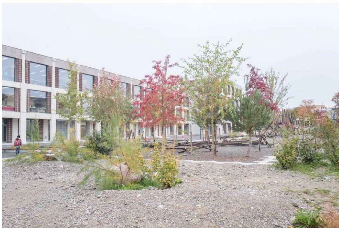
Obr. 13 – Inspirativní foto: areál ZŠ Krämeracker – Švýcarsko

Inspirací k mým teoretickým návrhům jsem čerpala z několika projektů. Dlouhodobě z nadace Proměny Karla Komárka, kde se snaží celkově zlepšovat přírodní prostředí měst, ale již několik let pořádají projekt „Měsíc školních zahrad“ a inspirují pedagogy i rodiče. Navíc se snaží propagovat učení venku, sdílí nové hry a výukové aktivity podporující učení v přírodě. Inspirativním projektem pro mě byl i návrh školní zahrady v Dolních Březanech (Grulich, 2015) či projekty, které jsou především v zahraničí velkým trendem. Jde o různé projekty základních škol, městských hřišť či parků (např. školní zahrada Krämeracker – Švýcarsko, kterou projektoval Ganz Landschaftsarchitekten, 2019).