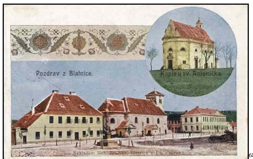
Příloha č. 1 - souhrnná fotografie Blatnice