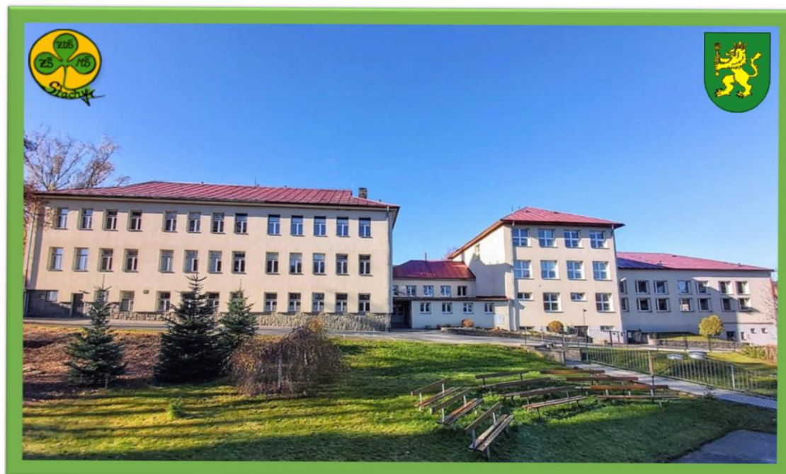
Obr. 17. Úplná základní škola v semiperiferním venkovském sídle Stachy – Zdroj: Základní, Základní umělecká a mateřská škola Stachy, https://www.kajov.eu/data/editor/97cs_5_big.jpg?gcm_date=1550138388 http://skolastachy.cz/wp-content/uploads/2023/02/Uvodni-foto-s-logy.jpg (31 .3. 2023).