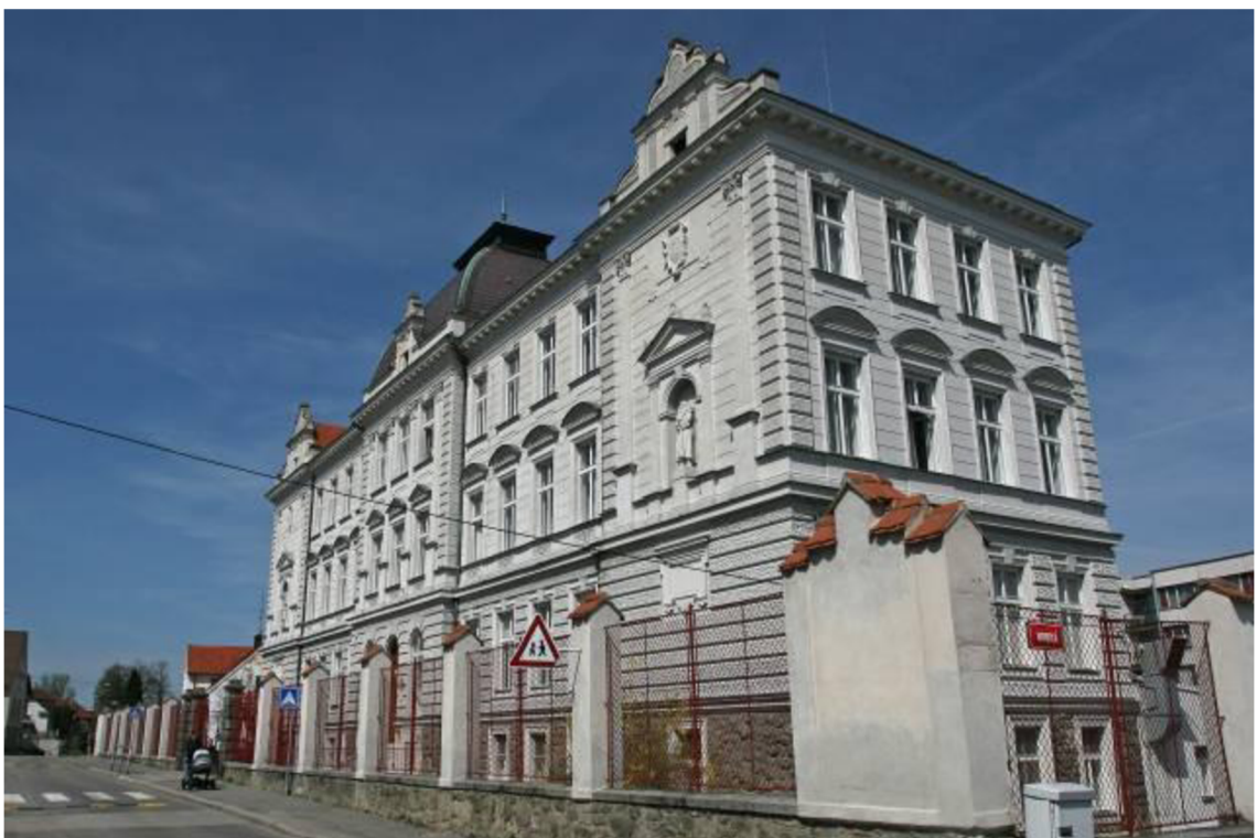
Obr. 9. Úplná základní škola v semiperiferní malé vesnici Netolice