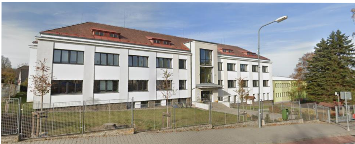
Obr. 3. Úplná základní škola v periferní vesnici Vacov