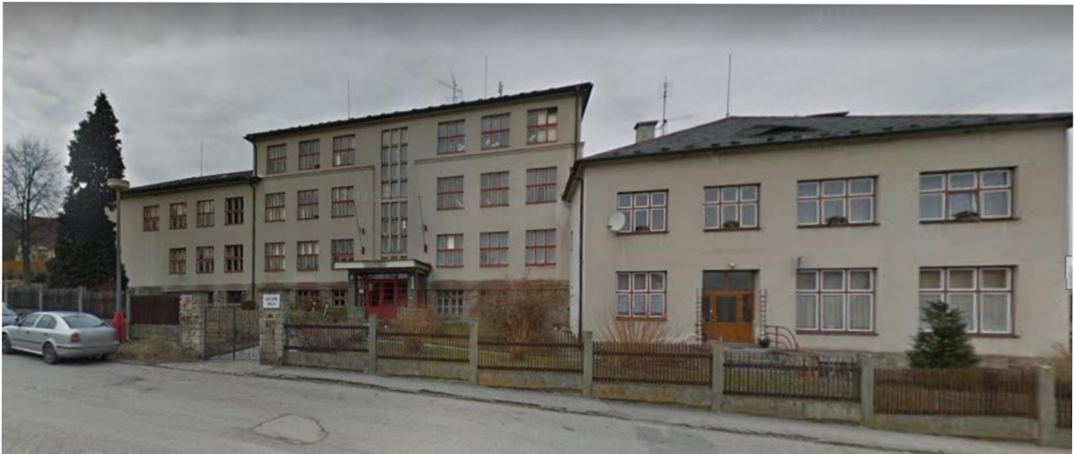
Obr. 2. Úplná základní škola v periferní vesnici Brloh