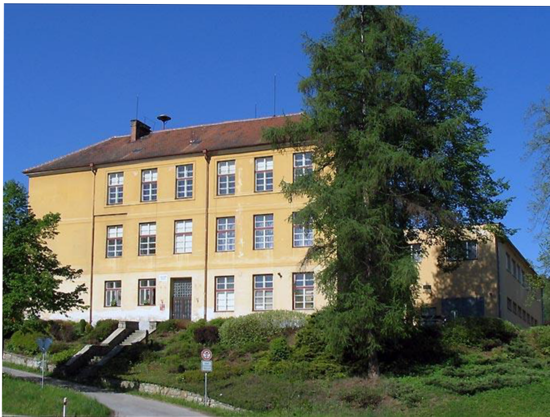
Obr. 16. Neúplná základní škola ve vnější suburbii Kájov