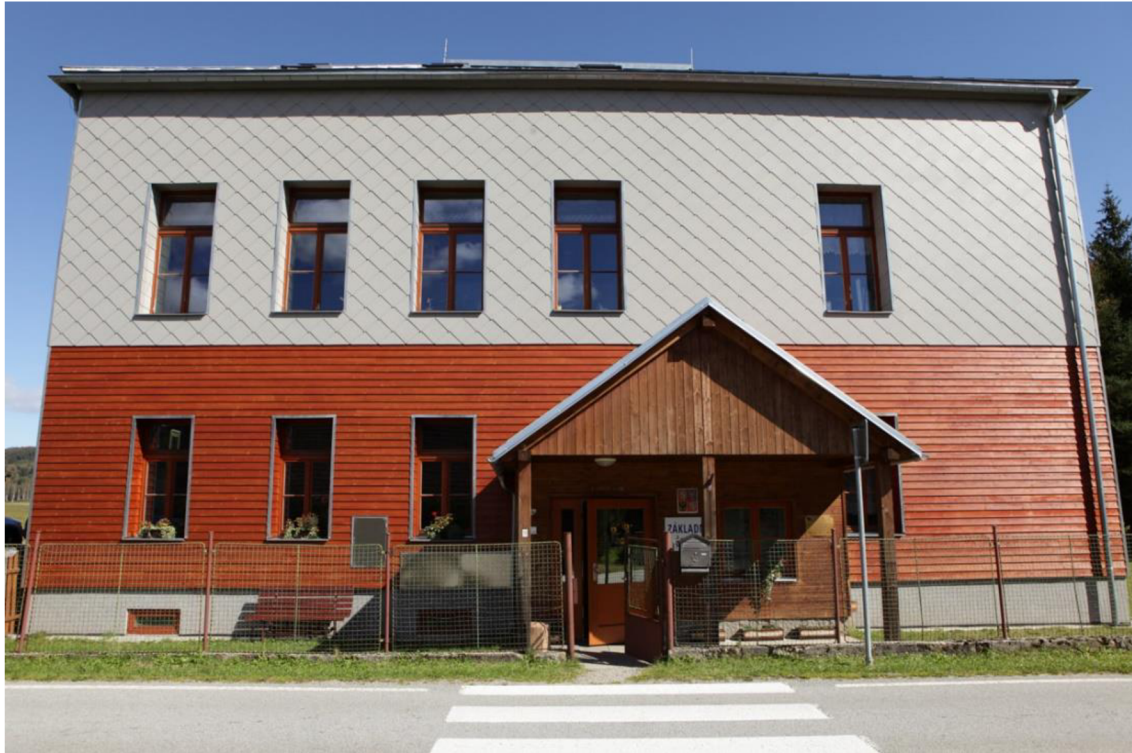
Obr. 10. Neúplná základní škola v periferní vesnici Borová Lada