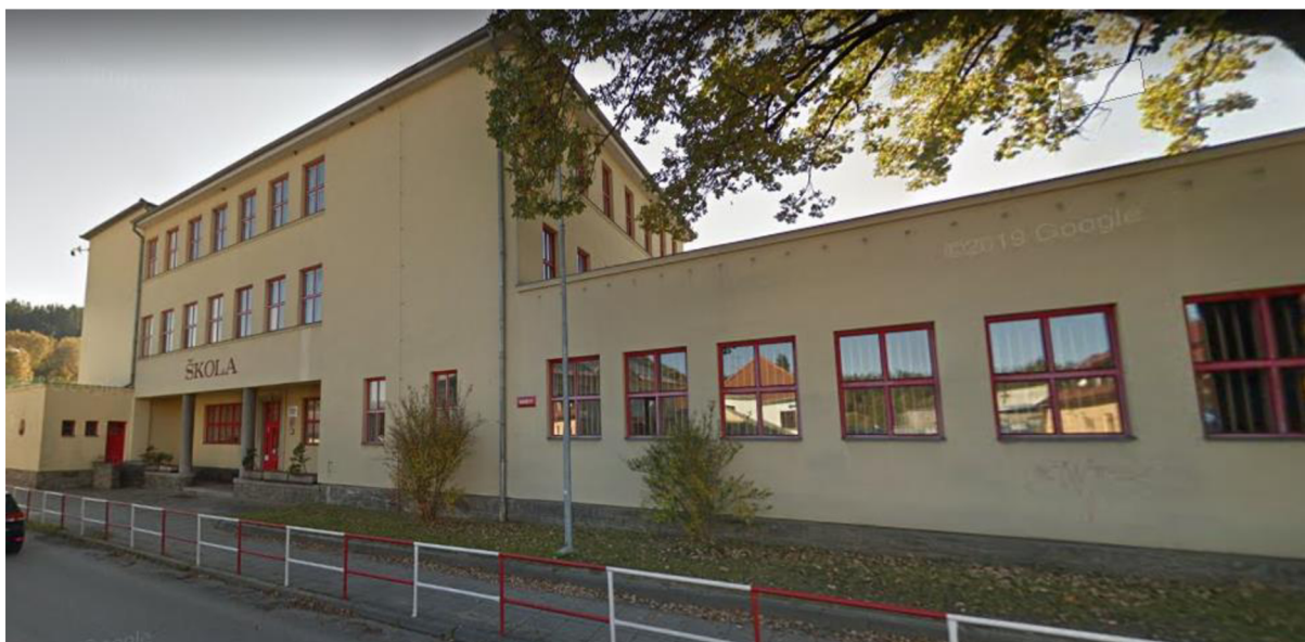
Obr. 4. Úplná základní škola v periferním malém městě Vyšší Brod