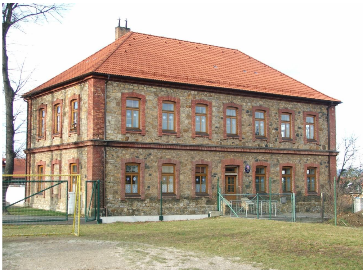
Obr. 5. Neúplná základní škola v semiperiferní vesnici Holubov