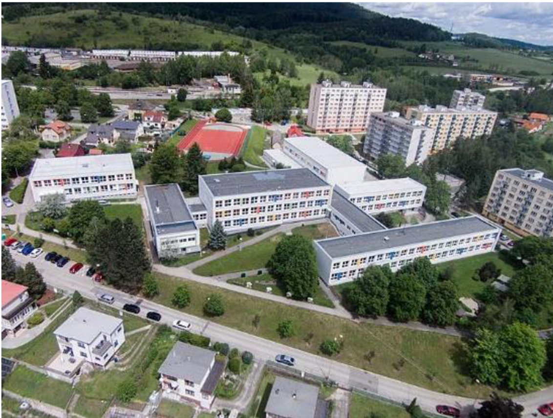
Obr. 11. Úplná základní škola ve městě Český Krumlov