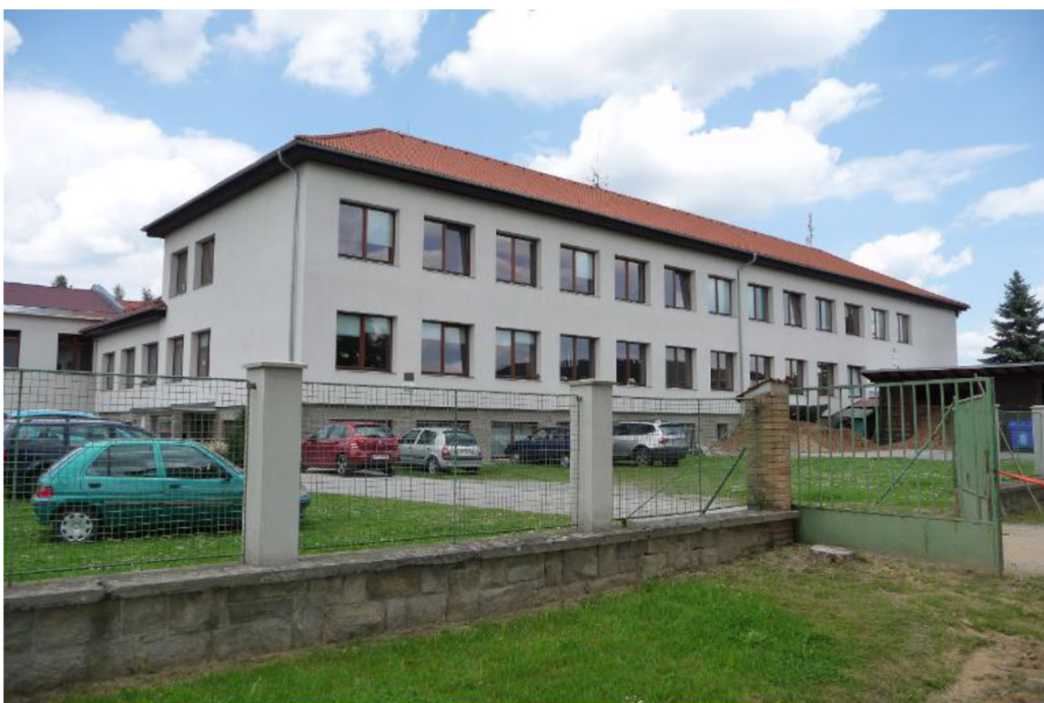
Obr. 13. Úplná základní škola v semiperiferním venkovském sídle Besednice