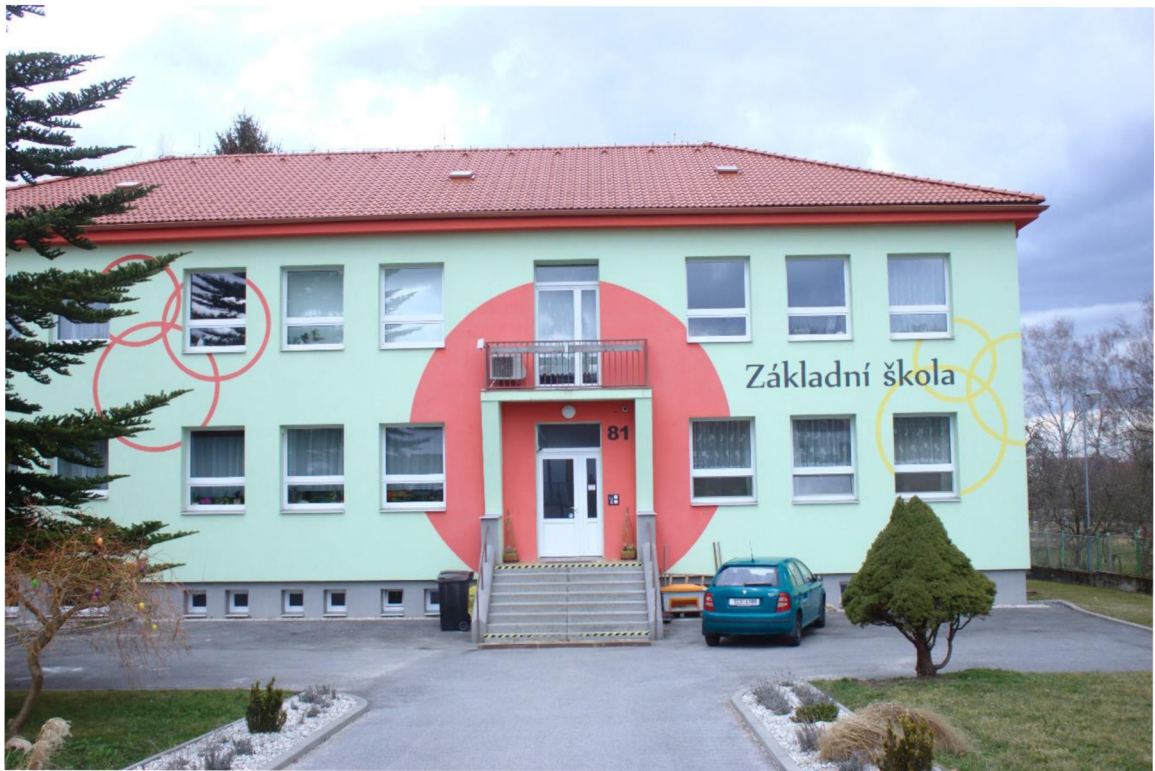
Obr. 14. Neúplná základní škola ve vnější suburbii Dolní Třebonín