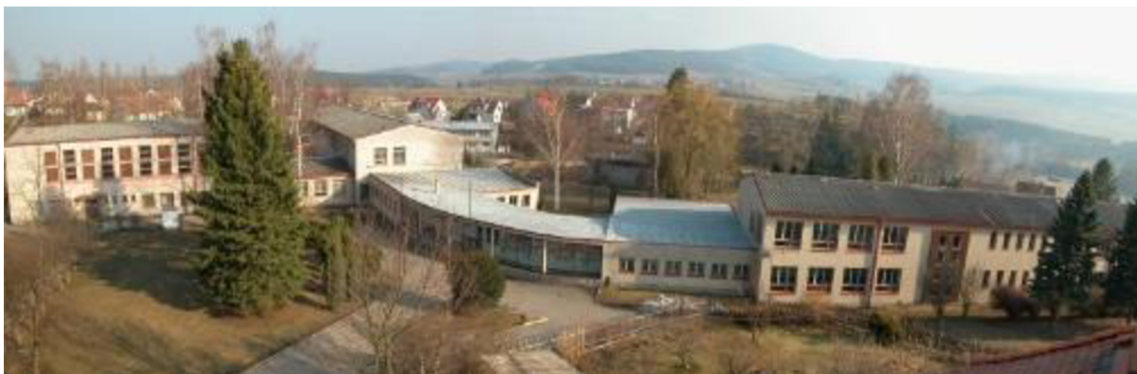
Obr. 12. Úplná základní škola v semiperiferní malé vesnici Křemže – Zdroj: Portál Česká školní inspekce, https://portal.csicr.cz/A03/e8ee205b71304693baeb96c95a947859_skola-panorama800.JPG (31 .3. 2023).