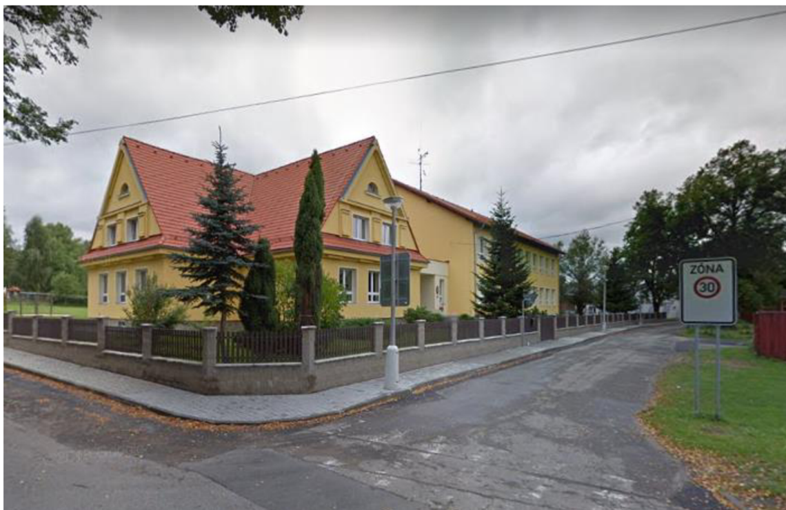
Obr. 6. Neúplná základní škola v semiperiferní vesnici Dolní Dvořiště