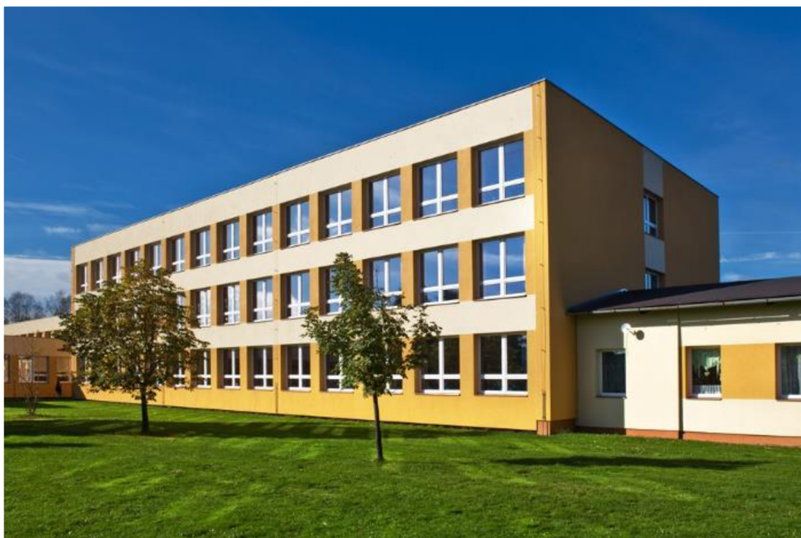
Obr. 7. Úplná základní škola v periferním malém městě Volary