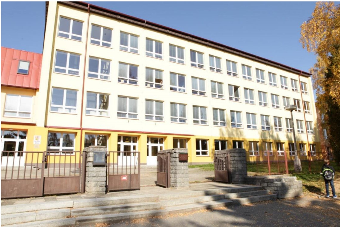
Obr. 8. Úplná základní škola ve městě Vimperk – Zdroj: Informační systém České unie sportu, https://iscus.cz/kraje/jihocesky/pasport/20992# (31 .3. 2023).