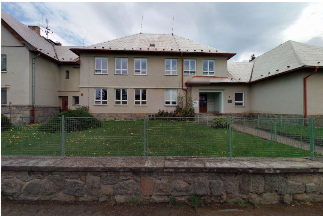
Obr. 15. Neúplná základní škola v periferní vesnici Horní Dvořiště