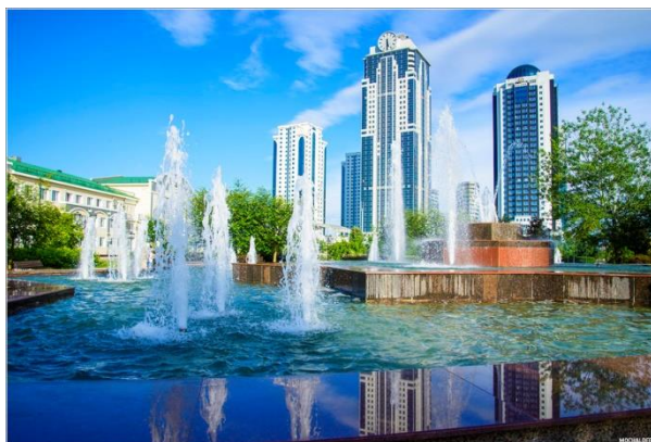
Obr. 19: Grozny-city

Grozny-city je komplex mrakodrapů, který se nachází v centru Grozného, v místě, kde třídu Kadyrova odděluje řeka Sunža. Výstavba začala v roce 2007 a byla dokončena 5. října 2011, což je zároveň den Grozného. Komplex zaujímá 4,5 ha. Nejvyšší budova Fenix má 40 pater, je zatím nejvyšší budovou severního Kavkazu. Vedle stojí 28 patrový pětihvězdičkový hotel Grozny-city, zleva stojí 29 patrové byznys centrum s přistávací plochou pro vrtulník. Do komplexu patří ještě dvě 18patrové budovy a jedna 28patrová s luxusními byty a kancelářskými prostory. V podzemí každého mrakodrapu je vybudováno dvoupatrové parkoviště (www.mochaloff.ru (43)).