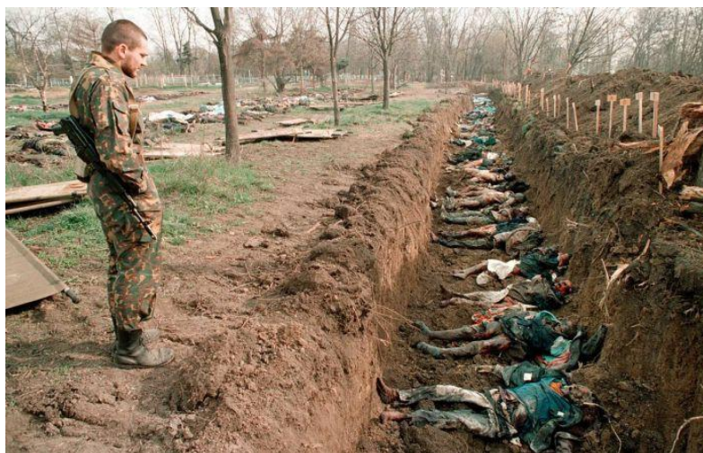
Obr. 3: První čečenská válka

s Dudajevem o ukončení válečných konfliktů. Jednání se neuskutečnilo. Dne 21. dubna 1996 byl Dudajev při výbuchu rakety zabit. Jeho nástupcem se stal Zelimchán Abdumuslimovič Jandarbijev, 27. května 1996 podepsal s Jelcinem mírovou dohodu, která byla opět oběma stranami porušena. Až na konci srpna 1996 byla v Dagestánu podepsána nová Chasavjurská mírová dohoda, která definitivně ukončila 1. čečenskou válku. I přesto byl status Čečenska nedořešený a na dalších 5 let odložen (Souleimanov, 2011, 111-135; Gall, Wall, 2000, 11-26; www.navychod.cz (3)).