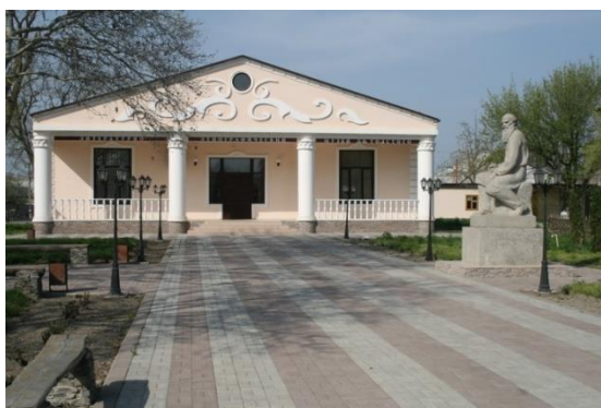
Obr. 16: Literárně-etnografické muzeum L. N. Tolstého

Muzeum je věnováno životu a dílu významného ruského spisovatele L. N. Tolstého. Budova se nachází 50 kilometrů severovýchodně od hlavního města Čečenska ve vesnici Starogladovskaja, v bývalé škole, která byla postavena v roce 1913. Nedaleko odtud v 50. letech 19. žtoletí žil tři roky Lev Nikolajevič Tolstoj. Napsal zde povídku Dětství . Dne 10. prosince 2010 proběhlo slavnostní otevření muzea v nové budově ( www.chechentour.com (39)).