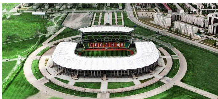
Obr. 22: Achmat-Arena

Pro sportovní nadšence, či fanoušky je v Čečensku stadion Achmat-Arena, který je součástí multifunkčního sportovního areálu Achamta Chadži Kadyrova. Rozloha areálu je 17 hektarů, díky tomu je největší v Rusku. Stadion byl uveden do provozu na jaře 2011. Kapacita areálu je 30 tisíc lidí. Achmat-Arena plně odpovídá standardům UEFA a FIFA. Sportovní areál se stal jedním z nejzajímavějších v Rusku díky svému architektonickému vzhledu a funkčnosti ( www.fc-akhmat.ru (48)).