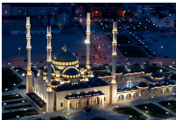
Obr. 10: Mešita Achmata Kadyrova

Mešita je postavena v klasickém osmanském stylu, nad hlavním sálem se klene rozsáhlá kupole. Výška minaretů dosahuje 63 metrů, jsou nejvyššími v celém Rusku. Rozloha mešity zaujímá 500 metrů čtverečních a její kapacita je 10 tisíc lidí. Venkovní i vnitřní stěny jsou obloženy mramorem. V mešitě je 36 lustrů, jeden z nich je osmimetrový a napodobuje svatyni v Mekce (Путеводитель по Чеченской республике,2017,20).