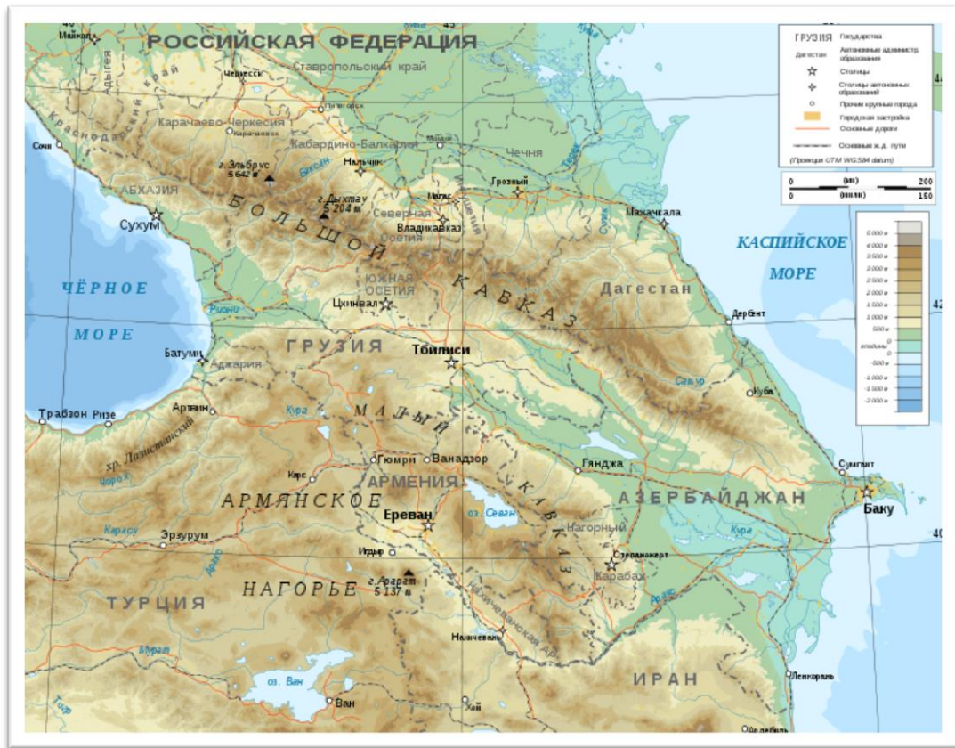
Obr. 1: Topografická mapa Kavkazu

Čečenská republika se nachází na území severního Kavkazu. Na jihu sousedí s Gruzii, na jihovýchodě, východě a severovýchodě s Dagestánem, na severozápadě se Stavropolským krajem a Severní Osetií-Alanií a na západě s Inguškem. Čečenská republika, Dagestán, Inguško, Kabradsko-Balkarsko, Karačajevsko-Čerkesko a Severní Osetie-Alánie patří společně do Severokavkazského federálního okruhu Ruské federace.