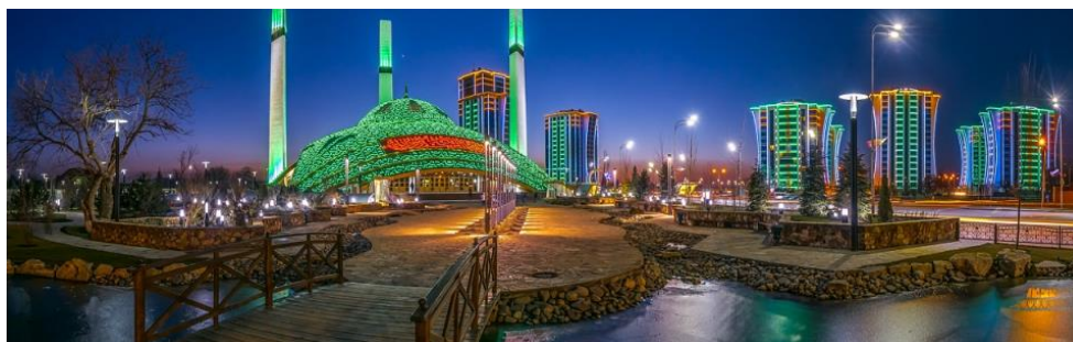
Obr. 11: Mešita Ajmani Kadyrové

Mešita se nachází v centru města Argun a byla otevřena 16. května 2014. Nese jméno Ajmani Kadyrové, matky prezidenta. Proto je nazývána srdcem matky. Moderní design mešity připomíná spíše kosmický aparát. Mešita má kapacitu 15 tisíc lidí a zaujímá rozlohu 25 tisíc metrů čtverečních. Samotná mešita má 6950 metrů čtverečních. Okolní park zaujímá 17 tisíc metrů čtverečních. Její 3 minarety dosahují výšky 55 metrů. Čtyřpatrová stavba je postavena ve stylu hi-tech a díky tomu je první moderní mešitou Ruska. První tři patra jsou určena pro muže a nejvyšší patro pro ženy. Její stěny jsou obloženy mramorem. Během dne a v závislosti na počasí se mění barevné odstíny mešity od světle šedé až po tyrkysově modrou. V noci je území mešity osvětleno různými lampami a reflektory (Путеводитель по Чеченской республике, 2017, 30).