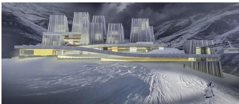
Obr. 21: Lyžařské středisko Veduči