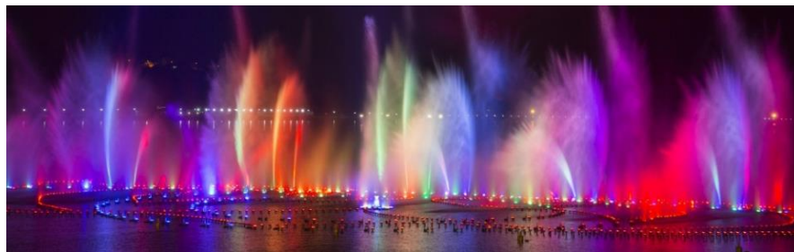
Obr. 20: Fontána v Grozném

Grozněnské moře je sportovně-rekreační komplex, který byl otevřen v dubnu 2017. Rozloha komplexu má 300 hektarů, z toho vodní nádrž zaujímá 119 hektarů (www.fb.ru (57)).