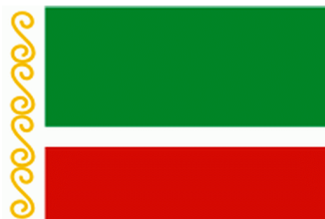
Obr. 6: Státní vlajka Čečenské republiky

Státní hymna byla přijata Parlamentem Čečenské republiky v roce 2010. Slova napsal prezident Kadyrov a hudbu složil Umar Beksultanov (www.chechnya.gov.ru (6)). Státní vlajka byla schválena Parlamentem Čečenské republiky v roce 2008. Jedná se o obdélník složený ze tří pruhů: zeleného, bílého a červeného s čečenským národním ornamentem (zlaté třásně) (www.chechnya.gov.ru (7)). Státní znak byl schválen Parlamentem v roce 2008. Tvoří ho kruh červené, žluté, modré a bílé barvy. Symbolizuje jednotu, věčnost a bohatství čečenského lidu (www.chechnya.gov.ru (8)).