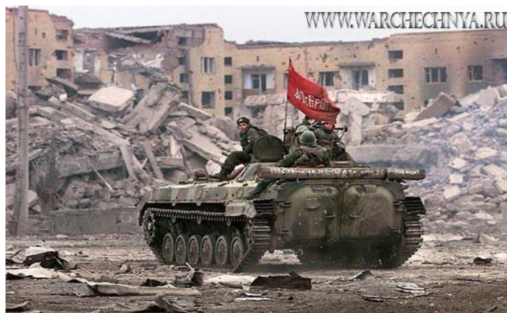
Obr. 5: Druhá čečenská válka

Ztráty na životech, stejně jako v první rusko-čečenské válce, nejsou oficiálně známy. Počty obětí podle ruských oficiálních pramenů jak za první i druhé války udávají výrazně vyšší počet padlých čečenských bojovníků než ruských. Počet obětí civilistů je opět podstatně vyšší. V době války přišlo o svůj domov přibližně 600 000 lidí a bylo zbořeno asi 280 000 domů (Souleimanov, 2011,205).