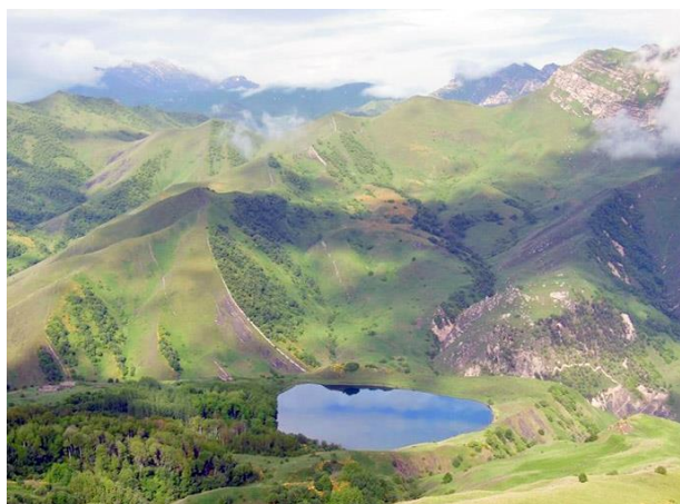
Obr. 8: jezero Galančož

zde několik kamenných věží a další historické památníky (www.chechnyatavel.com (29)).