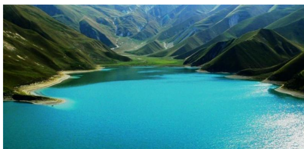
Obr. 9: jezero Kezenoj-Am

Jezero Kezenoj-Am je nazýváno perlou Kavkazu kvůli své neobyčejné kráse a náročné dostupnosti. Jezero leží na hranici s Dágestánem ve Vedenském okrese v nadmořské výšce 1847 m. n. m. Patří k nejdůležitějším památkám nejen Čečny, ale celého Kavkazu. Je zároveň největší a nejhlubší vysokohorské jezero na severním Kavkaze. Hloubka jezera dosahuje více než 70 metrů. Jezero má velmi čistou, průzračnou vodu a vyskytuje se v něm vzácný druh pstruhů. V okolí mohou turisté najít zříceninu starobylého hradiště Choj, či legendárního hradu Aldam-Gezi. Na břehu jezera je moderní sportovně-turistický komplex Kezenoj-Am. Stojí zde hotel, chatky, restaurace, sportovní komplex a další objekty (Путеводитель по Чеченской республике, 2017, 13).