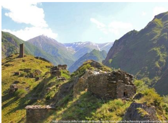
Obr. 14: Město mrtvých

Město mrtvých se nachází 40 km od města Itum-Kale. Toto místo navštěvují turisté, kteří se podrobněji zajímají o historii Čečenců. Je to největší středověký hřbitov na Kavkaze. V hrobkách turisté můžou vidět kostry lidských těl. Na tomto místě je 42 hrobek ze 46 objektů kulturního dědictví. Je nutno zmínit, že místo není snadno dostupné ( www.martinstverak.cz (34)).