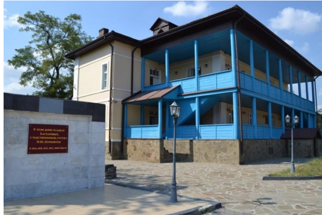
Obr. 17: Literární muzeum M. J. Lermontova