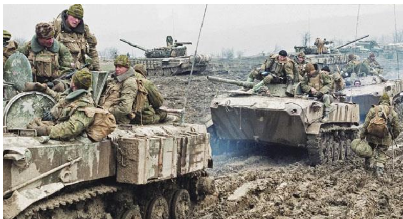
Obr. 4: Druhá čečenská válka