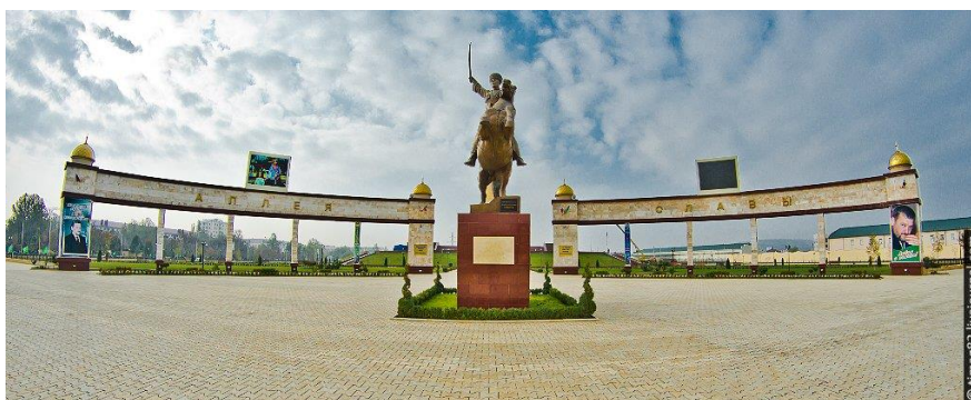
Obr. 15: Alej slávy

Budova má také podzemí. Ve spodním patře je vybudováno muzeum prvního prezidenta Čečenské republiky Achmata Chadži Kadyrova. Expozice muzea je věnována prezidentovu životu. Ve vrchním patře jsou umístěny portréty hrdinů Sovětského svazu, kteří pocházeli z Čečenské republiky, a také umělecká galerie. V komplexu stojí 40 metrová věž a hoří zde, jako v mnoha ruských městech, věčný oheň ( www.ru.esosedi.org (35)).