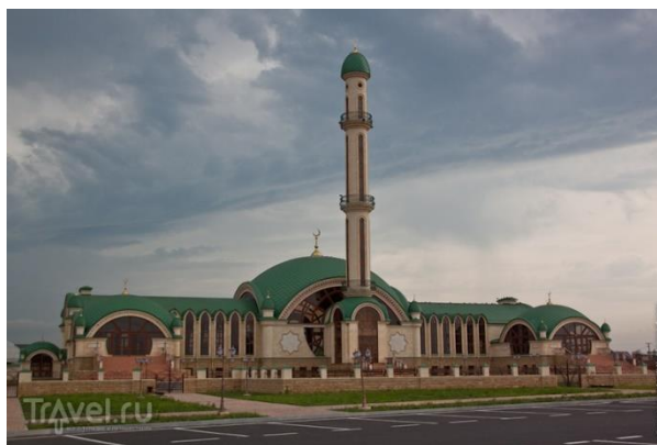
Obr. 12: Mešita v Alchan-Jurt