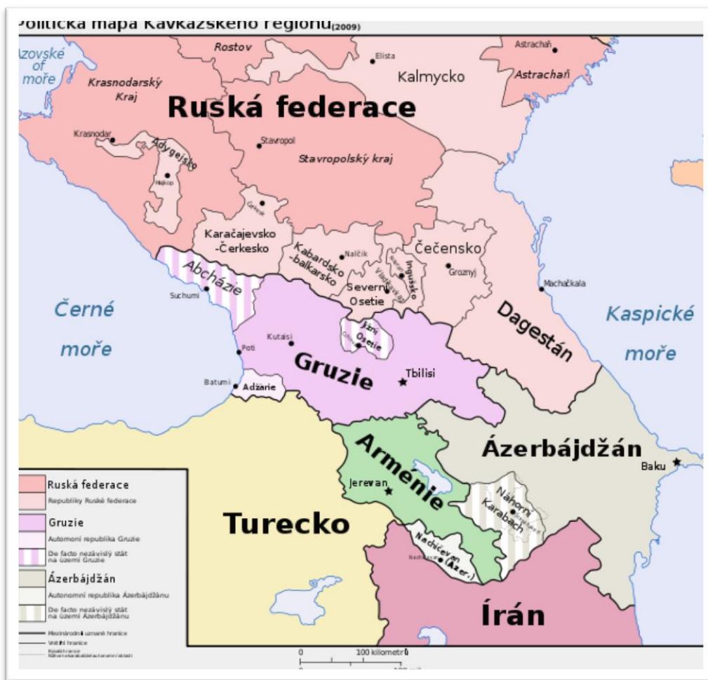
Obr. 2: Politická mapa Kavkazského regionu

polopoušti převažuje suché podnebí, kdežto sněhové vrcholky Bočního kavkazského hřbetu mají podnebí chladné a vlhké vzhledem k vysokým nadmořským výškám. Nadmořská výška různých oblastí ovlivňuje také průměrnou teplotu. Například v Grozném, který se nachází ve 126 metrech nadmořské výšky, je průměrná teplota 10,4 °C. Léta jsou dlouhá a teplá. Nejvyšší teploty jsou v Tersko-kumské nížině, a to průměrně 25 °C, (v některých dnech až 43 °C). Směrem na jih s rostoucí nadmořskou výškou teplota postupně klesá. Zimy v rovinách jsou mírné, ale nestabilní (www.mid.ru (2)).