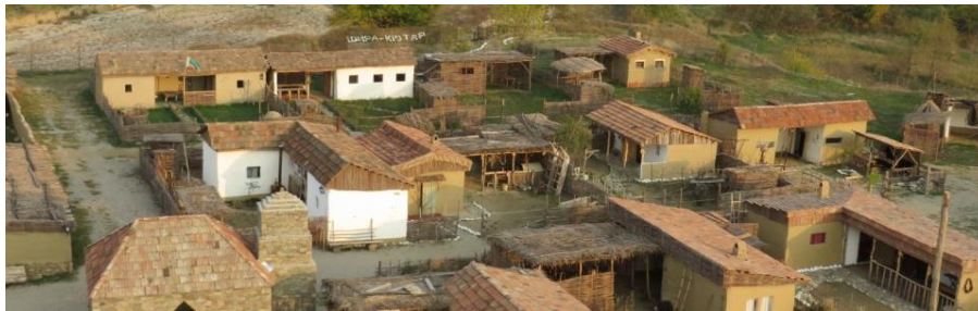
Obr. 18: Šira-Kotar

Šira-Kotar je stylizovaná starověká osada, která leží na okraji vesnice Germenčuk. V osadě můžou turisté navštívit 40 středověkých kavkazských domů, mešitu, mlýn, mnoho dalších starobylých budov, mohou si prohlédnout také předměty a nářadí. Hlavní budovou osady je kamenná protipožární věž o výšce 23 metrů, která je rovněž přístupná ( www.chechnyatrael.com (42)).