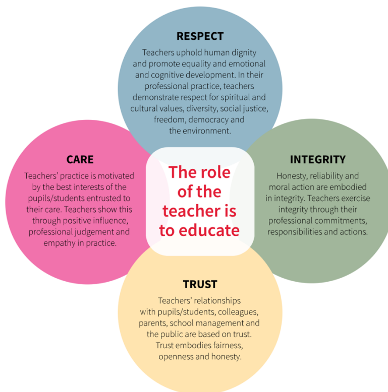
Obrázek č.4: Code of Professional Conduct