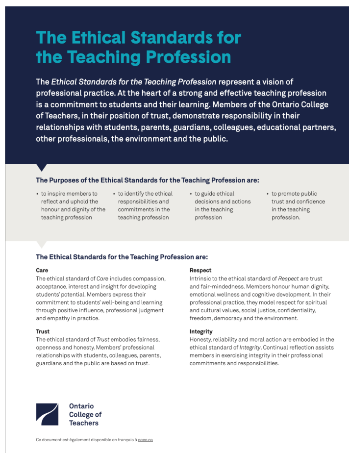
Obrázek č.2: The Ethical Standards for the Teaching

Standardy pro učitelskou profesi v Kanadě jsou důležitým dokumentem, který stanovuje etické normy pro učitelskou profesi. Dokument vypracovala Kanadská asociace pro vzdělávání učitelů (Canadian Association for Teacher Education, CATE) a byl publikován v roce 2018. Tento dokument je obsáhlý a najdeme v něm mnoho klíčových informací pro specifické sektory a důležité aktéry ve vzdělávacím procesu. To bylo také důvodem, proč Ontrarijská pedagogická akademie tento dokument upravila do přehlednější formy, která je vhodná pro denní použití a srozumitelná pro širokou veřejnost (The Ethical Standards for the Teaching). Akademie zde stanovila vizi profesní praxe a zdůrazňuje závazek vůči studentům a jejich vzdělávání. Členové této organizace na důvěryhodných pozicích prokazují svou odpovědnost ve vztazích se studenty, rodiči, kolegy, partnery ve vzdělávání, dalšími odborníky, okolím a veřejností. (CANADA, PEEL, 2018)