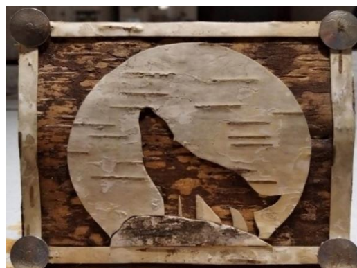
Obrázek 3. Obraz z březové kůry - vlk.