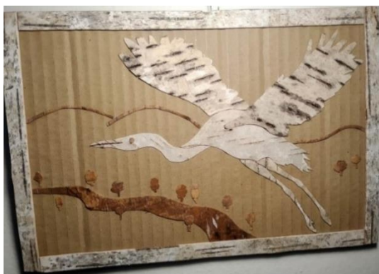
Obrázek 2. Obraz z březové kůry - čáp.