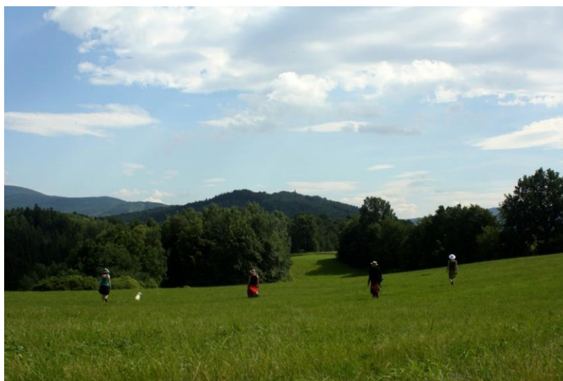
Obrázek 4. Živé obrazy

Zvážit používání fotoaparátu. Pomíjivost obrazu je velkým „herním“ prvkem programu. Aktivita je vhodná pro poznání okolí střediska i účastníků navzájem.