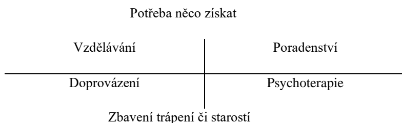
Obr. č.1: Ludewigův kříž

Staví tyto způsoby práce do kříže a stanovuje jejich směr. Jedním směrem klient potřebuje něco získat a druhým směrem se potřebuje zbavit trápení či starostí. Podle obrázku č. 1 je cílem vzdělávání a poradenství „ potřeba něco získat “, zatímco doprovázení či psychoterapie se blíží k pólu „ zbavení trápení či starostí “. U všech komponent se však jedná o pomáhající profese. Tento princip představuje tzv. Ludewigův kříž (Procházka et al., 2014):