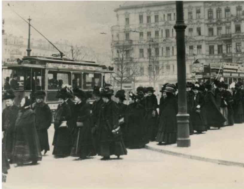
Obr. 1: Ženy demonstrující v Berlíně za volební právo 2

Na popud socialistů byl dne 19. března 1911 vyhlášen historicky první mezinárodní den žen. Tehdy jich více jak milion vyrazil pod heslem „Sem s volebním právem!“ do německých ulic. Za společný cíl demonstrovaly po celém světě. V roce 1921 bylo rozhodnuto, že mezinárodním dnem žen bude 8. březen.