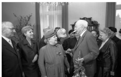
Obr. 8: Helene Weberová s tehdejším spolkovým prezidentem Theodorem Heusem 36

Za svoji činnosti v sociální oblasti a na politické scéně obdržela Helene Weberová několik ocenění. Již v roce 1930 získala čestný doktorát na univerzitě v Münsteru za zásluhy o vzdělávání žen a práci s mládeží. V roce 1956 obdržela Spolkový záslužný kříž, který je udělován za významné činy v oblasti politiky, hospodářství nebo veřejně prospěšné činnosti. 35