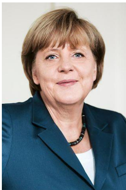
Obr. 15 Angela Merkelová 118