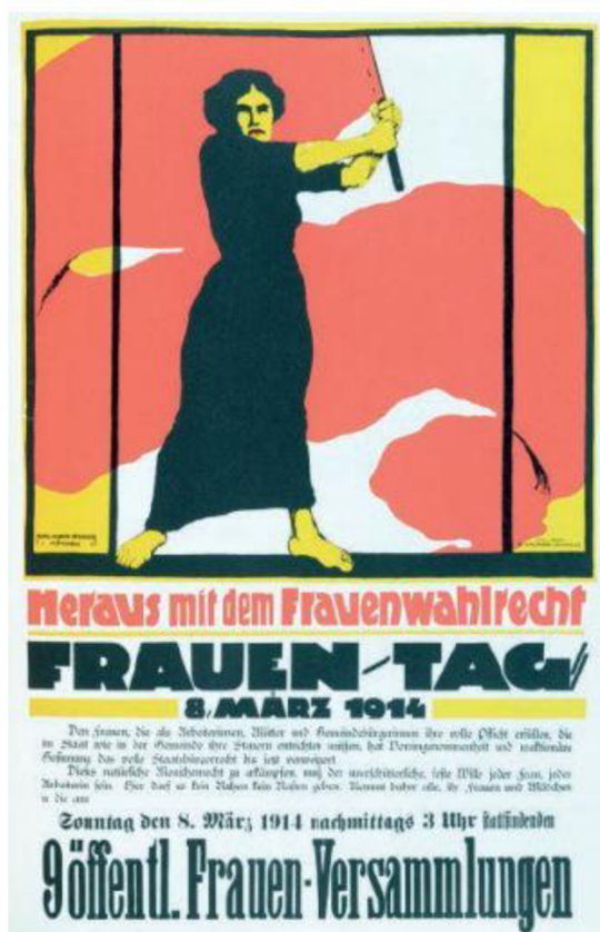
Obr. 2: Plakát k mezinárodnímu dni žen z roku 1924 4