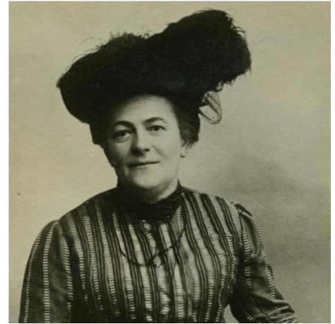
Obr. 5 Clara Zetkinová