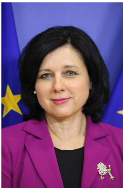
Obr. 14: Věra Jourová 95

Po odchodu Jeana-Clauda Junckera z vedení Evropské komise a nástupu dosavadní předsedkyně Ursuly von der Leyenové, se stala místopředsedkyní a věnuje se transparentnosti a hodnotám. 94