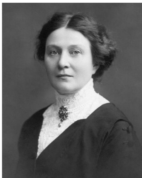
Obr. 11 Františka Ferdinanda Plamínková 62