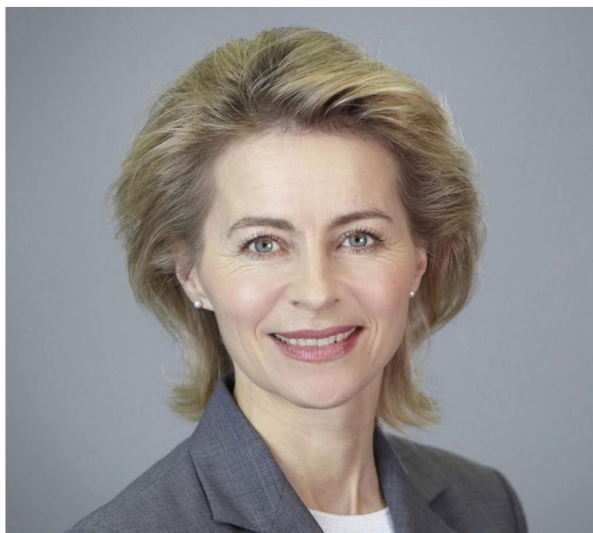
Obr. 16 Ursula von der Leyenová 120

V roce 2019 byla navržena Evropskou radou hlav států a premiéry do funkce předsedkyně Evropské komise. Svůj proslov pro zvolení zaměřila na myšlenku Evropy jako prvního klimaticky neutrálního kontinentu, k čemuž mělo dojít do roku 2050. Předsedkyní byla zvolena a do úřadu nastoupila v prosinci téhož roku. 119