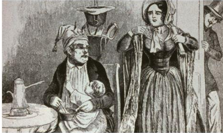
Obr. 3: Karikatura ženského hnutí ve Výmarské republice 30

Muži zkrátka pokládali ženskou účast v politice za zcela bezvýznamnou. Naopak vyzývaly ženy, aby se angažovaly v jiných oblastech, například kultuře nebo v sociální či ekonomické oblasti. 29