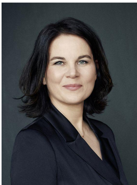
Obr. 17 Annalena Baerbocková 123

V roce 2021 vydala svoji knihu Jetzt. Wir müssen unser Land erneuern , ve které představila své plány, co by příští kancléřka. Záhy po jejím zveřejnění byla Baerbocková nařčena z plagiátorství, protože ve své knize špatně citovala a její fráze se až příliš shodují s frázemi jiných. Zpočátku nařčení z plagiátorství striktně odmítala a obhajovala se skutečností, že vycházela z veřejných zdrojů. Později druhé vydání knihy doplnila o zdroje. 122