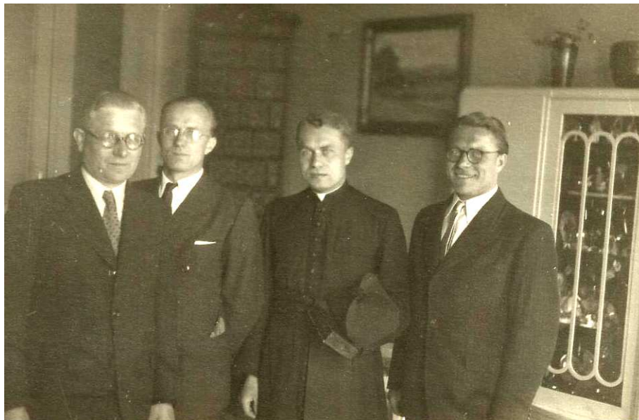
Příloha č. 4 – Fotografie Antonína Huvara s rodákem ze Studénky kardinálem Tomáškem