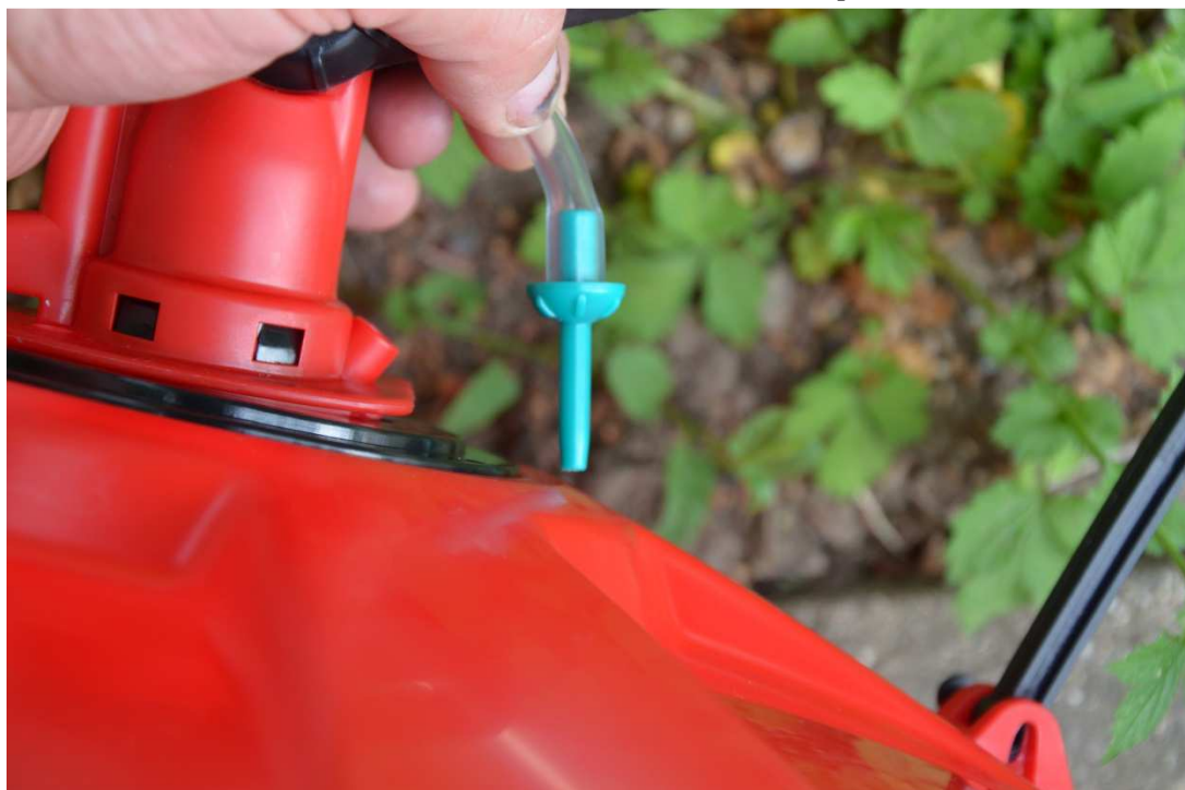
Obr. 8 Detail dávkovací jehly (zelená) před upevněním do hlavice aplikátoru