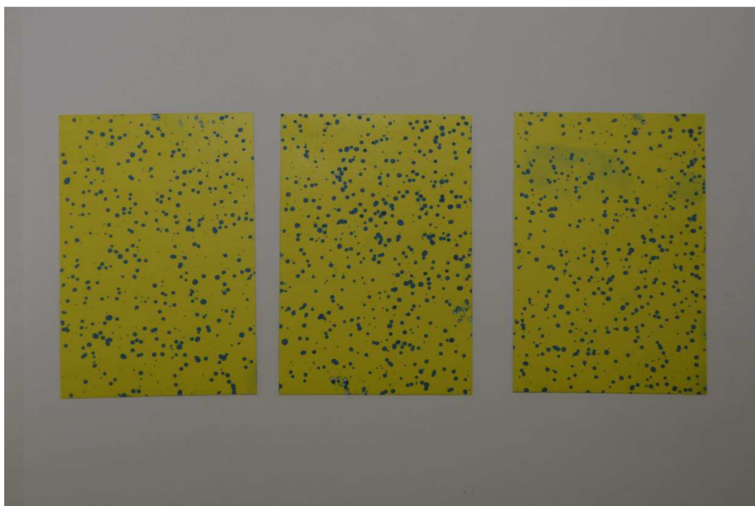
Obr. 10 Foto WSP s nástřikem kapek z aplikátoru (oranžová jehla)