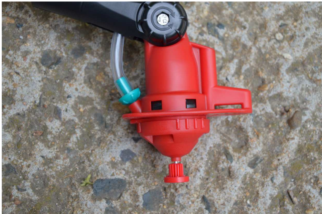
Obr. 7 Detail rotačního disku s elektromotorkem v hlavici aplikátoru