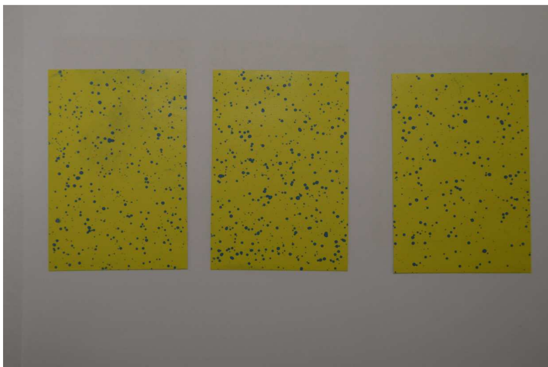
Obr. 11 Foto WSP s nástřikem kapek z aplikátoru (zelená jehla)