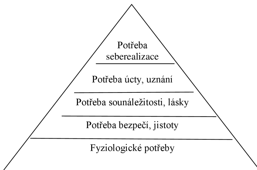
Obrázek 1 - Maslowa pyramida hierarchie potřeb 72

Pro pochopení netolismu je důležité uvědomit si, které potřeby dítě hraním her nebo užíváním internetu může uspokojovat. Východiskem k tomu může být pyramida hierarchie lidských potřeb amerického psychologa Abrahama Maslowa. 71