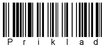
Obrázek 2.4: Kód typu Code 128.

Kód typu Code 128 přináší jednu zásadní změnu – může již přenášet číslice i znaky. Je pravděpodobně nejpoužívanějším typem 1D kódu používaného pro přenos znaků. Počet přenášených znaků není pevně určen. Dostupných popisů kódu je opět značné množství. Kvalitní popisy jsou například v [4] a [11]. Příklad kódu typu Code 128 je na obrázku 2.4.