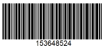
Obrázek 2.3: Kód typu Code 25.

Kód může uchovat pouze číslice (znaky 0–9), zato ale nemá pevně určenou šířku. V tomto kódu nesou informaci pouze černé čáry. Jednotlivé čáry jsou od sebe vždy odděleny mezerou šířky 1 modul. Čáry se mohou vyskytovat pouze 2 šířek. Úzká šířky 1 modul a široká šířky 3 moduly. Příklad kódu typu Code 25 je na obrázku 2.3.