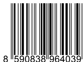
Obrázek 2.1: 1D čárový kód, typ EAN-13.

Dnes běžně používané čárové kódy můžeme rozdělit do 2 hlavních skupin. První skupinou jsou 1D čárové kódy , kde je čárový kód tvořen řadou svislých černých čar a mezerami mezi nimi. Ukázka typického 1D čárového kódu je na obrázku 2.1, kde se jedná o typ EAN-13. Takový kód se pak čte pouze podél jedné osy (odtud 1D, jednorozměrný).