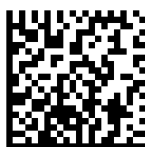
Obrázek 2.6: Kód typu Data Matrix.

Data Matrix je formálně definován v normě ISO 16022. Kód je patentován, ale patentová práva nejsou vykonávána. Patří do kategorie maticových kódů. Sám kód má čtvercový nebo obdélníkový tvar. Vnitřní moduly mohou být čtvercového nebo kulatého tvaru [8]. Příklad kódu typu Data Matrix je na obrázku 2.6.