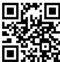
Obrázek 2.2: 2D čárový kód, typ QR Code.

Druhou skupinou jsou 2D čárové kódy , kde je čárový kód tvořen maticí černých a bílých bodů. Čtení pak musí probíhat v ploše. Příklad 2D kódu typu QR Code je na obrázku 2.2. 2D kódy obvykle mohou uchovat větší objem informace. Existují i jiné druhy čárových kódů, například kruhové. Takové kódy se však používají pouze ve specifických oblastech a tato práce se jim nevěnuje.