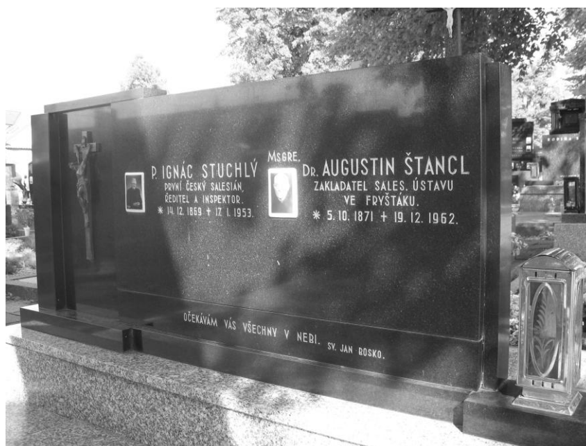
Náhrobek Mons. Augustina Štancla (a P. Ignáce Stuchlého – prvního českého salesiána) na fryštáckém hřbitově. U Mons. Štancla je uvedeno chybné datum úmrtí (19. 12.), správně má být 21. 12. (foto autor, 2009)