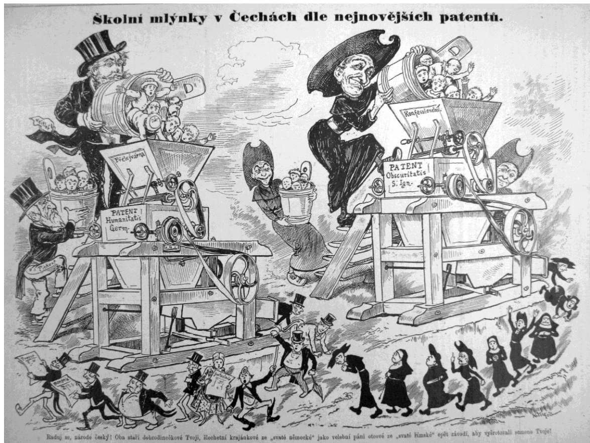
„Školní mlýnky v Čechách dle nejnovějších patentů.“ Karikatura v časopisu Šípy poukazující na pokusy germanizovat české školství a obnovit v něm vliv církve. ( Šípy , roč. 1, č. 6, 1888).