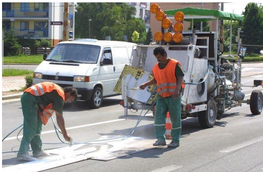
Obr. 11. Ruční nástřik vodorovného značení do formy [8]

Nejčastěji se tohoto způsobu využívá u nástřiku přechodů pro chodce nebo u tvarově složitějších obrazců např. šipky. Na realizaci je potřeba forma, do které se nástříká barvou požadovaný tvar a to z důvodu dodržení přesného rozměru dle normy. Nástřik se provádí kompresorem, z něhož vede hadice s již naředěnou barvou do vzduchové pistole.