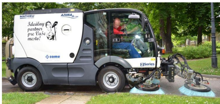
Obr. 22. Zametací vůz v parku [21]