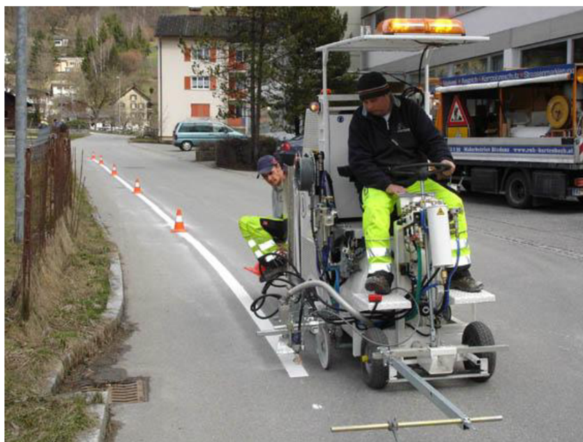
Obr. 13. Samohybný stroj Hofmann H11-1 [10]

Tato kategorie je velice rozsáhlá, od malých pojezdových vozů (obr. 13) až po velké nákladní automobily (obr. 14). Tomu odpovídá i jejich využití. Například na dálnicích a dlouhých úsecích se využívá velkých strojů z důvodu objemnějšího zásobníku na barvu. Obsluha vede vůz po předem vyznačené trase na vozovce. K tomuto účelu je před vozem upevněné tzv. “tykadlo”, které řidič musí mít vizuálně v ose s předznačenou trasou. Základ tvoří dieselový nebo spalovací motor, kompresor, nádrž s barvou, rozvodné potrubí a tryska popřípadě sestava trysek (obr. 15).