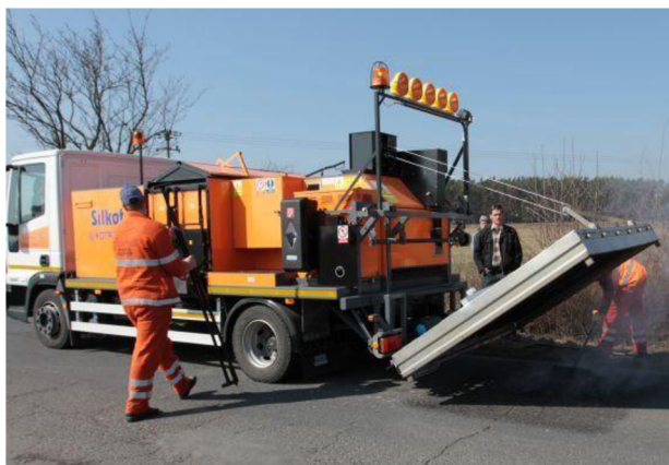
Obr. 35. Stroj SILTEK 10 [27]

Jelikož stroj využívá LPG, elektřinu a recykláž, jsou velice nízké náklady a rychlá oprava. Stroj se zaškolenou tříčlennou posádkou je schopný opravit 90- 100 m 2 za směnu. Opravené místo vydrží minimálně 3 roky včetně studených zimních období, Stroj lze využívat i v zimě. [27]