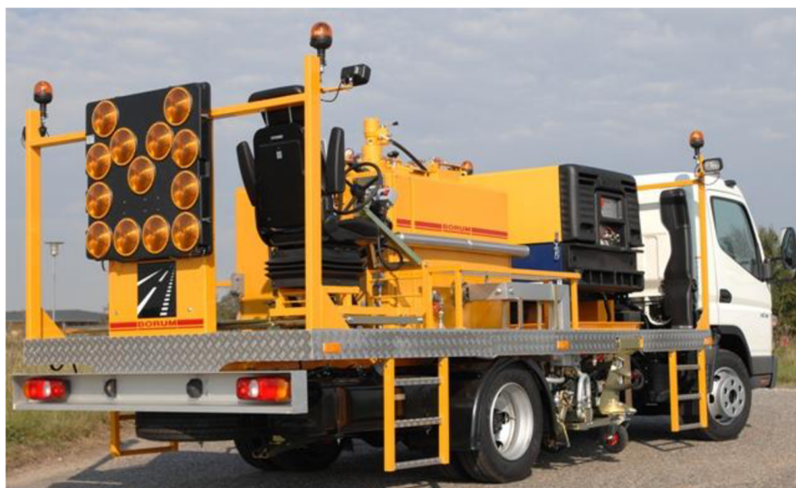
Obr. 14. Nákladní vůz se stříkací nástavbou [11]