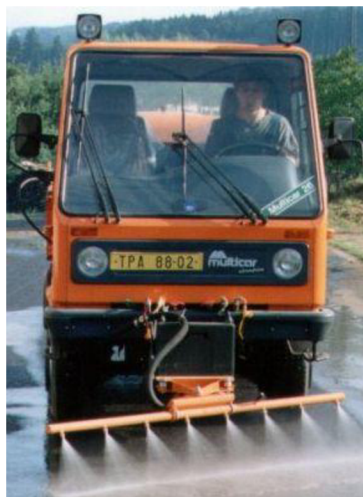
Obr. 18. Pevná mycí lišta poháněná čerpadlem na automobilu [19]