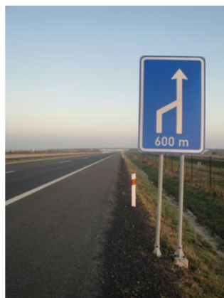
Obr. 3. Stálá svislá značka umístěna vedle vozovky [15]

Stálé značky jsou připevněny na konstrukci, která je pevně ukotvena v zemi. Může být umístěna na samostatném sloupku vedle vozovky (obr. 3.), na konstrukci vedoucí nad vozovkou (obr. 4.) nebo na sloupu veřejného osvětlení. V prvních dvou případech je nosná část připevněna šrouby k betonové podestě.