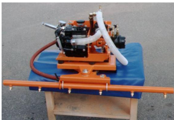
Obr. 19. Pevná mycí lišta poháněná samostatnou jednotkou [19]

Tento typ je poháněn hydraulickým čerpadlem uloženým na bloku mycí lišty, které se připojí k hydraulickému systému automobilu.