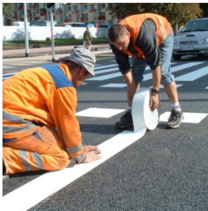
Obr. 10. Lepení vodorovného dopravního značení [6]

Tento způsob se využívá zejména při přechodném značení, ale lze jej využít i na méně frekventovaných komunikacích. Aplikace je velmi jednoduchá- stačí strhnout ochrannou fólii a nalepit na vozovku. Pro lepší přilnavost se využívá speciálního lepidla. Odstranění fólie se jednoduše provede jejím strhnutím.