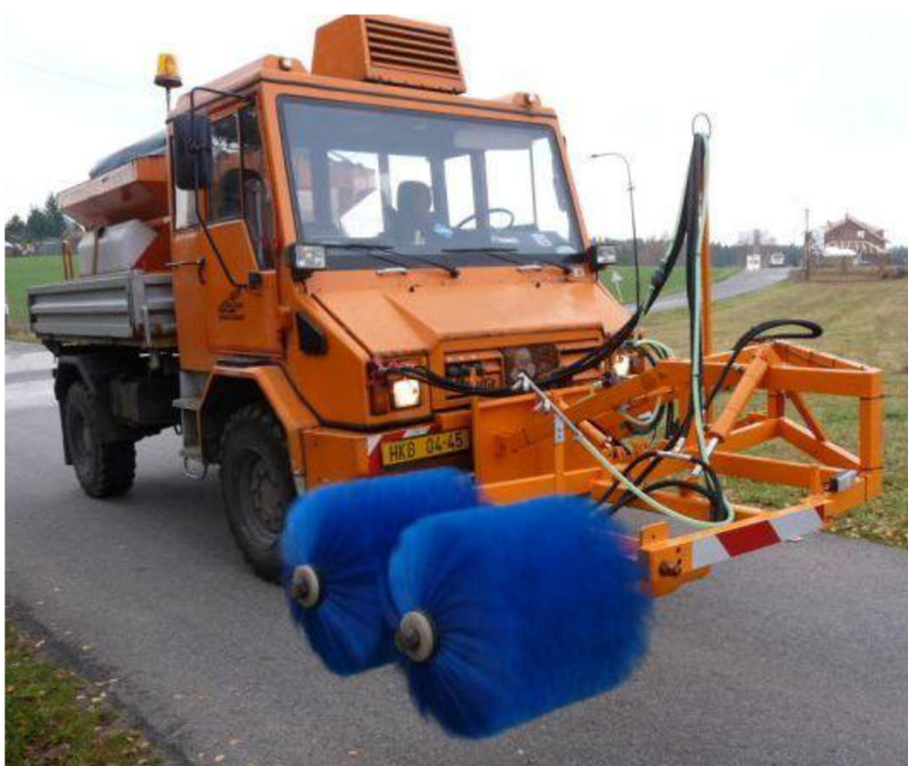
Obr. 7. Myčka sloupků umístěná na voze Mercedes Benz UNIMOG [5]