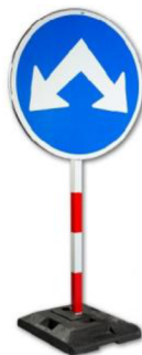
Obr. 1. Přenosná svislá značka upevněná v podstavci [13]

Jedná se o značku umístěnou na červenobílém pruhovaném stojanu, který je upevněn v přenosném podstavci z recyklovaného materiálu (obr. 1.). Značky mohou být také upevňovány na vozidla (obr. 2.). Přenosné značky jsou nadřazené ostatním značkám.