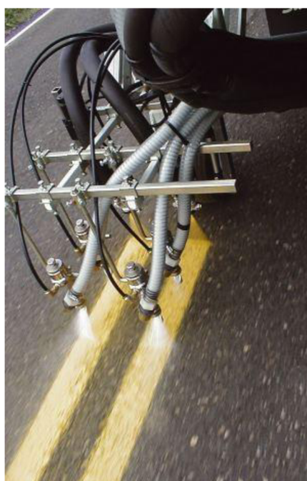
Obr. 15. Sestava 6-ti trysek [12]