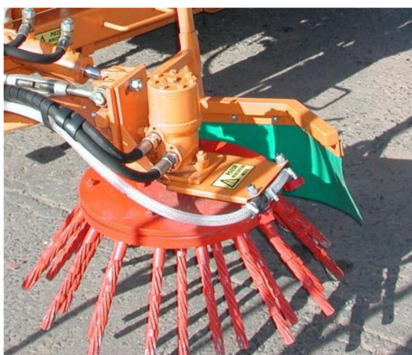
Obr. 32. Agresivní ocelový kartáč

Tento kartáč slouží jako pomocný k válcovému kartáči. Podává nečistoty do dráhy pohybu válcovému. Jeho hlavní výhodou je lepší odklizení nečistot z krajnic a od patníků. Materiály- plast nebo ocel.