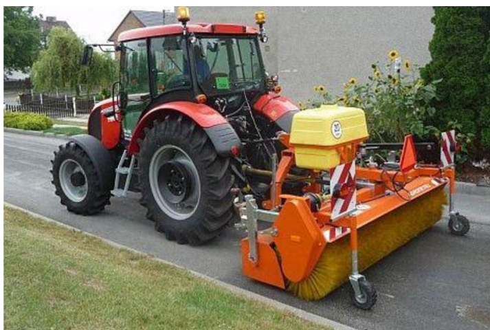
Obr. 29. Upevnění zametače do zadního tříbodového závěsu traktoru [18]

Pohon je opět zajištěn vývodovým hřídelem traktoru.