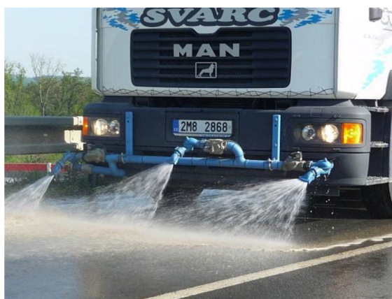
Obr. 17. Kropíčí vůz s připevněným potrubím na rámu automobilu [18]

Rozvod vody je veden z nádrže přes čerpadlo do rozvodového potrubí. Tento typ kropíčního vozu slouží ke smytí hrubých nečistot z vozovky ale není tak účinný jako ostatní typy, protože trysky jsou umístěny výše nad vozovkou a mají širší záběr. Obsluha vozu může z kabiny regulovat pouze průtok vody, nikoliv směr natočení trysek, to provede manuálně. Tyto vozy se používají pro omytí vozovky např. po stavebních pracích na vozovce.