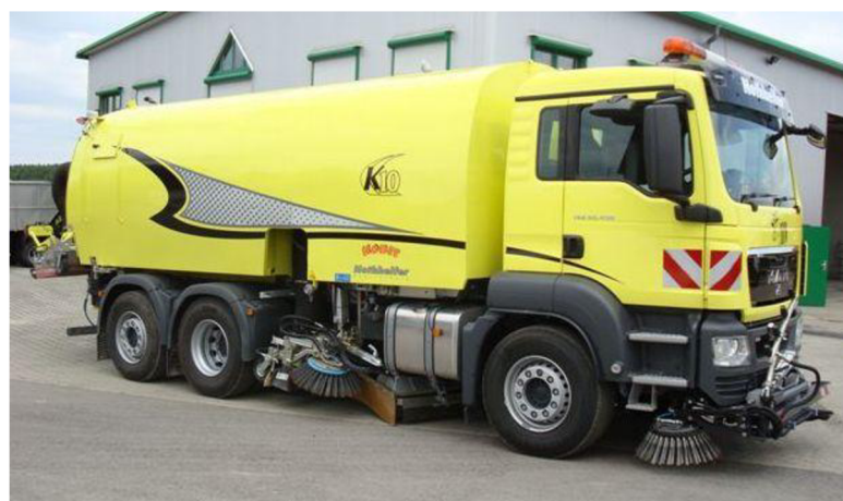
Obr. 23. Velký zametací vůz [22]