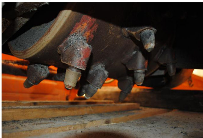
Obr. 36. Detail frézovacích trnů

Jedná se o zařízení, které pomocí frézovacího válce vyfrézuje okolí výtluky. Tento stroj je určen pouze na lokální opravy, nikoliv na vyfrézování celých vozovek. Na frézovacím válci jsou uloženy trny (obr. 36) a celý válec je poháněn hydraulickým motorem napojeným na traktor nebo nákladní automobil. Samotná fréza je uložena na pojezdové konzole, díky které nemusí obsluha přejíždět kvůli každé výtluce celým traktorem popř. automobilem. Posuv konzoly je opět zajištěn hydraulicky.