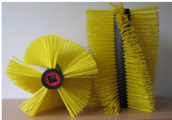
Obr. 31. Plastový válcový kartáč [25]

Plní hlavní činnost při odklizení nečistot. Vyrábí se v několika délkových provedeních v závislosti na šířce záběru samotného zametače. Materiály- plast, ocel, popřípadě kombinace obou.