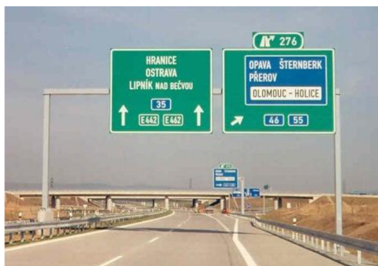
Obr. 4. Stálá svislá značka umístěna nad vozovkou [16]