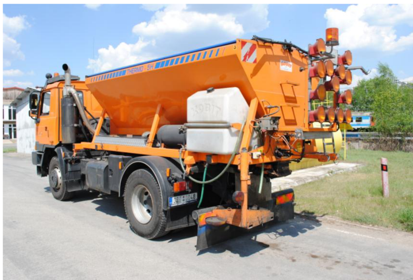
Obr. 34. Vysprávkový vůz převozní

Jedná se o vůz podobné konstrukce jako předcházející s tím rozdílem, že slouží pouze jako přepravní vůz již hotové směsi. Vykládka směsi probíhá opět šnekovým dopravníkem a lze ji sypat přímo do výtluky nebo do koleček a obsluha si ji doveze sama, kam potřebuje. Tuto nástavbu lze využít i v zimním období jako posypový vůz.