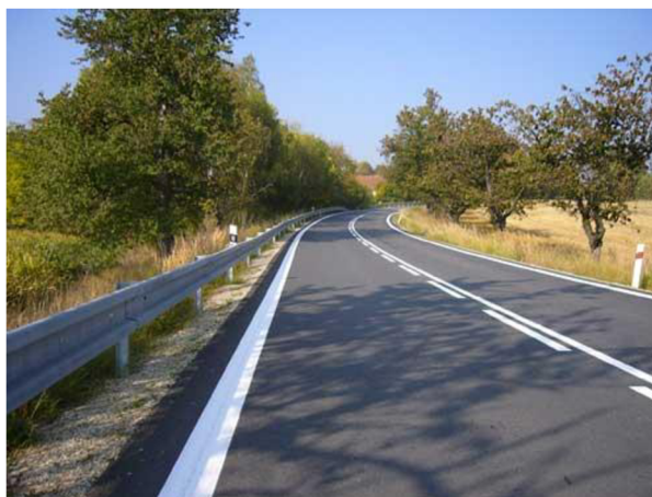
Obr. 8. Stálé vodorovné dopravní značení [18]

Na materiály jsou kladeny požadavky jako drsnost, různé světelné vlastnosti a životnost. Materiály jsou přesně stanoveny normou.