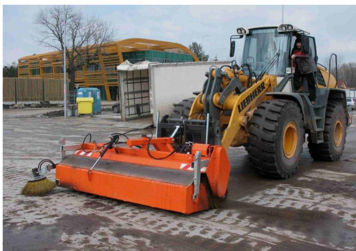
Obr. 30. Uložení zametače na rameni nakladače [25]

U tohoto typu je pohon kartáče realizován pomocí hydraulického motoru.