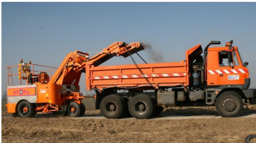
Obr. 27. Zametací vůz vlečený [24]