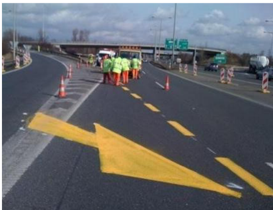
Obr. 9. Přechodné vodorovné dopravní značení [7]