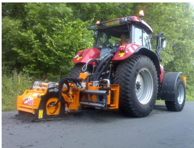
Obr. 37. Mobilní fréza PL 6020 firmy MTM TECH [23]