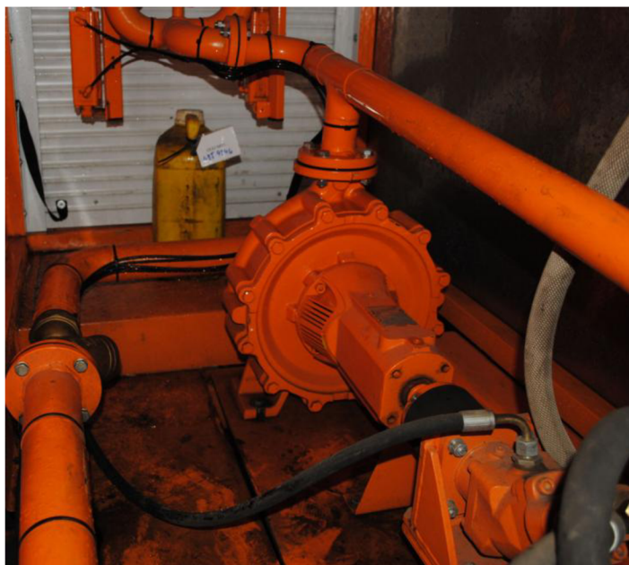
Obr. 16. Litinové spirální jednostupňové kozlíkové čerpadlo Sterling

O rozvod vody se stará odstředivé čerpadlo (obr. 16), které může být poháněno hydraulicky od pracovního okruhu hydrauliky vozu nebo mechanicky a to kardanovým hřídelem vyvedeným z převodovky vozu. Naplnění vody do nádrže se provádí napuštěním vody do horního otvoru na nádrži, připojením hadice k přetlakovému potrubí např. hydrantu nebo užitím vlastního čerpadla vozu, které nasaje vodu např. z vodní nádrže. Pracovní v vozu se pohybuje v rozmezí od 6-10 km.h -1 .