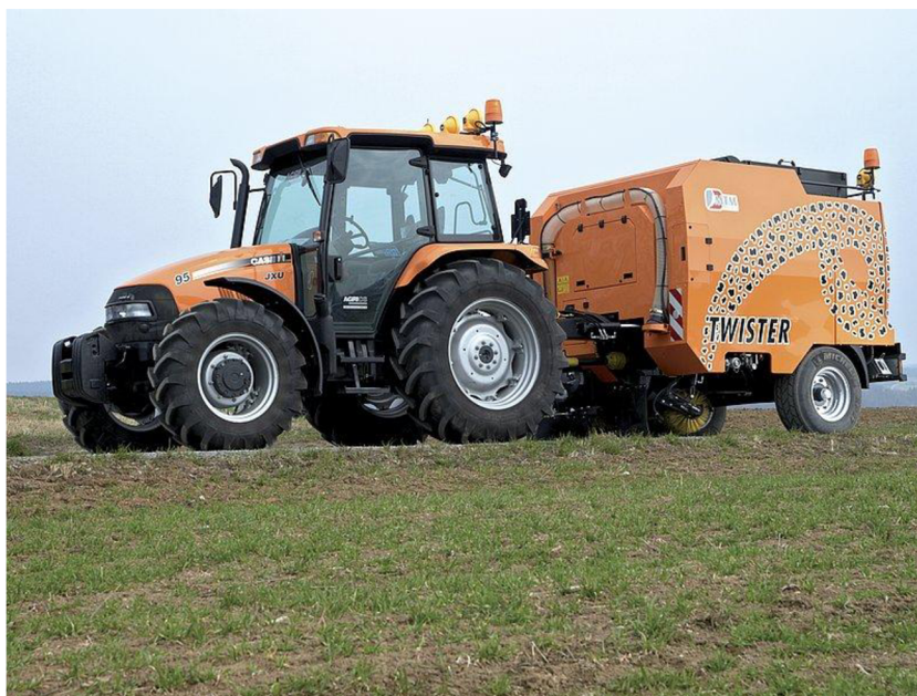
Obr. 26. Samosběrný vůz vlečený [23]

Dle názvů lze odvodit, že se jedná o vůz, který hromadí nasbírané nečistoty ve vlastní nádrži. Pohon je zajištěn zadním vývodovým hřídelem traktoru.