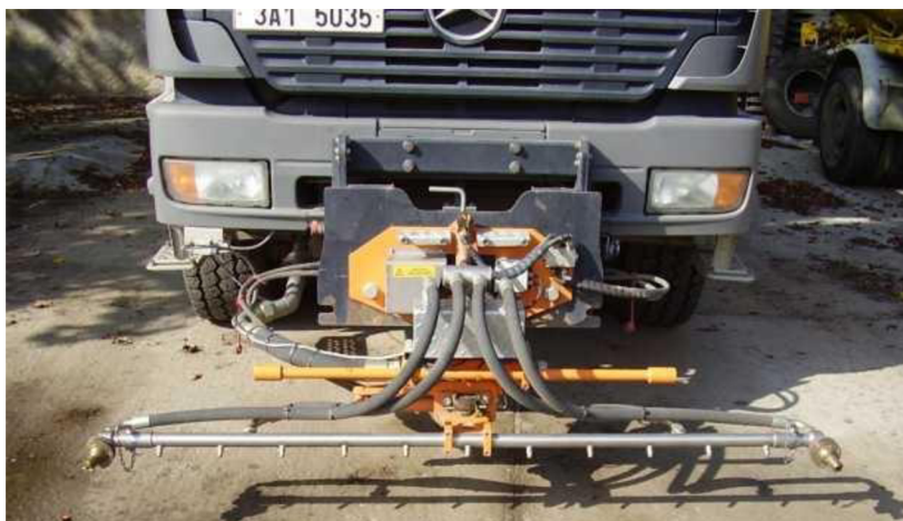
Obr. 21. Mycí lišta s proměnným natočením lišty MLS 3,4 [3]

U této lišty je možnost měnit plnicí tlak i natočení trysek přímo z kabiny obsluhy. Je to výhodné například při čištění komunikací, kdy obsluha natočí trysky a sníží tlak při průjezdu kolem stojících automobilů, aby nedošlo k jejich poškození.