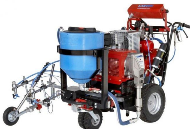
Obr. 12. Ruční vozík na nástřik vodorovného značení [9]

Jedná se o způsob, který se využívá u menších ploch např. parkovišť. Obsluha vede vozík po naznačené trase a může regulovat směr i množství nanášené barvy. Konstrukce vozíku je jednoduchá a základními částmi jsou spalovací motor, kompresor a zásobník na barvu. Vybavenější stroje jsou opatřeny i motorizovaným posuvem a řídicí jednotkou, což přispívá k úspoře materiálu a rovnoměrnějšímu nanesení barvy.