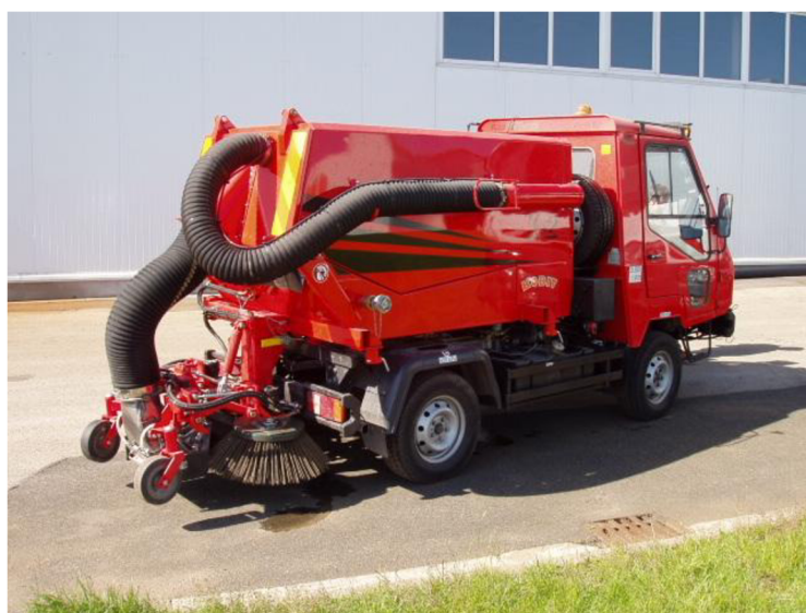
Obr. 24. Vůz se sběrným potrubím na zádi [20]