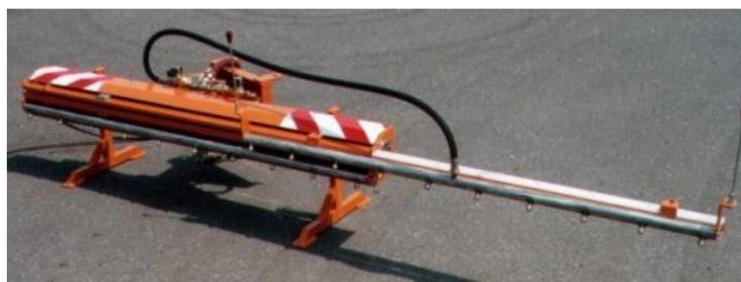
Obr. 20. Rozkládací mycí lišta [19]

U tohoto typu lze modifikovat šířku záběru lišty ale nelze upravit náklon trysek. Pohon je realizován čerpadlem na automobilu. Lišta je složena ze dvou výsuvných ramen, na kterých jsou umístěny trysky.