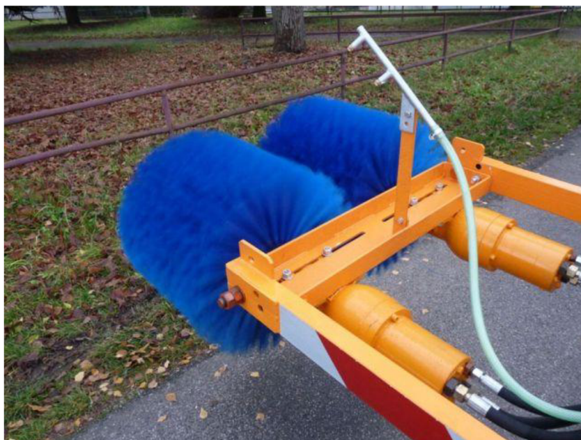
Obr. 6. Kartáče napojeny na hydraulický oběh vozu [5]