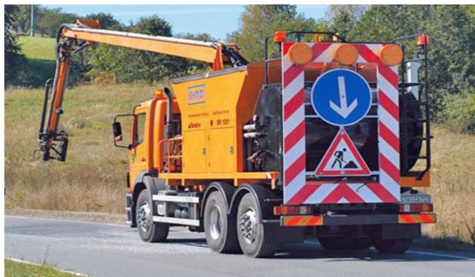
Obr. 2. Přenosná svislá značka připevněná na vozidle [14]