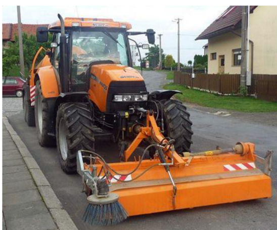
Obr. 28. Upevnění zametače do čelního třibodového závěsu traktoru [18]

Pohon je zajištěn vývodovým hřídelem traktoru.