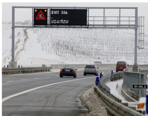
Obr. 5. Proměnná svislá značka umístěná nad vozovkou [17]

Proměnné svislé značky jsou zobrazovány na digitálním panelu umístěném většinou nad vozovkou (obr. 5.) a upevnění je obdobné jako u stálé svislé značky. Zobrazují se na nich aktuální dopravní informace, informace o počasí a proměnné značky (musí být ve stejných barvách jako stálé svislé značky). V naší republice se s těmito značkami setkáme pouze na dálnicích.