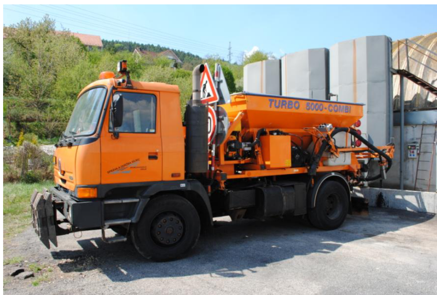
Obr. 33. Vysprávkový vůz se sypacím ramenem

Tato návavba má svoji vlastní pohonnou jednotku z důvodu potřeby vysokého tlaku vzduchu. Kontejner je naplněn ohřátým kamenivem a v postranních nádobách je zásoba emulze. Kamenivo je dopravováno k zadní výusti šnekovým dopravníkem, kde dojde k urychlení proudem vzduchu ze vzduchového kompresoru a dále pokračuje do výpustní trubice, kde se smísí s emulzí. Obsluha vozu se stará o zasypání děr a může regulovat poměr kameniva s emulzí.