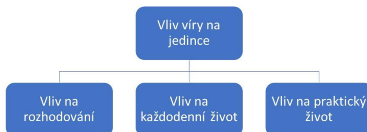
Obrázek 3

Tato kategorie ukazuje vliv víry na informanty v rozhodování, ovlivňování každodenního běžného života, který žijí právě v ten okamžik, a také praktického života, kdy si plánují své budoucí jednání a směřování. Ukázalo se, že se tyto tři kategorie vzájemně ovlivňují.