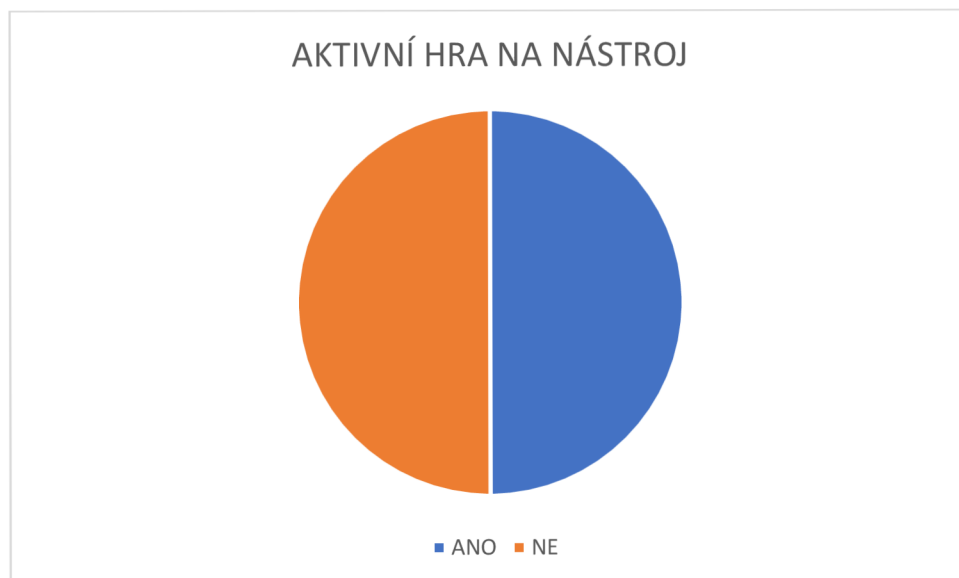
Graf č. 2 – Aktivní hra na nástroj.

Na druhou otázku odpověděly pouze respondentky, které u předchozí otázky zvolily odpověď ano. Zde se ukázalo, že třináct respondentek se věnovaly hře na nástroj aktivně a třináct ne.