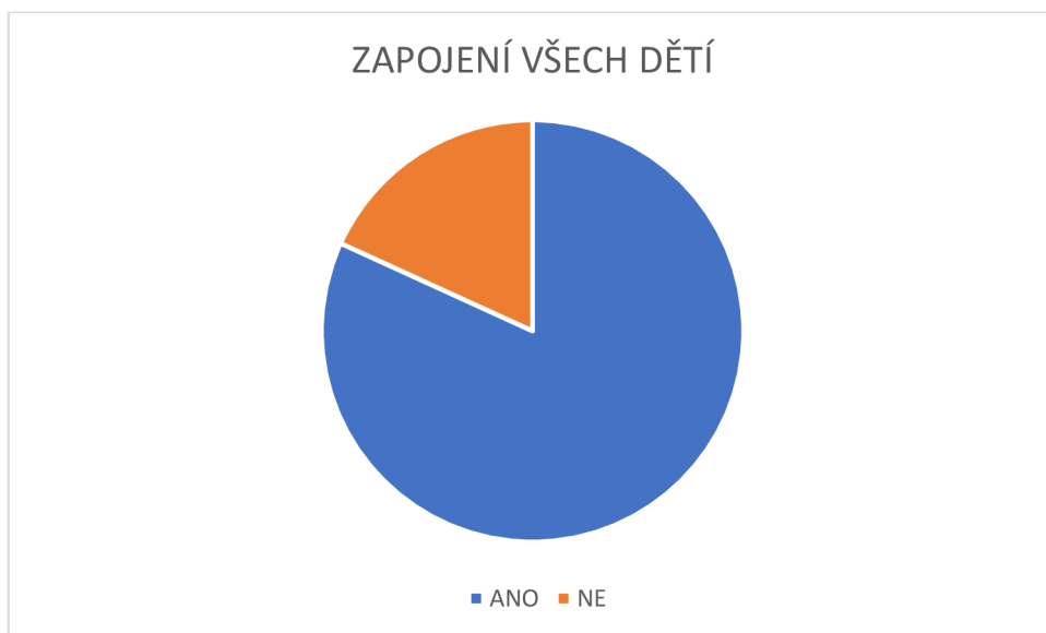
Graf č. 4 – Zapojení všech dětí.

U této otázky odpovědělo 41 respondentek, že zapojují do her na rytmické hudební nástroje všechny děti, a 10 odpovědělo, že ne, a to především, když se nějaké dítě hry účastnit nechce. Nechtějí nikoho nutit, tak nechají dítě, aby nejprve sledovalo hru a pak se případně přidalo.