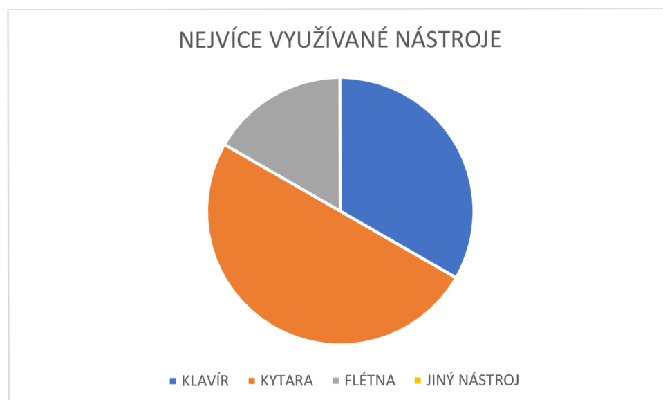
Graf č. 3 – Nejvíce využívané nástroje.