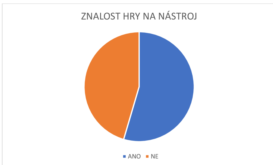
Graf č. 1 – Znalost hry na nástroj.

Respondenti u první otázky uvedli, že 26 respondentek z 51 hraje na hudební nástroj. Jedna respondentka odpověděla, že umí hrát na kytaru, flétnu a bicí, 25 paní učitelek uvedlo, že umí hrát na flétnu a tři, že ovládají hru na klavír. 54 % respondentek tedy umí hrát na hudební nástroj.