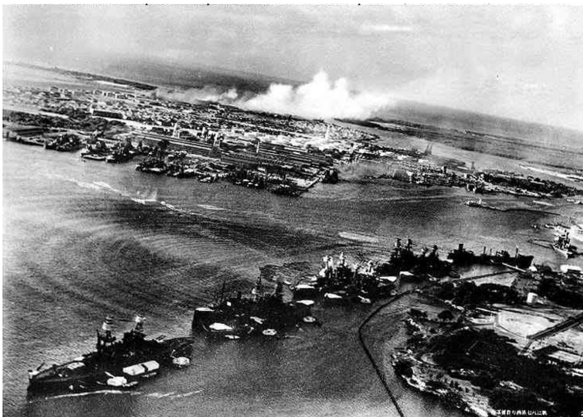
Obrázek 3: Japonský torpédový útok