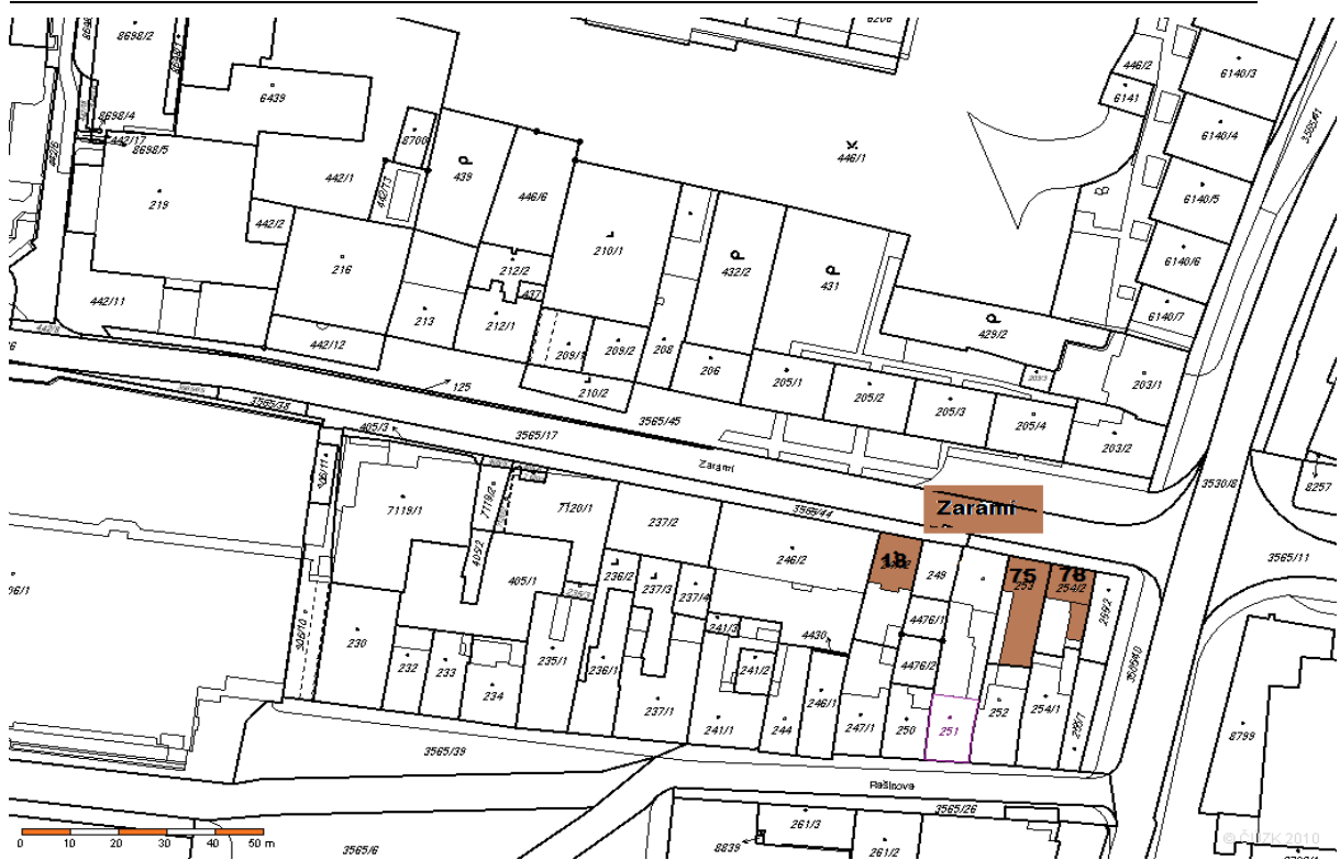
Obr. 17. Snímek katastrální mapy – ulice Zarámí