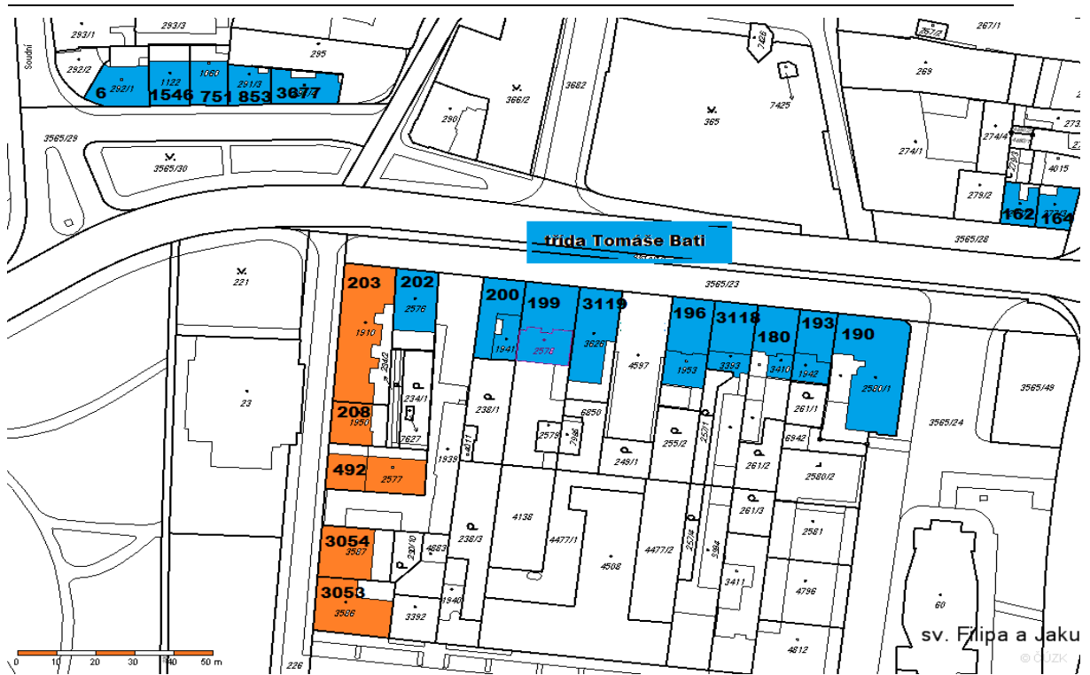
Obr. 19. Snímek katastrální mapy – trída T. Bati a ulice Školní