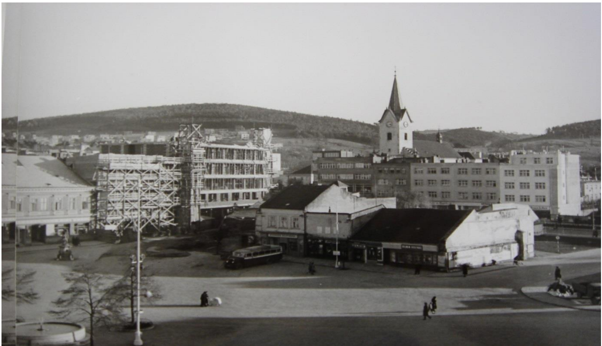
Obr. 5. Jihovýchodní část náměstí Míru s rozestavěným Trantírkovým domem, 1940