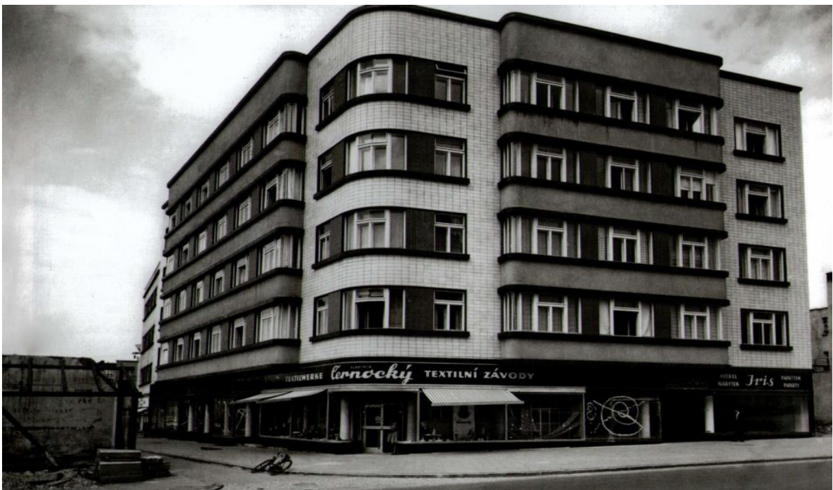
Obr. 6. Trantírkův dům na rohu náměstí Míru a třídy Tomáše Bati, 1941