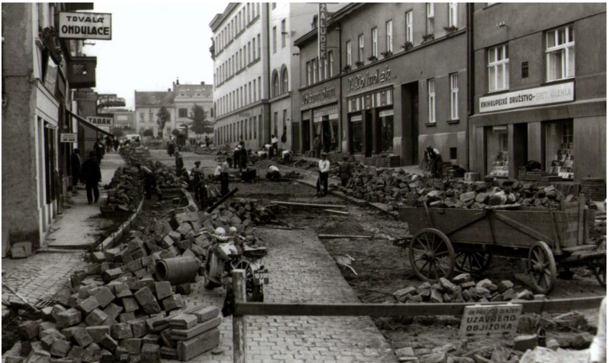
Obr. 11. Úprava vozovky v Bartošově ulici, 1934