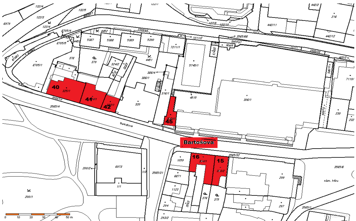
Obr. 16. Snímek katastrální mapy – Bartošova ulice