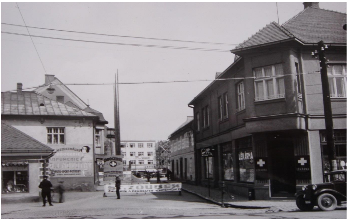
Obr. 12. Školní ulice, 1932