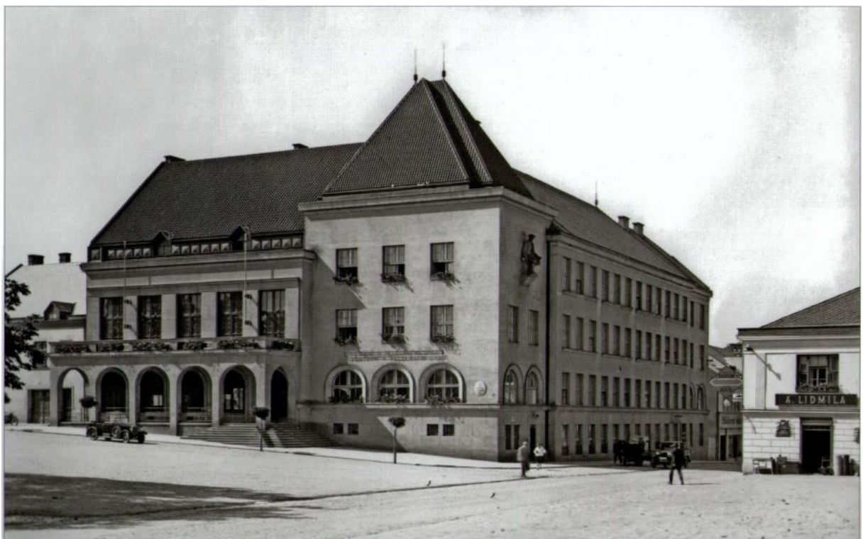
Obr. 2. Pohled k radnici a do Bartošovy ulice, 1931