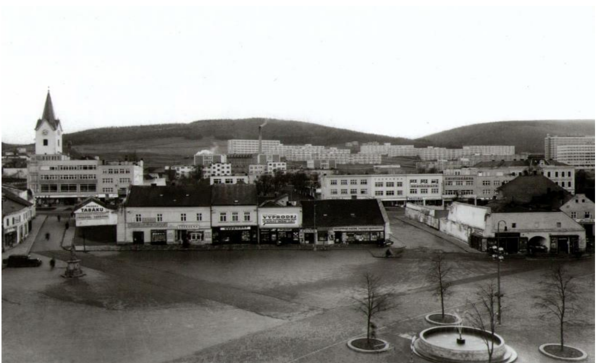
Obr. 1. Celkový pohled na jižní stranu náměstí Míru, 1937