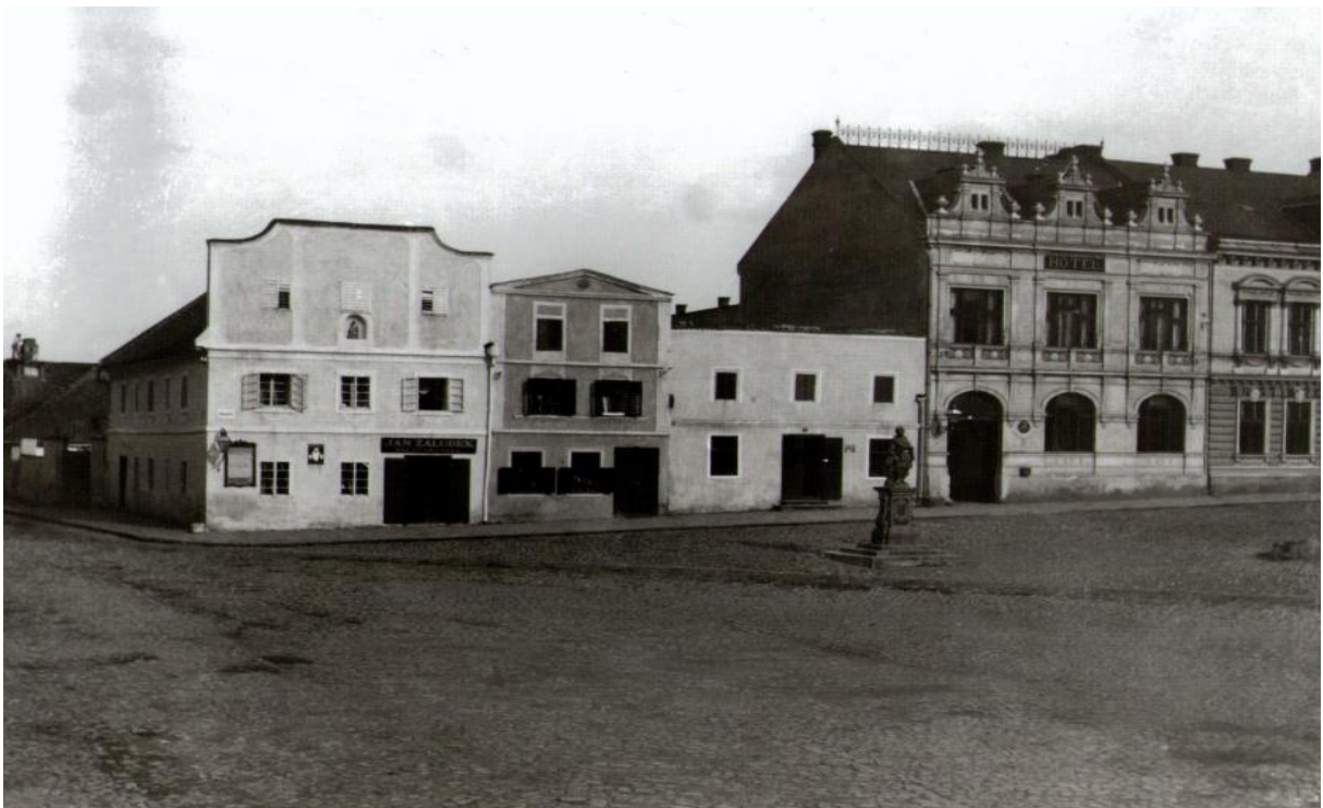
Obr. 4. Východní strana náměstí s novostavbou Záložny, 1900