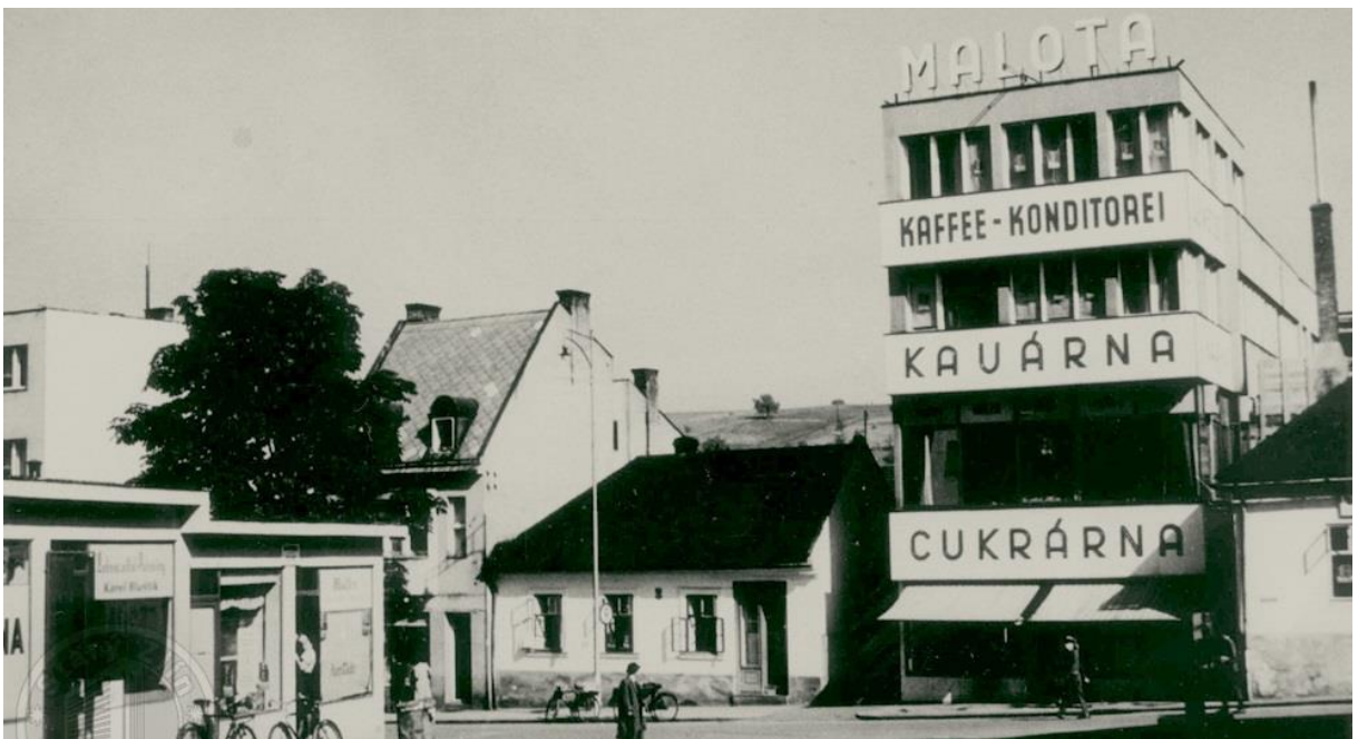
Obr. 10. Malotova cukrárna na Bartošově ulici, 1933