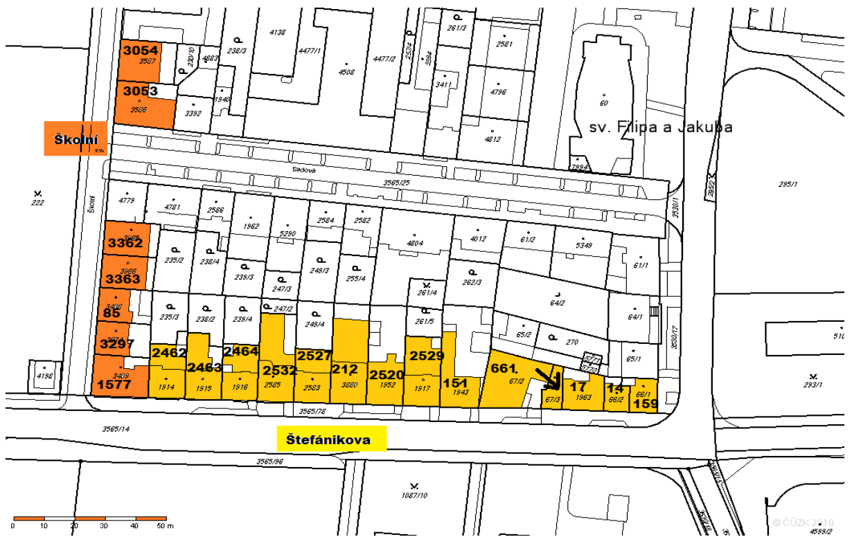
Obr. 20. Snímek katastrální mapy – ulice Školní a Štefánikova