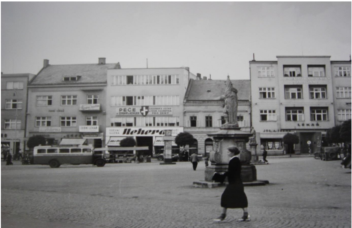
Obr. 3. Severní strana náměstí Míru, 1937