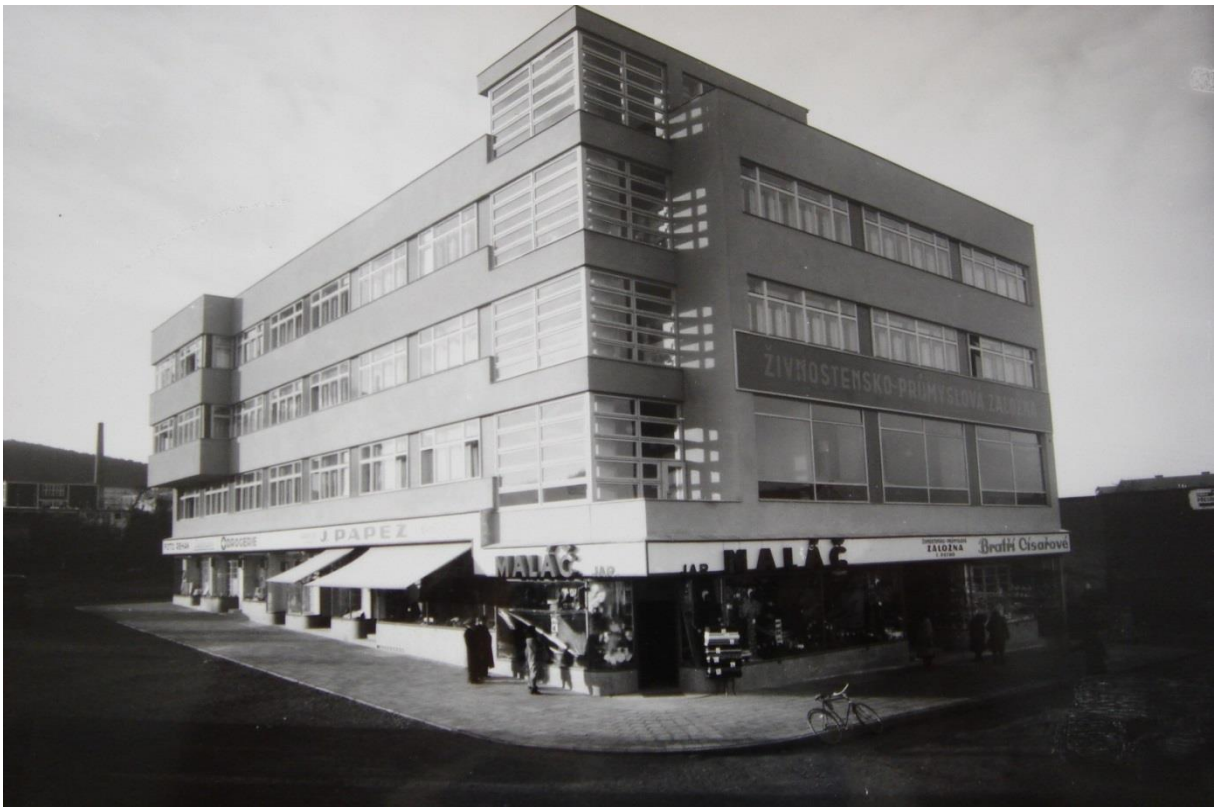
Obr. 9. Dům Františka Javorského na rohu třídy Tomáše Bati a Dlouhé, 1934