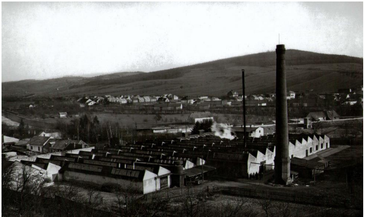
Obr. 14. Pohled ke Štěpánkově továrně a k východní části města, 1919