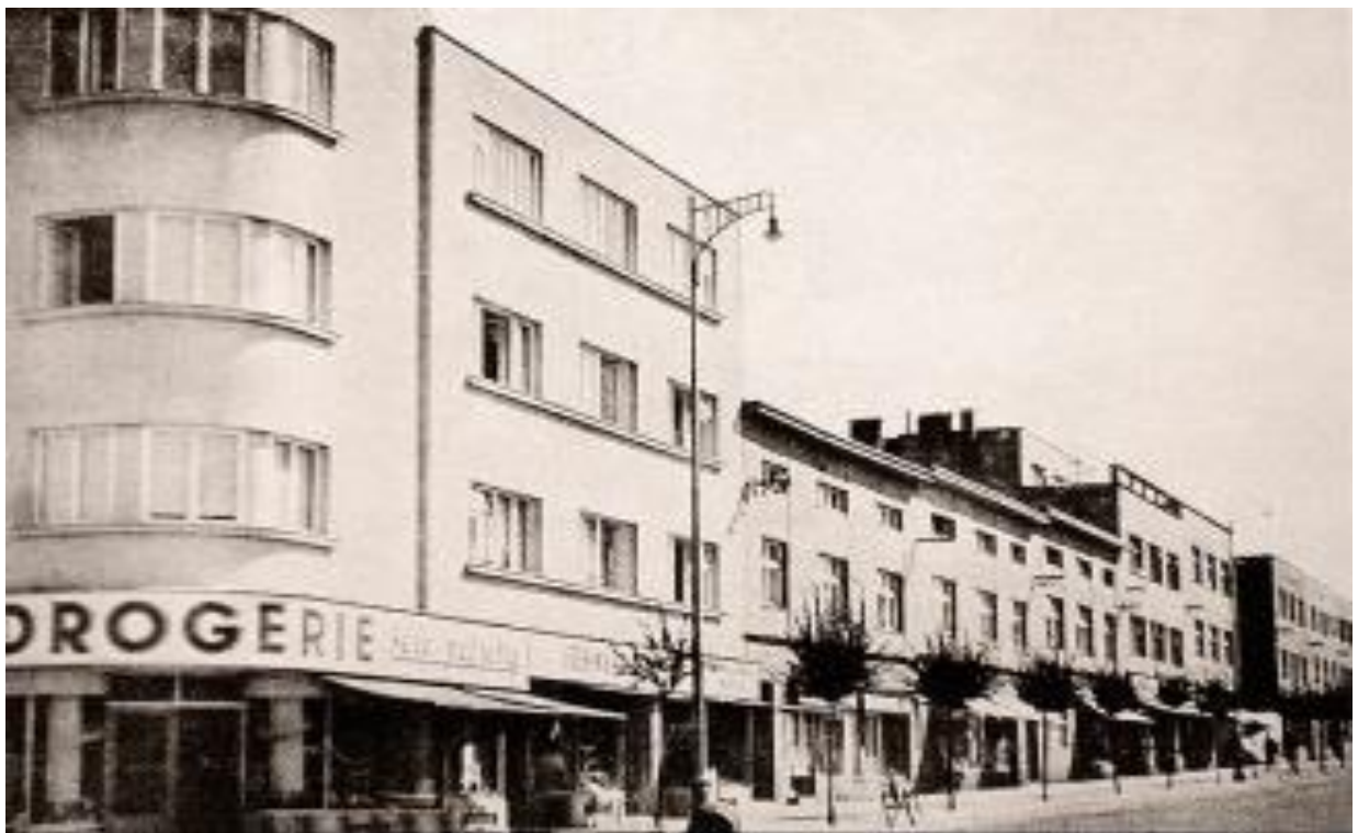
Obr. 13. Severní část Štefánikovy ulice, 1938