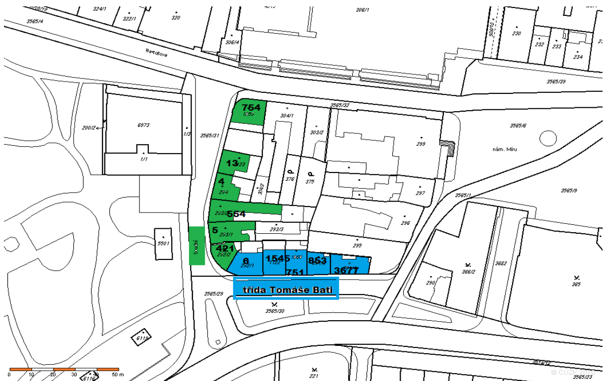
Obr. 18. Snímek katastrální mapy – ulice Soudní a třída T. Bati