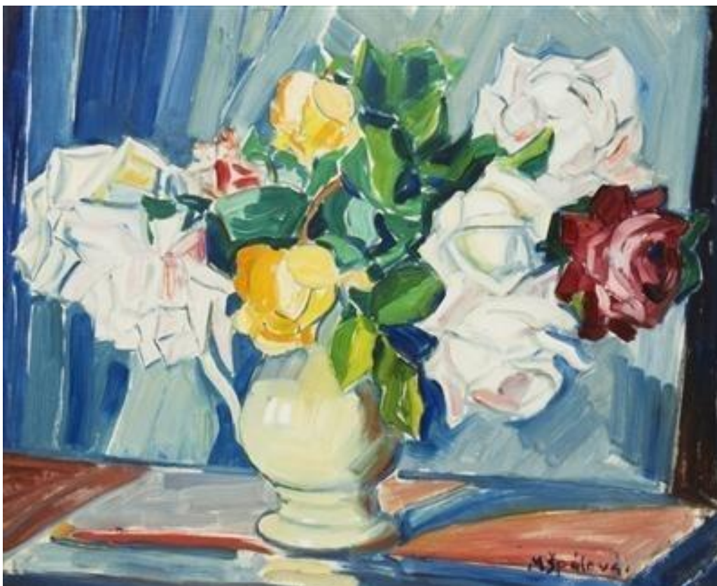
[22] Milada Špálová, Růže ve džbánu , nedatováno, olej, karton, 37 × 45 cm, vpravo dole: MŠpálová.