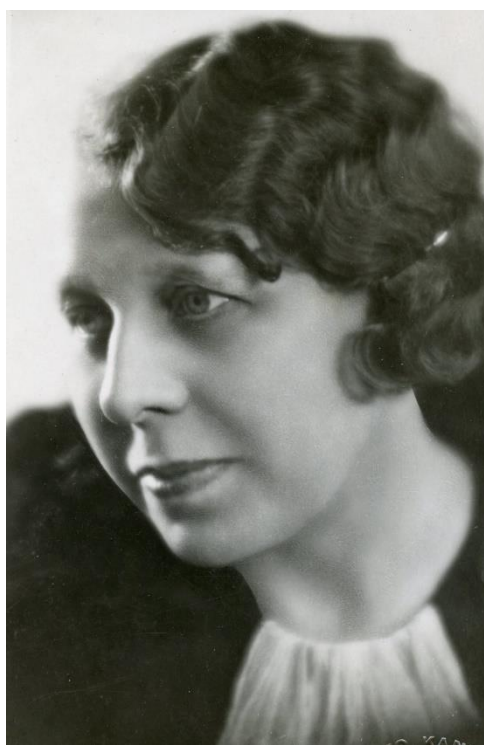
[2] Neznámý autor, portrét malířky, nedatováno.