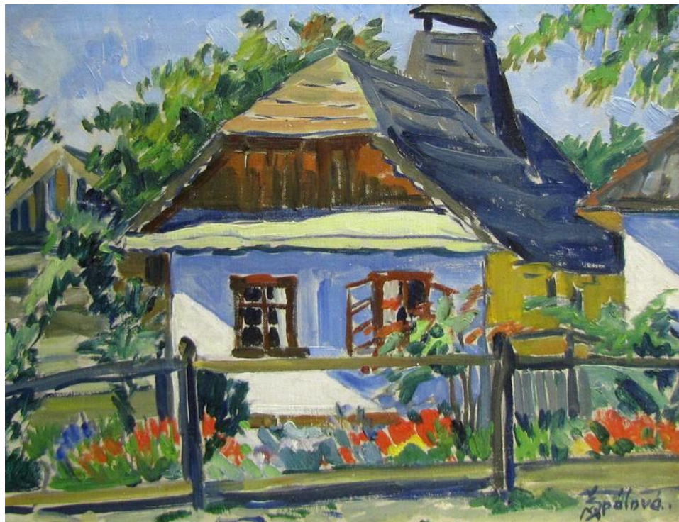
[14] Milada Špálová, Dědinka , kolem 1930, olej, 37 × 46 cm, značeno vpravo dole: MŠpálová