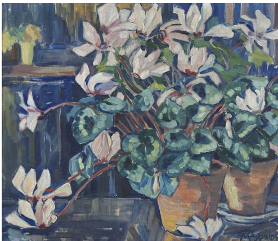
[17] Milada Špálová, Brambořky , 1931, olej, plátno, 46 × 53, 5 cm, značeno vpravo dole: M Špálová