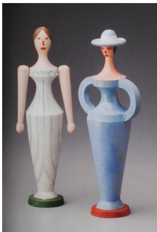
[26] Milada Benešová-Špálová, Panenka, Panenka s kloboukem , kolem 1920, Uměleckoprůmyslové muzeum v Praze.