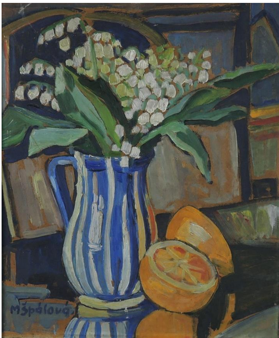
[20] Milada Špálová, Zátiší , nedatováno, olej, karton, 33 × 27 cm, značeno vlevo dole: MŠpálová.