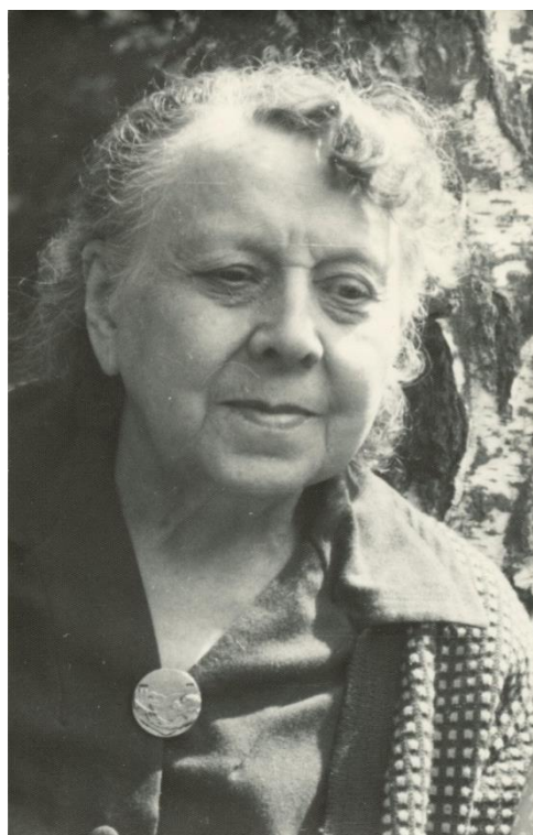
[8] Neznámý autor, Portrét malířky, asi 1961.