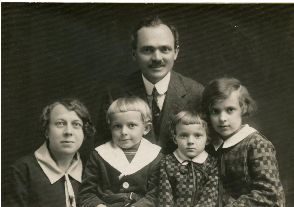
[3] Neznámý autor, Rodinný portrét Špálových, kolem 1920 v Sevljuši.