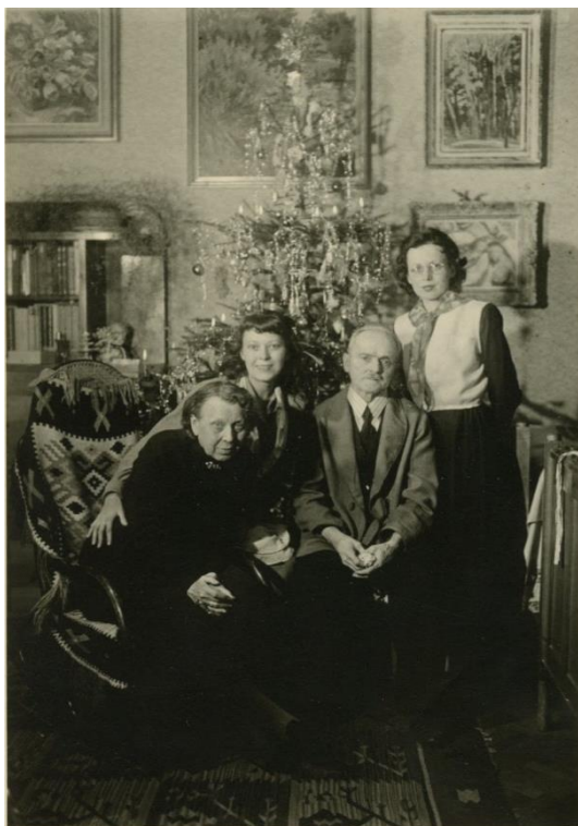
[7] Neznámý autor, Rodinný portrét, asi 1961.