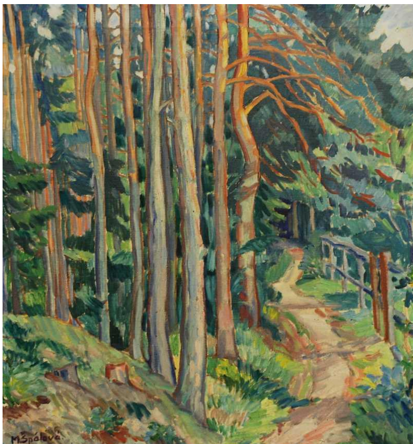
[18] Milada Špálová, Lesní cesta , nedatováno, olej, plátno, 70 × 65 cm, značeno vlevo dole: M.Špálová.