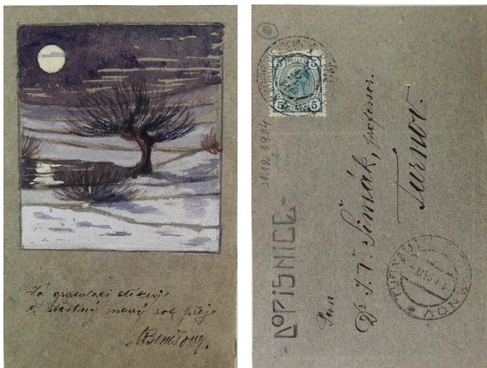
[25] Pohlednice – 31. XII. 1904, Masarykův ústav a Archiv Akademie věd České republiky, fond Josef V. Šimák, Archiválie, sign. II. b) 1., karton 8, inv. č. 203.