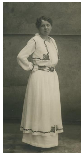
[5] Návrhy M. Špálové, Československý svéráz. Rodinný list pro svéráznou módu. Původní výšivky. Umělecký průmysl III, 1919, č. 9., s. 4.