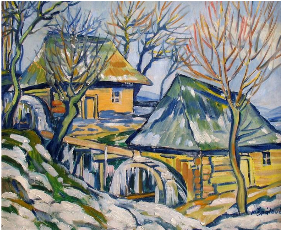
[13] Milada Špálová, Dědina , nedatováno, olej, sololit, 40 × 54 cm, značeno vpravo dole: MŠpálová