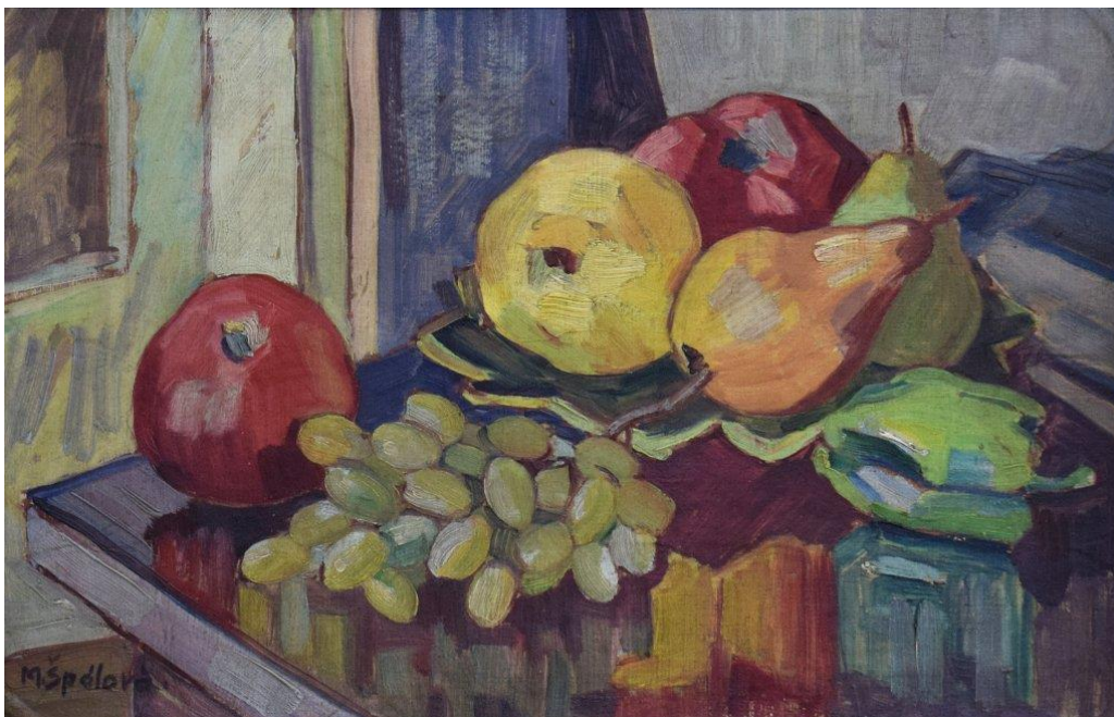
[21] Milada Špálová, Zátiší s ovocem , nedatováno, olej, lepenka, 31 × 46 cm, značeno vlevo dole: MŠpálová.