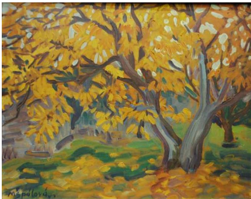
[19] Milada Špálová, Žlutý strom , nedatováno, olej, karton, 26,5 × 34 cm, značeno vlevo dole: MŠpálová