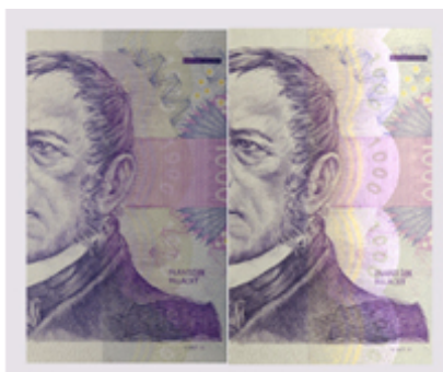
Obrázek 9: Iridiscentní pruh u tisícikoruny

Jak již název tohoto ochranného prvku napovídá, jedná se o 20 mm široký dvoubarevný proužek, který na základě úhlu, pod kterým se na bankovku díváme, mění své zbarvení. Vyhláška o vydání bankovek 1 000 Kč vzoru 2008 zakotvuje iridiscentní pruh jako jeden z ochranných prvků tisícikoruny v ust. § 2 odst. 3: „Bankovkový papír u bankovky vzoru 2008 je opatřen dvoubarevným iridiscentním pruhem umístěným na lící straně vpravo od portrétu Františka Palackého. Levá část pruhu získává pod určitým úhlem světla zlaté zbarvení, nepravidelná pravá část pruhu je fialová a je v ní umístěno negativní označení hodnoty „1000“. Ve střední části iridiscentního pruhu se střídají zlaté a fialové křivky.“ 81 Pokud se na tisícikorunu podíváme v běžném úhlu, iridiscentní pruh v podstatě není ani vidět, můžeme si všimnout pouze slabého žluto oranžového zbarvení. Při mírném naklonění bankovky už je proužek ale zřetelný a barvu mění na fialovou se zlatou.