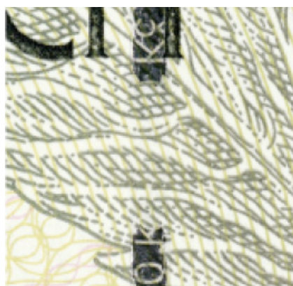
Obrázek 3: Ochranný proužek