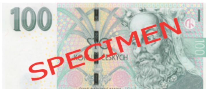
Obrázek 1: Sto korunová bankovka

Vodoznak je ochranný prvek bankovky, který vzniká již při její samotné výrobě. Můžeme se setkat i s pojmenováním vodotisk či vodní značka. Dělí se na negativní, pozitivní a stupňovitý dle toho, zda jsou kreslicí části vodoznaku světlejší či tmavší než zbytek papíru. Existují ornamentní vodoznaky, které nejsou seskupovány do určitého obrazce, ale jsou rozmístěny po celé ploše bankovky. Takovými vodoznaky byly vybaveny veškeré předcházející československé bankovky. 72 Na aktuálně platných bankovkách můžeme vidět figurální neboli portrétní vodoznaky. Ty jsou poměrně velké a jsou situovány v pravé části bankovky. Vodoznak je jeden z nejvýraznějších a samotným okem v průhledu proti světlu viditelných ochranných prvků. Věřím, že si každý, kdo držel v rukách jakoukoli bankovku a nastavil ji proti světlu, si všiml portrétu vyobrazených na bankovkách, ale jako příklad vodoznaku i tak uvedu stokorunovou bankovku. Na této bankovce je vodoznak tvořen portrétem Karla IV., běločarým číslem sto a symbolickým královským jablkem. Vodoznak je velice těžké napodobit, padělá se nejčastěji tiskem a to tak, že obrazec je stínován bílou a černou barvou. Takový vodoznak je však poměrně lehké rozpoznat, neboť uměle vytvořený či nakreslený stín se nechová jako pravý a přirozený.