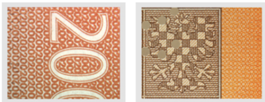
Obrázek 7: Mikrotext - líc a rub dvou set korunové bankovky

Pokud má člověk extrémně dobrý zrak, může tyto malé nápisy vidět i pouhým okem, ale musí se na ně skutečně soustředit. Z toho důvodu mám za to, že mikrotext není příliš praktický ochranný prvek. Málokdo s sebou nosí zvětšovací lupu, aby si mohl přezkoumat pravost bankovky pomocí mikrotextu.