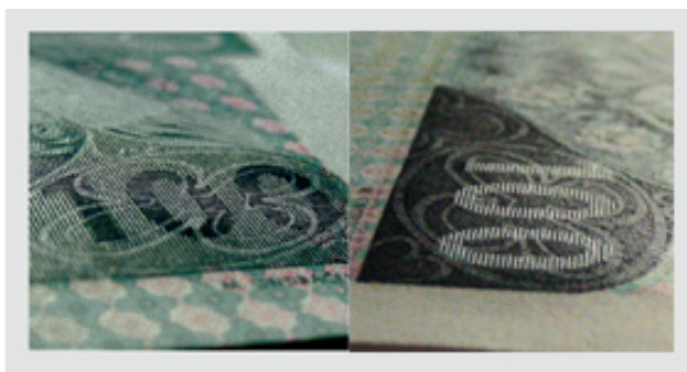
Obrázek 6: Skrytý obrazec

Věřím, že si tohoto ochranného prvku osoba, která bankovkám podrobněji nevěnuje pozornost a bere je pouze jako nástroj k zaplacení či přijmutí platidla, sama od sebe nevšimne. Avšak i to je dle mého důvod, proč je skrytý obrazec jako ochranný prvek na bankovce velice důležitý. Hlubotisk je složitá technika tisku a padělat tento prvek je ještě složitější. Na falešné bankovky užívají padělatelé obyčejný tisk z výšky, čímž však nikdy nedocílí plasticity skrytého obrazce. Pokud přes pravou spodní část přejedeme rukou, můžeme pocitově nahmatat vyvýšenou část, kterou u padělku nenalezneme. Tohoto efektu je možné docílit i umělým protlakem – prolisováním bankovky, tím se však nedosáhne totožným vlastnostem jako při hlubotisku. Prolisovaná bankovka se pozná tak, že pokud se sklopí proti světlu, bude se skrytý obrazec liniemi ostře oddělovat od zbylých částí.