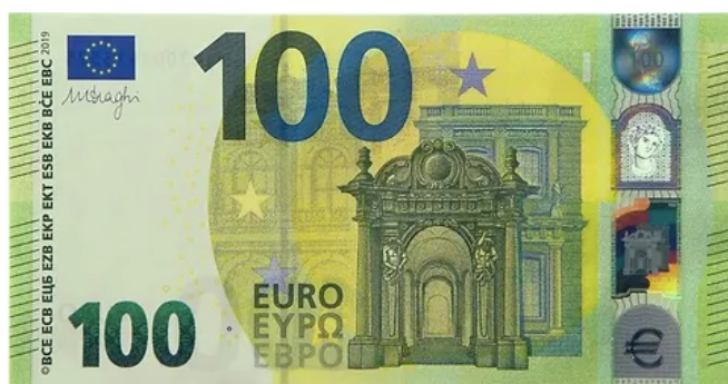
Obrázek 12: Sto eurová bankovka - vpravo holografický proužek

Dalším výrazným prvkem, který jsem v podstatě už zmínila, je stříbrný ochranný proužek na pravé straně bankovky se čtyřmi okny, jejichž obsah i barva se při různém naklonění mění. Například u sto eurové bankovky se při naklonění v horní části holografického proužku objeví hodnotové číslo a malé symboly € pohybující se kolem čísla, v druhém okně zmiňovaný portrét, ve třetím hlavní motiv a v posledním velký symbol €, kolem kterého jsou duhově zbarvené proužky. 111 Celý holografický proužek je velice důmyslný, využívá světla a jeho efekt působí, jako by se na něm obrazce neustále pohybovaly. V žádném úhlu není tento ochranný prvek stejný a z toho důvodu si myslím, že se jedná o prvek s opravdu vysokým stupněm ochrany.