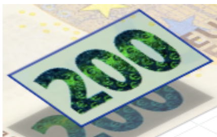
Obrázek 13: Smaragdové zelené číslo

Z jakého důvodu tento ochranný prvek neobsahuje bankovka nejvyšší nominální hodnoty? Odpověď je prostá. Výroba a vydávání pětiseturové bankovky byla ukončena a není součástí nové série Európa, ačkoliv se jí stále platit dá. 112 Dle mého ECB rozhodla správně, jelikož vydávat do oběhu bankovku takto vysoké hodnoty je poněkud nebezpečné a především její užívání je nepraktické. Na druhou stranu je zarážející, že právě bankovka nejvyšší nominální hodnoty zůstala bez aktualizace a zdokonalení ochranných prvků, jelikož úvaha padělatelů by mohla být taková, že pokud zrovna pětiseturová bankovka nemá nové a složitější prvky, budou padělat právě ji. Z tabulky, kterou jsem výše přiložila však vyplývá, že bankovek s nominální hodnotou 500 euro je v oběhu velmi málo, k roku 2023 konkrétně 266,68 kusů. Bylo by tedy nápadné, kdyby se tyto bankovky začaly padělat a do oběhu se jich dostalo velké množství. Platit s bankovkou tak vysoké hodnoty je podezřelé a přijímatelé jsou v takovém případě obezřetní, ať se jedná o pravou bankovku nebo falzifikát.