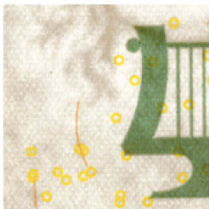
Obrázek 4: Ochranná vlákna

Dle mého tento prvek patří k těm neúčinnějším při ochraně proti padělání platidel. V pravých bankovkách jsou totiž vlákna zapuštěna přímo do papíru. U padělků jsou pak vlákna na bankovkovém papíru pouze nalepené či nakreslené, což lze poznat jejich vyjmutím. Na druhou stranu je nutné zmínit, že při denním užívání člověk nedokáže rychle rozpoznat, zda je samotné vlákno zapuštěno v bankovce nebo je pouze na povrchu. Každopádně experti ČNB pracující ve speciálním oddělení, které se věnuje padělkům a ochraně platidel, díky tomuto ochrannému prvku mohou poměrně lehce zjistit, zda se jedná o pravou bankovku či falzifikát.