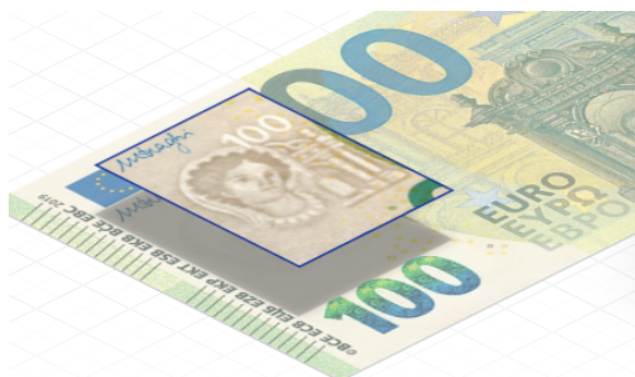
Obrázek 11: Vodoznak s vyobrazením Európy na eurobankovkách

stejném principu jako u českých bankovek a je viditelný pouze při nastavení proti světlu. Stejným způsobem se na pravé straně bankovky v holografickém okně nacházejícím se v ochranném proužku zobrazuje totožná podobizna. Při průhledu nebo naklonění okno zprůhlední a z každé strany bankovky je viditelný portrét Európy. 110