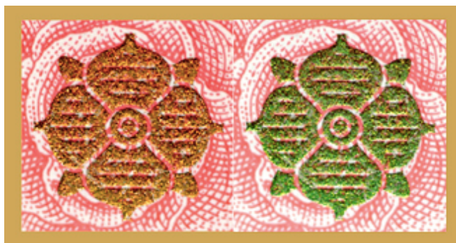
Obrázek 10: Proměnlivá barva na pětisetkoruně