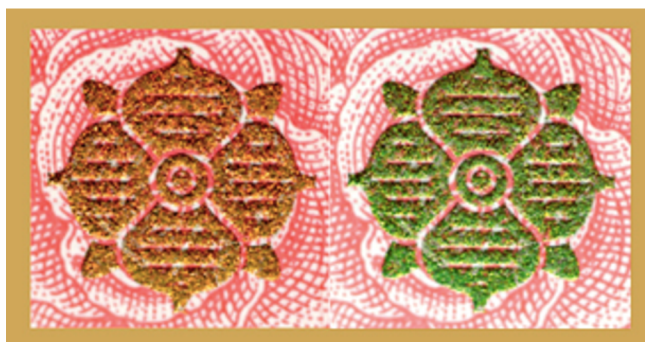
Obrázek 10: Proměnlivá barva na pětisetkoruně