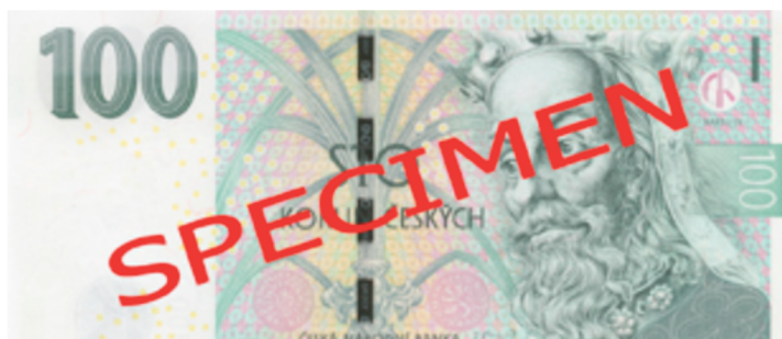
Obrázek 1: Sto korunová bankovka

Vodoznak je ochranný prvek bankovky, který vzniká již při její samotné výrobě. Můžeme se setkat i s pojmenováním vodotisk či vodní značka. Dělí se na negativní, pozitivní a stupňovitý dle toho, zda jsou kreslicí části vodoznaku světlejší či tmavší než zbytek papíru. Existují ornamentní vodoznaky, které nejsou seskupovány do určitého obrazce, ale jsou rozmístěny po celé ploše bankovky. Takovými vodoznaky byly vybaveny veškeré předcházející československé bankovky. 72 Na aktuálně platných bankovkách můžeme vidět figurální neboli portrétní vodoznaky. Ty jsou poměrně velké a jsou situovány v pravé části bankovky. Vodoznak je jeden z nejvýraznějších a samotným okem v průhledu proti světlu viditelných ochranných prvků. Věřím, že si každý, kdo držel v rukách jakoukoli bankovku a nastavil ji proti světlu, si všiml portrétu vyobrazených na bankovkách, ale jako příklad vodoznaku i tak uvedu stokorunovou bankovku. Na této bankovce je vodoznak tvořen portrétem Karla IV., běločarým číslem sto a symbolickým královským jablkem. Vodoznak je velice těžké napodobit, padělá se nejčastěji tiskem a to tak, že obrazec je stínován bílou a černou barvou. Takový vodoznak je však poměrně lehké rozpoznat, neboť uměle vytvořený či nakreslený stín se nechová jako pravý a přirozený.