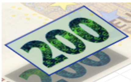
Obrázek 13: Smaragdové zelené číslo

Z jakého důvodu tento ochranný prvek neobsahuje bankovka nejvyšší nominální hodnoty? Odpověď je prostá. Výroba a vydávání pětiseturové bankovky byla ukončena a není součástí nové série Európa, ačkoliv se jí stále platit dá. 112 Dle mého ECB rozhodla správně, jelikož vydávat do oběhu bankovku takto vysoké hodnoty je poněkud nebezpečné a především její užívání je nepraktické. Na druhou stranu je zarážející, že právě bankovka nejvyšší nominální hodnoty zůstala bez aktualizace a zdokonalení ochranných prvků, jelikož úvaha padělatelů by mohla být taková, že pokud zrovna pětiseturová bankovka nemá nové a složitější prvky, budou padělat právě ji. Z tabulky, kterou jsem výše přiložila však vyplývá, že bankovek s nominální hodnotou 500 euro je v oběhu velmi málo, k roku 2023 konkrétně 266,68 kusů. Bylo by tedy nápadné, kdyby se tyto bankovky začaly padělat a do oběhu se jich dostalo velké množství. Platit s bankovkou tak vysoké hodnoty je podezřelé a přijímatelé jsou v takovém případě obezřetní, ať se jedná o pravou bankovku nebo falzifikát.