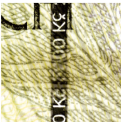
Obrázek 2: Ochranný proužek proti světlu

Padělání ochranného proužku je náročný technologický proces, jelikož se nejedná o něco, co není možné lehce natisknout či nakreslit na bankovku. Ochranný proužek se na bankovkový papír přidává jako samostatná část. Dalším specifikem tohoto ochranného prvku, který však nalezneme pouze na bankovkách vyšší nominální hodnoty, je změna barvy při natočení bankovky na stranu. S ohledem na dopad světla se proužek postupně mění z měděného na stříbrný až zelený a obráceně.