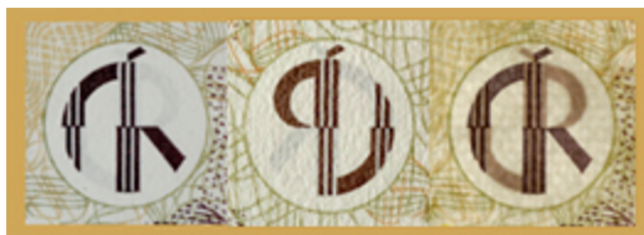
Obrázek 5: Soutisková značka - na jednotlivých stranách a v průhledu

Soutisková značka je někdy pojmenovávána jako průhledka, neboť celistvá je vidět pouze v průhledu proti světlu. Na každé straně bankovky je pouhá část nápisu a až při pohledu proti světlu je kruhová značka viditelná celá. Jednotlivé části se spojí do perfektně překrývajícího znaku, a to právě díky již zmiňovanému plošnému tisku.