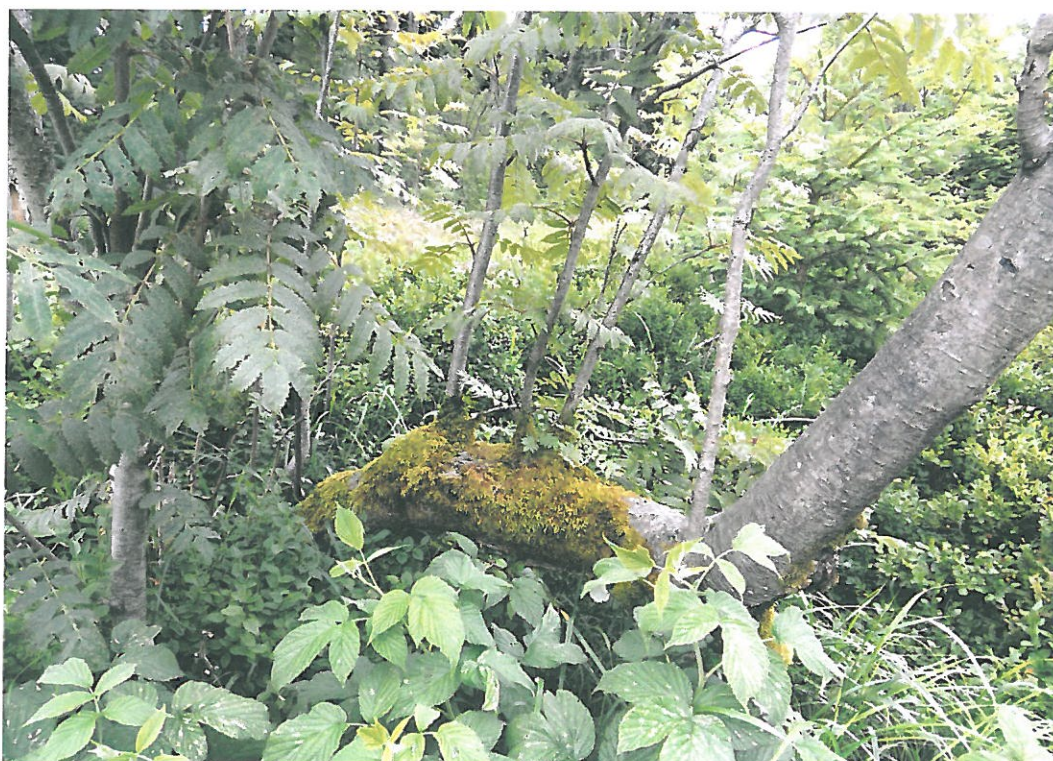
Obr. 6. Suchý Vrch 3002