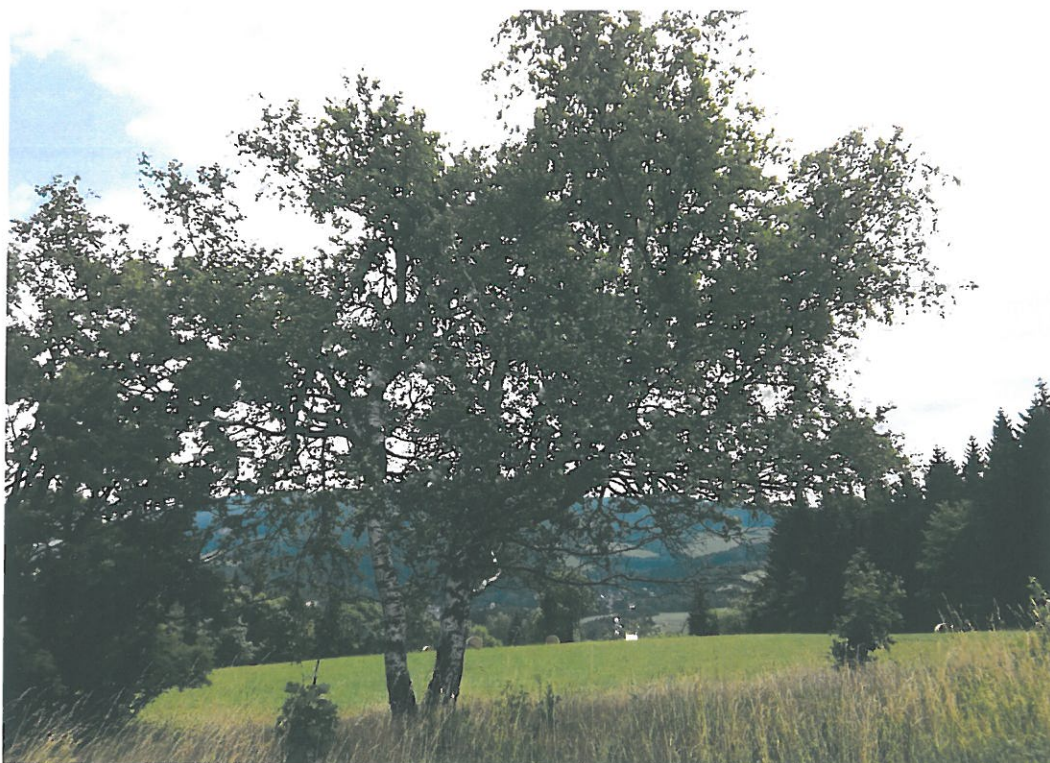
Obr. 12. Adam 3005