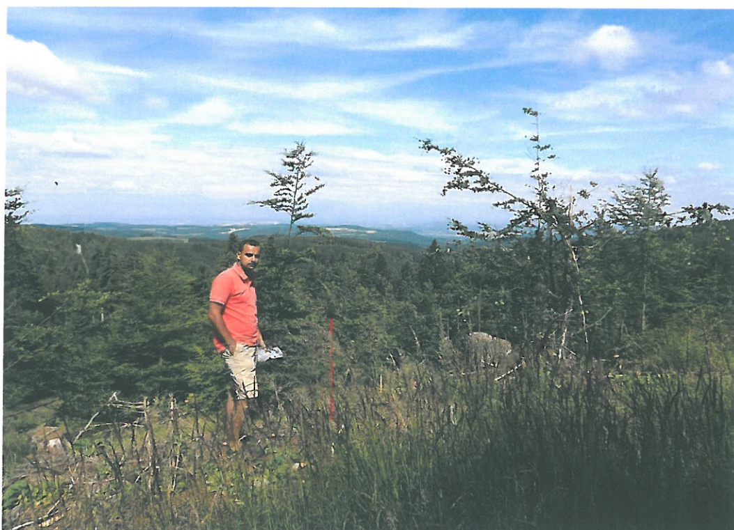
Obr. 8. Souš 3003