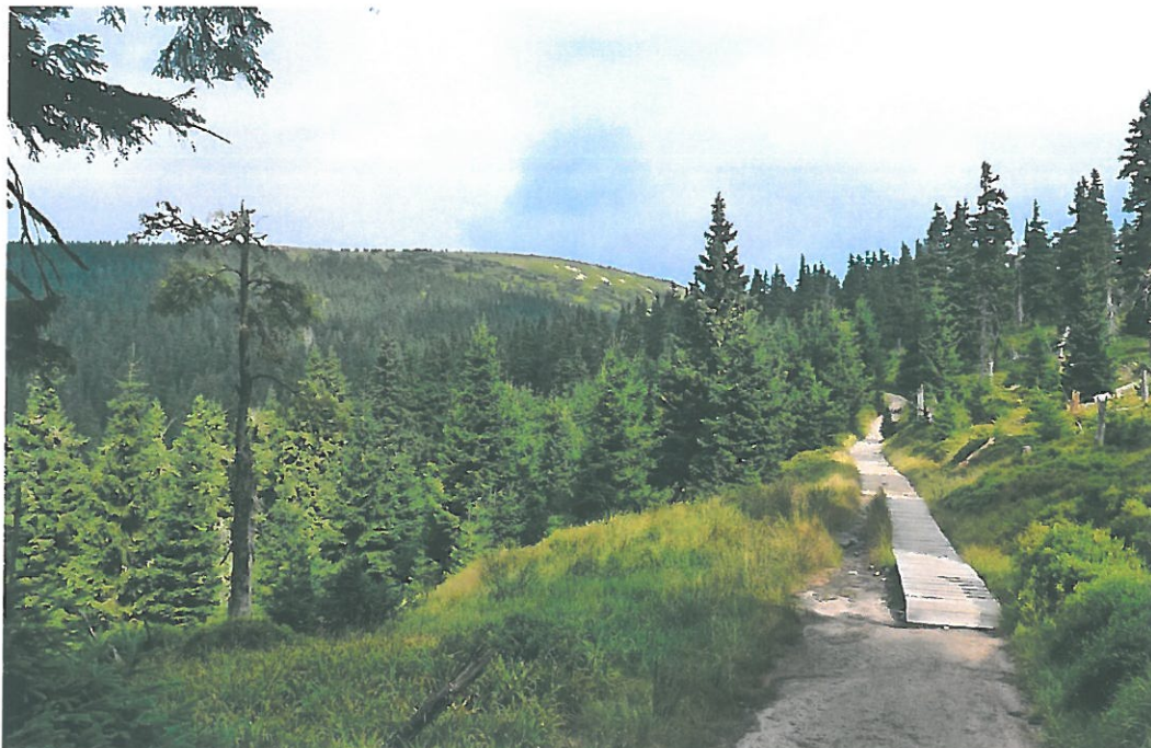
Obr. 9. Králický Sněžník 3004