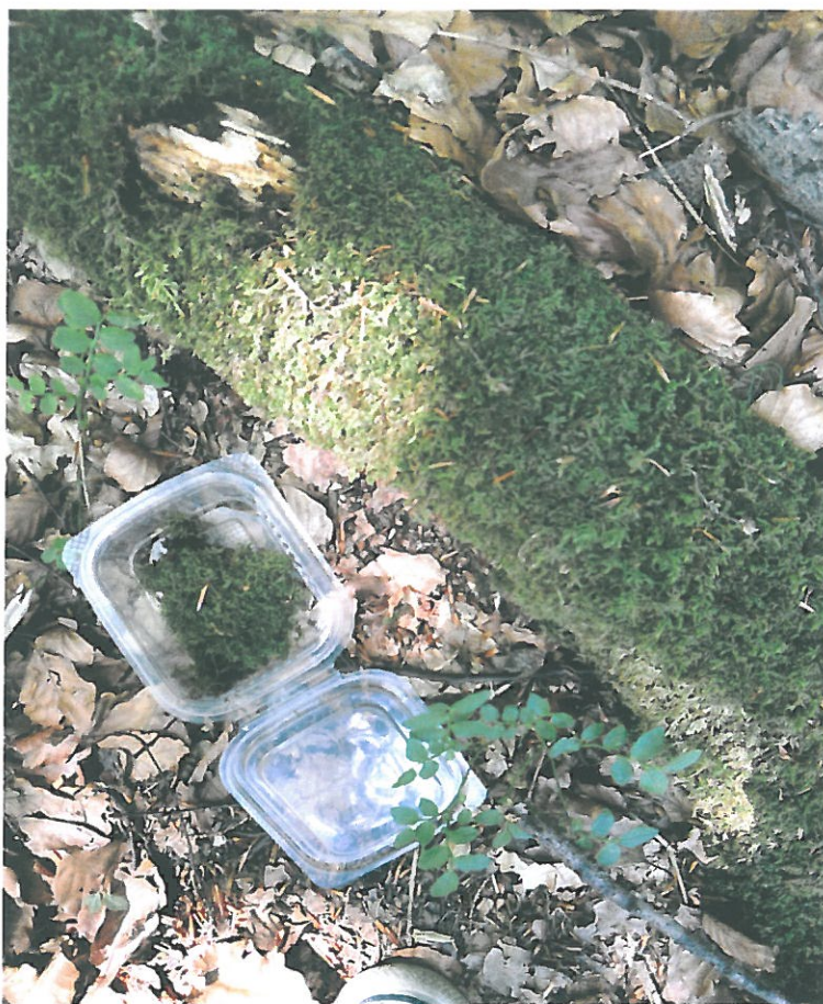
Obr. 20. Dobrošov 3008