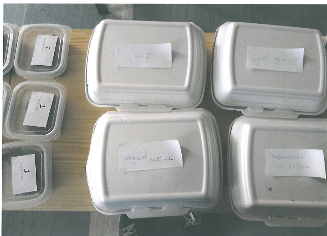
Obr. 23. Vzoroký odebrané na sledovaném území