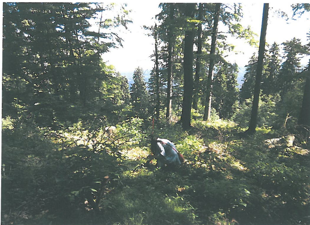
Obr. 14. Komáří Vrch 3006