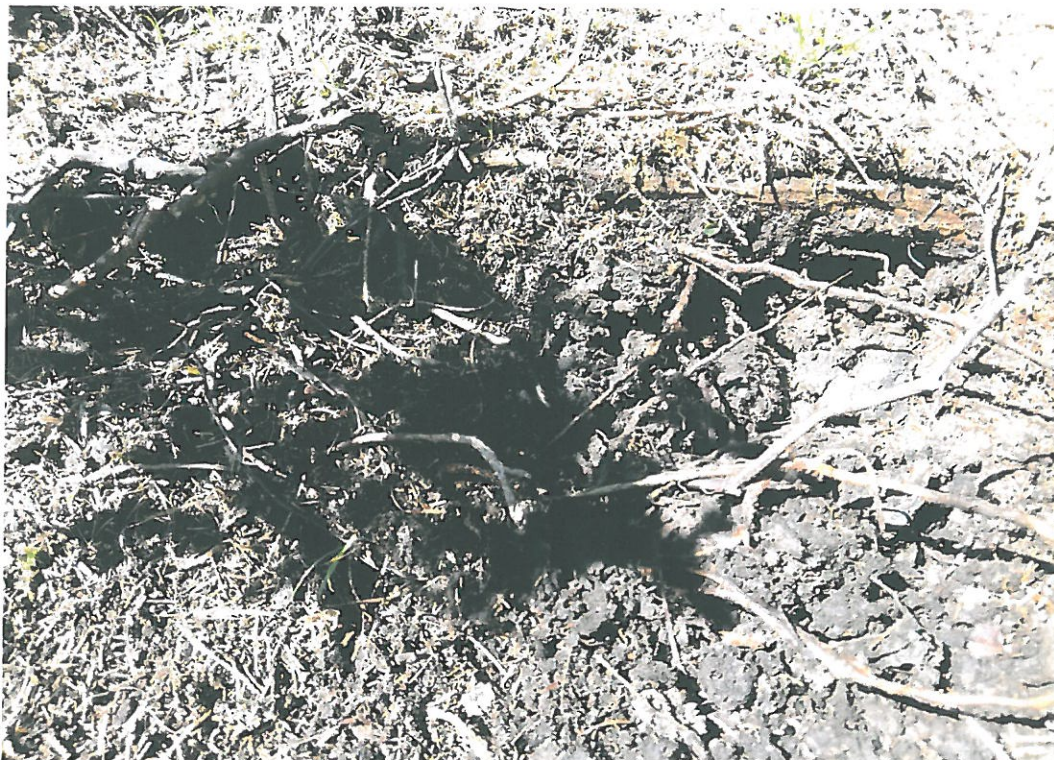
Obr. 1. Velká Deštná 3001