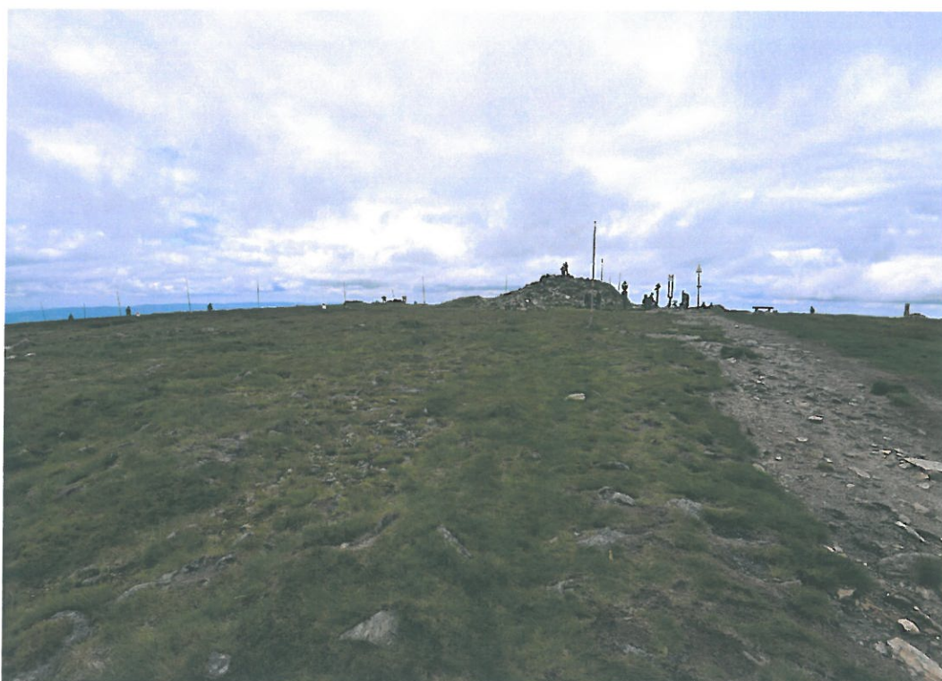
Obr. 10. Králický Sněžník 3004