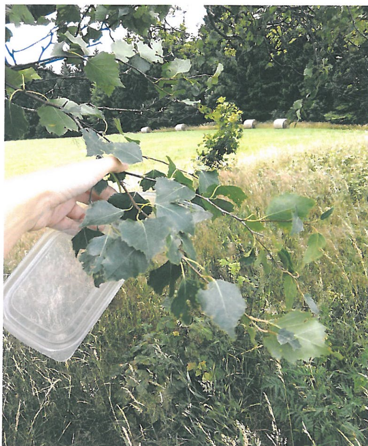
Obr. 17. Vrchmezí 3007