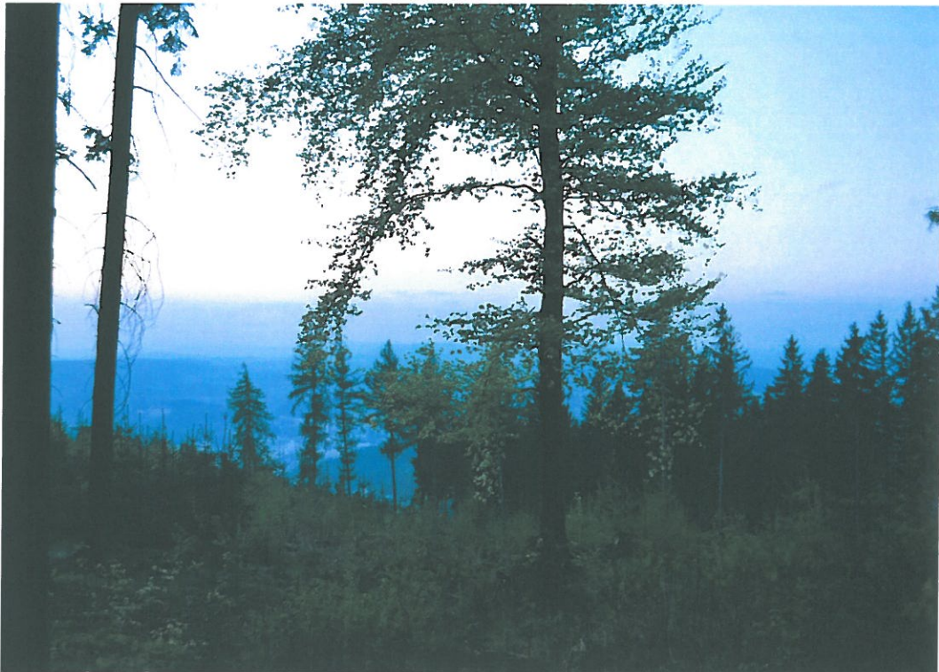
Obr. 19. Dobrošov 3008