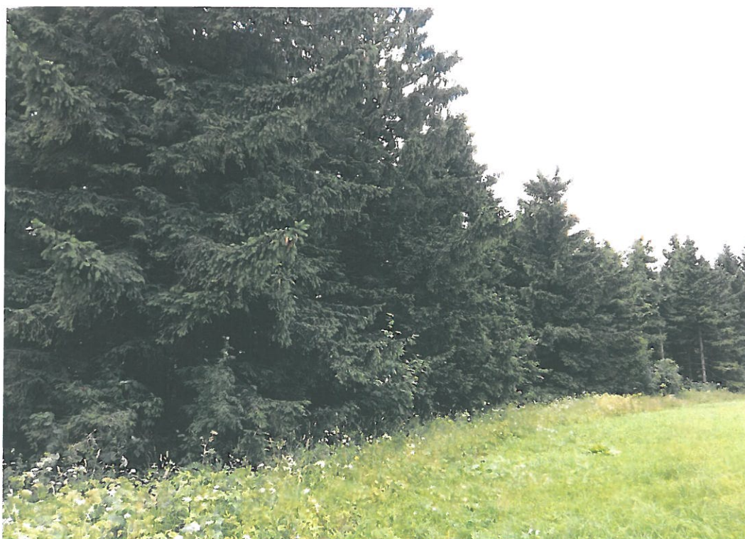
Obr. 13. Adam 3005