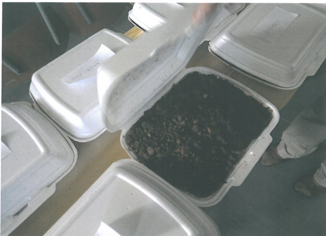
Obr. 24. Vzorky odebrané na sledovaném území