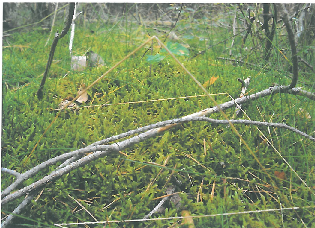
Obr. 22. Božanovský Špičák 3009