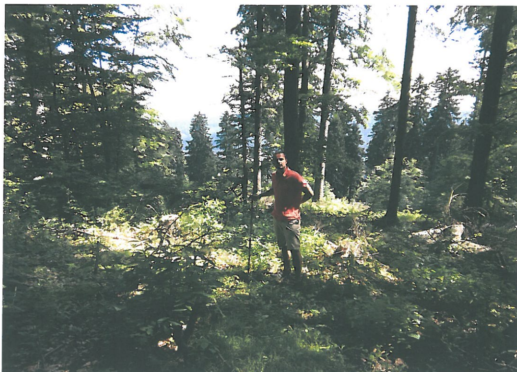
Obr. 15. Komáří Vrch 3006