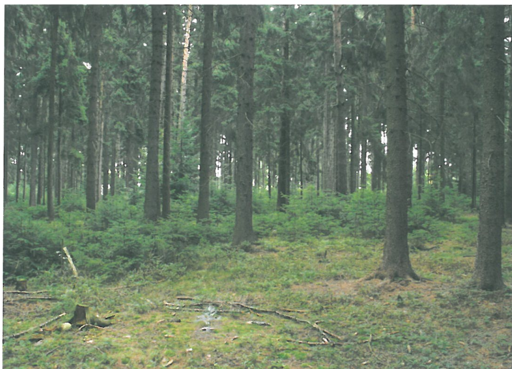
Obr. 21. Božanovský Špičák 3009