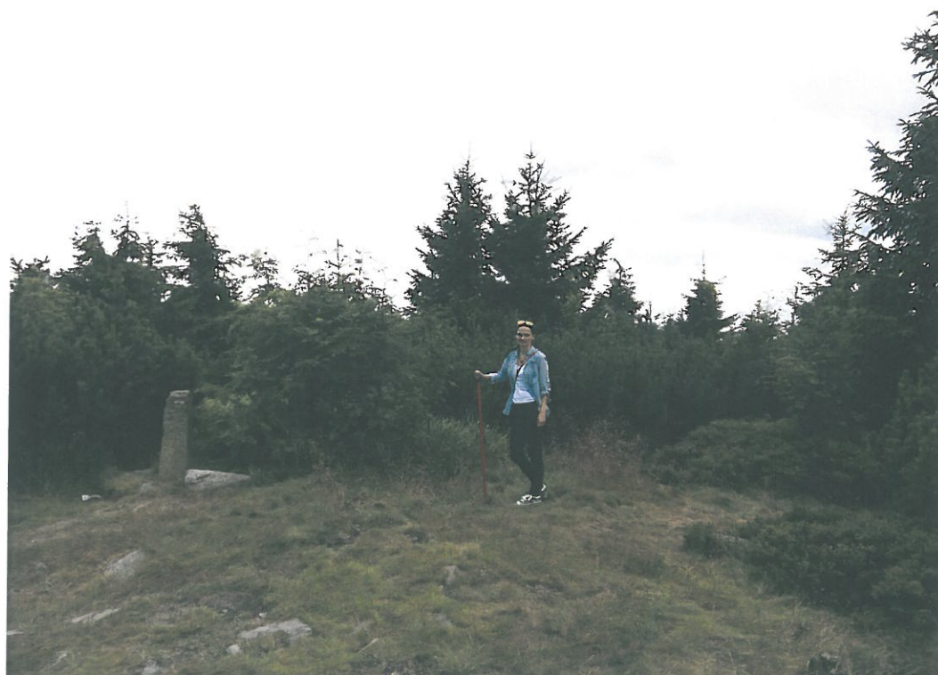
Obr. 4. Suchý Vrch 3002