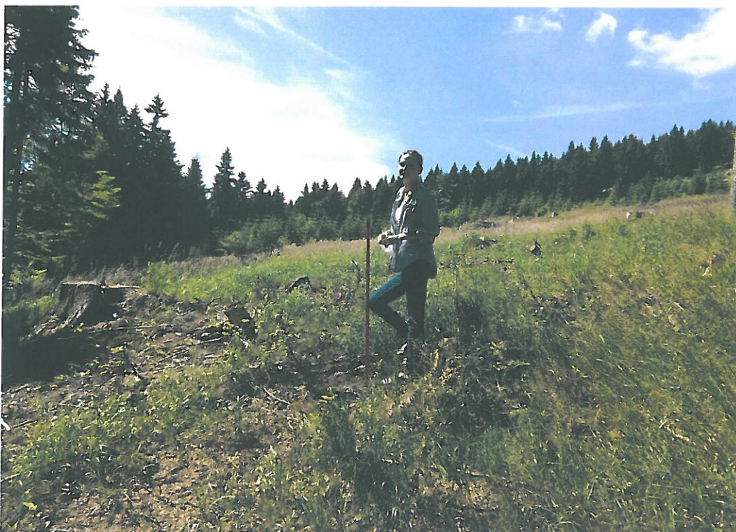
Obr. 2. Velká Deštná 3001