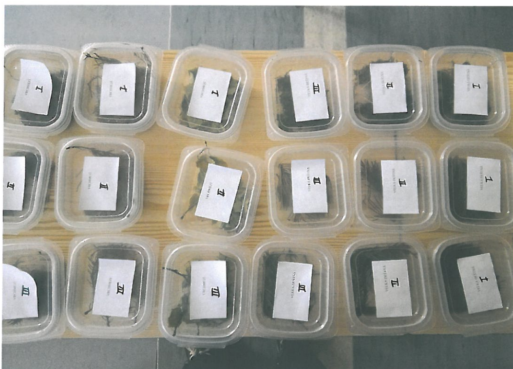
Obr. 25. Vzorky odebrané na sledovaném území