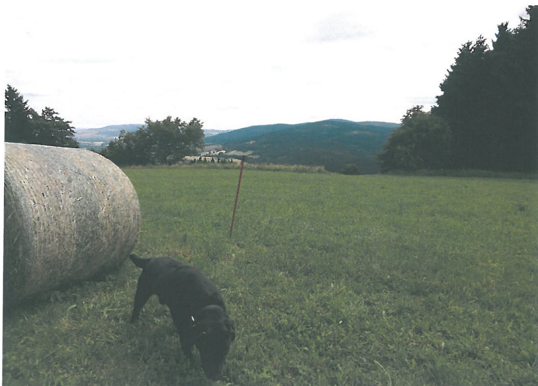
Obr. 11. Adam 3005