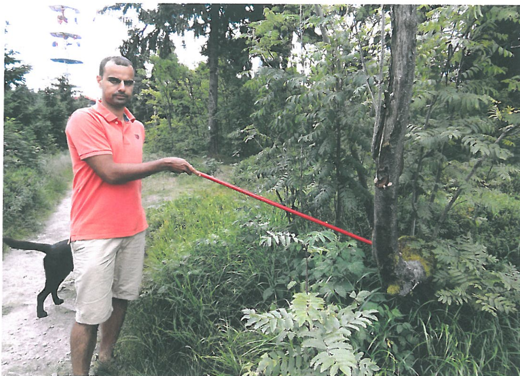
Obr. 5. Suchý Vrch 3002