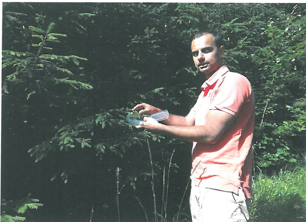
Obr. 16. Vrchmezí 3007