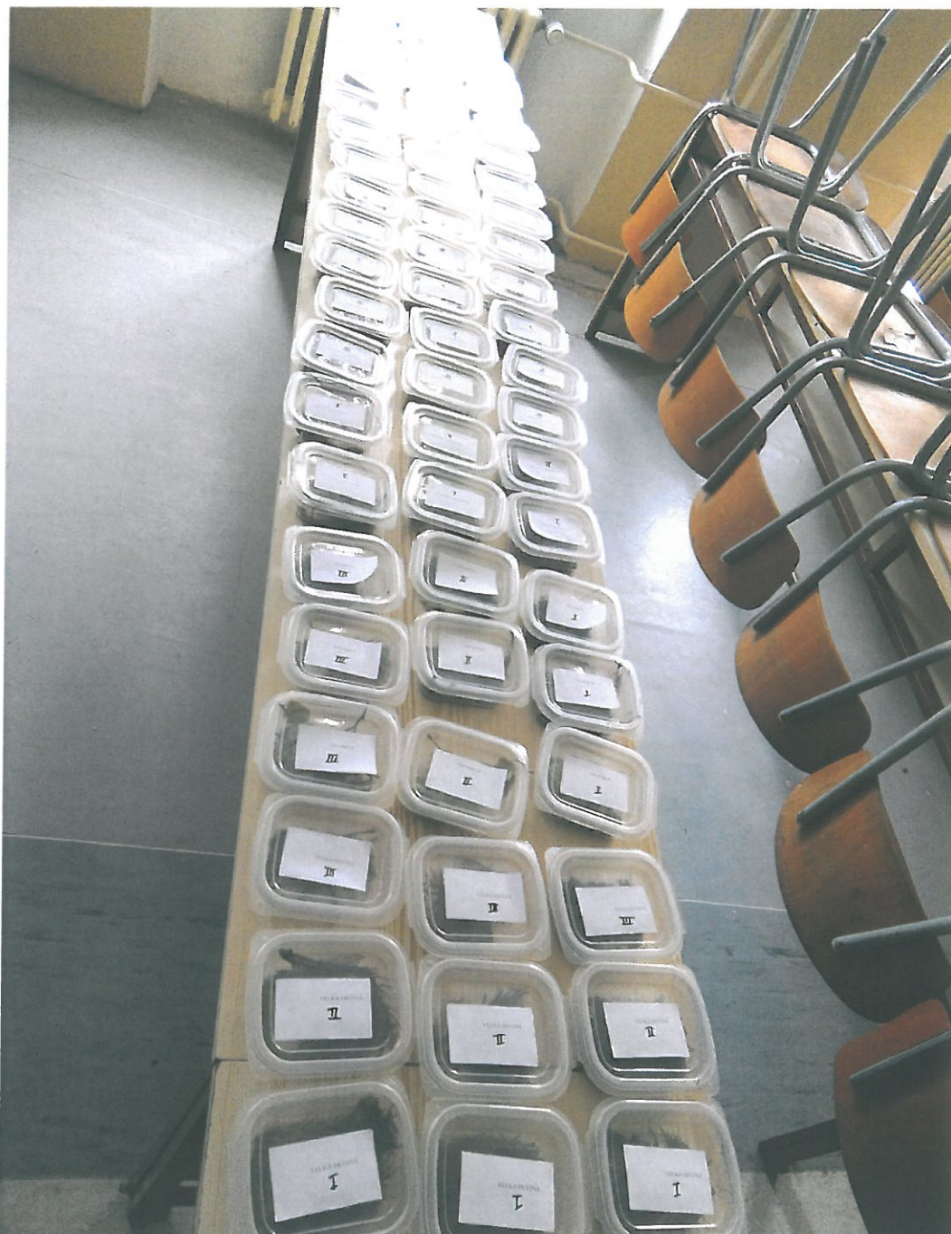
Obr. 26. Vzorke odebrané na sledovaném území