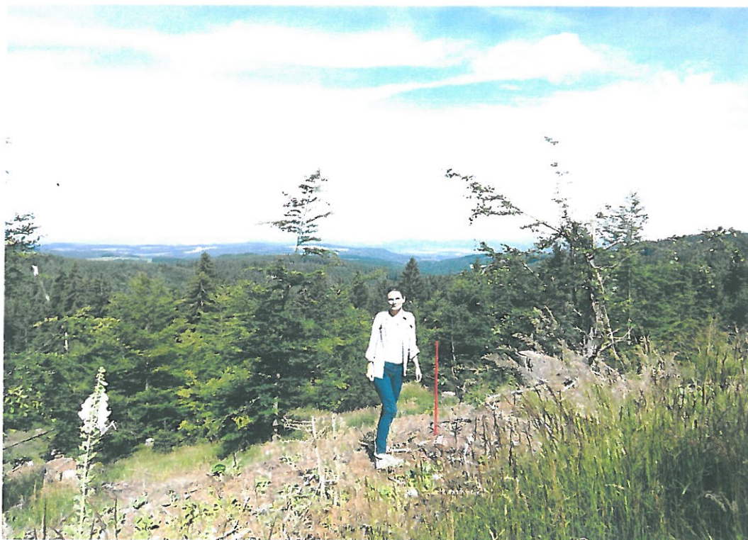
Obr. 7. Souš 3003