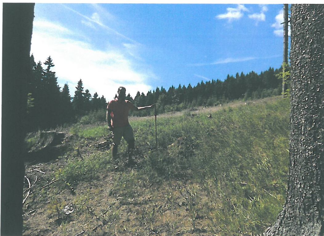
Obr. 3. Velká Deštná 3001