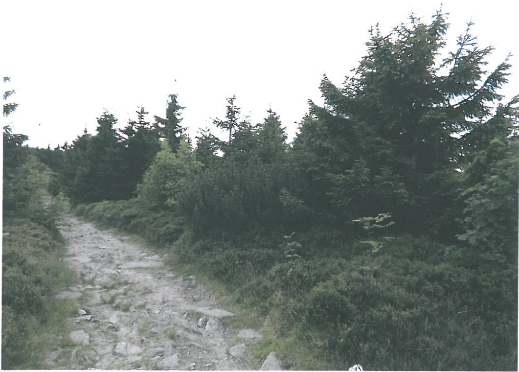
Obr. 18. Vrchmezí 3007