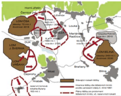
Mapa plánovaného postupu těžby dle těžebních společností