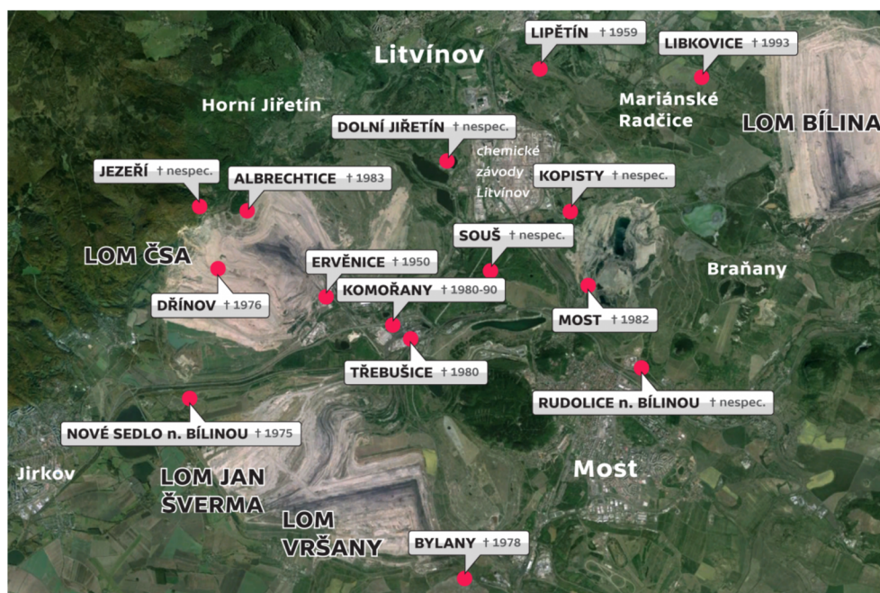
Obrázek 3 Zaniklé obce v důsledku těžby uhlí

V této oblasti se hnědé uhlí těží ve větším měřítku již od roku 1901. Místní hnědouhelný lom v průběhu let dvakrát změnil název. Původní název Hedvika byl v roce 1947 nahrazen názvem důl President Roosevelt. Další změna přišla v roce 1958, kdy byl zaveden současný název Lom Československé armády Ervěnice. Tento velkolom byl jedním z největších zásobovacích zdrojů velkých československých elektráren. V roce 1926 sílil hlad po elektrické energii a zajištění energetické bezpečnosti státu. Právě z tohoto důvodu nechal stát v roce 1926 postavit novou elektrárnu v Ervěnicích. V té době se dokonce jednalo o největší elektrárnu na území ČSR. Statistiky uvádějí, že v období mezi roky 1901 až 2006 bylo v oblasti Lomu ČSA vytěženo celkem 320 milionů tun velmi kvalitního hnědého uhlí. Zároveň k tomu bylo potřeba odbagrovat více než jednu miliardu metrů krychlových skrývky. Největším rozšířením prošel tento velkolom, stejně jako další okolní velkolomy, v období vlády komunistického režimu. Během tohoto období zanikly desítky obcí po celé Severočeské hnědouhelné pánvi, aby uvolnily prostor pro rozšiřující se uhelné doly. (Štýs, 2013 str. 52)