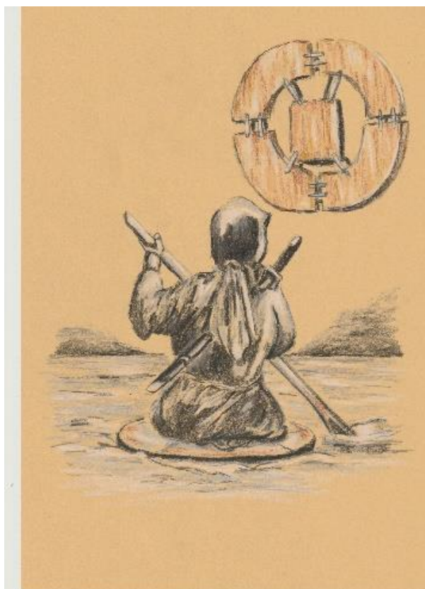
Obrázek 5 - vodní pavouk

patrně málo podrobným studiem kresby vodního pavouka, u kterého je vyobrazena další pomůcka s ním spojená. Jedná se v podstatě o jakési ploutve zvané Mizukaki. Dle názoru autora diplomové práce ten, kdo rozšířil mylně tuto informaci se domníval, že se Mizukaki nasazuje na střed vodního pavouka a navléká na obě nohy a takto pak zdolává vodní bariéru. Nasazuje se však na nohy a používá jako klasické ploutve. Celá kresba byla patrně chybně pochopena i díky neznalosti starojaponštiny, která je ke kresbě připojena a celé užití vysvětluje. Ke špatné interpretaci tak mohlo dojít velice snadno.