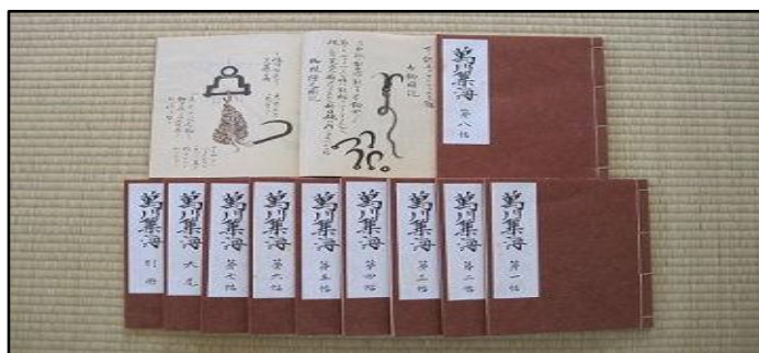
Obrázek 2 - originál Bansenshukai

neodkazuje na nějaké konkrétní bojové školy, jak tvrdí někteří dnešní protagonisté vydávající se za “poslední” z nindžů. Nindžucu by se dalo zařadit do tzv. “gungaku heiho”, tedy válečnických umění, vztahujících svoje znalosti k taktice, strategii, speciálním dovednostem zahrnující léčení, jedy, výbušniny a mnohým jiným dalším znalostem včetně znalostí tehdejší astronomie, geografie, lidské psychologie a v neposlední řadě i techniky obrany proti použití takto vycvičených osob, tedy dovednostem, které by se daly nazvat kontrašpionáží, a které tradiční japonské školy bojových umění nazývají termínem shinobi-yaburi. Nejvýznamnějšími dosud nalezenými densho svitky nindžucu jsou Shoninki (Natori Sanjuro Masatake - 17. století), Bansenshukai (Fujibayashi Yasutake z Kogy - 1676), Ninpiden (známý též jako Shinobi hiden, Hattori Hanzo - 1560). Tyto materiály vypovídají o reálných technikách užití umění nindžucu v podmínkách tehdejší doby. Na obrázku níže je vyobrazen originál výtisku Bansenshukai