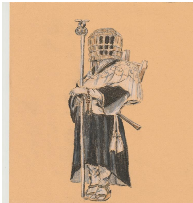
Obrázek 7 - mnich Komuso