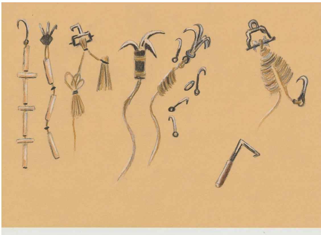
Obrázek 4 - lezecké nástroje