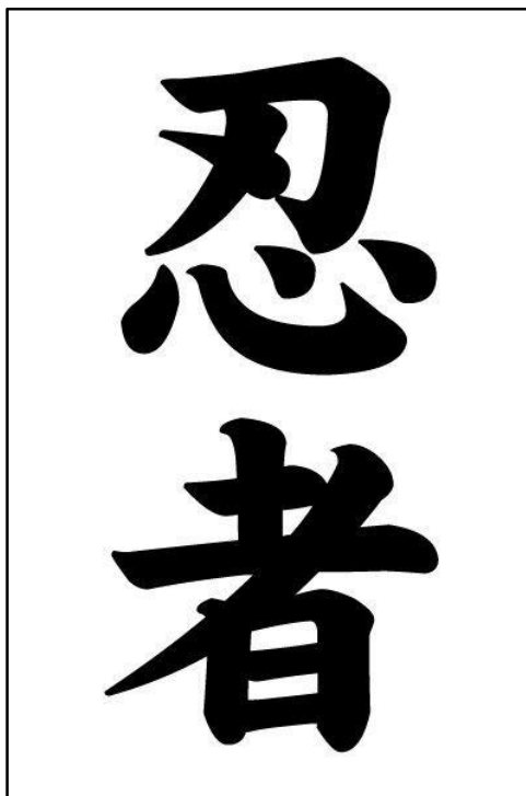
Obrázek 1 - znak pro výraz Nindža