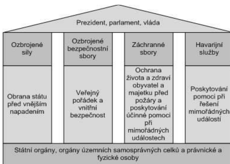
Obrázek 1. Bezpečnostní systém České republiky (Novák, 2014b).

Česká republika je v preambuli Ústavy ČR v čl. 1 projektována jako jednotný, svrchovaný a demokratický stát. Jedním ze základních úkolů takového státu je zajištění bezpečnosti. Takovýto úkol je státem plněn na mnoha úrovních – celostátní, mezinárodní, na jednotlivých stupních územní organizace státu a taktéž ve vztahu k jednotlivci (Dančák & Šimíček, 2002). K zajištění svých bezpečnostních zájmů Česká republika rozvíjí a vytváří souborný hierarchicky uspořádaný bezpečnostní systém, který propojuje roviny politické (vnitřní a zahraniční), vojenské, vnitřní bezpečnosti a ochrany obyvatel, hospodářské, finanční, legislativní, právní a sociální (Novák, 2014b).