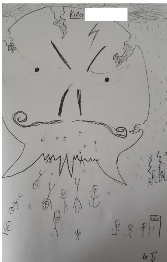
Obrázek 2 - Killer ...

Z obrázků je zřejmé, že Tomáš vnímal svou učitelku jako nepřítele a využil Facebook jako nástroj své pomsty. Naštěstí se situace vyřešila, ale je to pouze jen jeden případ z mála.