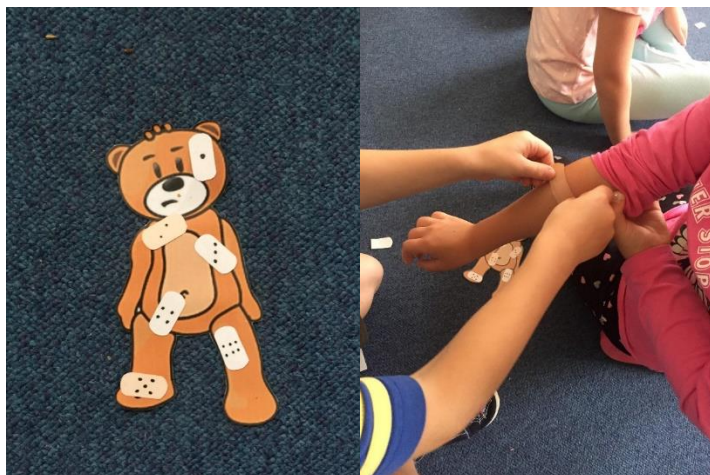
Obr. 11

Potom si děti ve dvojici vyzkoušely obvázat kamaráda a nalepit mu náplast. S náplastmi se setkaly i u další aktivity, kde přiřazovaly správnou náplast k medvídkovi podle čísel. Tato aktivita byla pro někoho jednoduchá, ale někomu zabrala více času. Děti, které byly hotové, mohly pomoci těm, které s přiřazováním měly problémy.