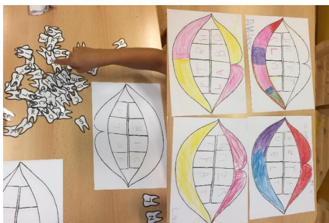
Obr. 9 zdroj vlastní

Kdo byl hotový u předchozí činnosti, tak si vzal papír s nakreslenými zuby a na stole si bral položená písmenka. Děti zkusily opisovat písmenka, u čehož jsem na ně dohlížela a když nastal nějaký problém, tak jsem jim pomohla. Když děti písmenko neznaly, tak jsem jim ho poradila a ukázali jsme si, jak ho správně napsat.