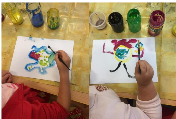
Obr. 13

Každý si zkusil představit, jak bacil vypadá a následně jsme bacila malovali vodovými barvami. Bohužel aktivita proběhla za dob covidu, takže většina dětí měla obrázek podobný tomu, jak byl ztvárňován covid v televizi.