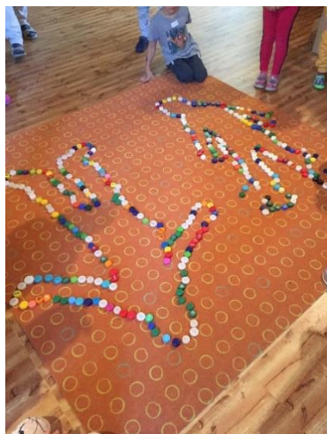
Obr. 1

Hádání bylo pro děti těžší, ale postupně přišly na to, zda se jedná o holku, nebo kluka a dobraly se ke správnému výsledku.