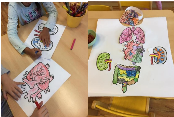
Obr. 2