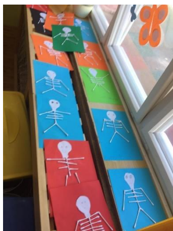
Obr. 4

Na koberci jsem dětem ukázala, jak vypadá kostra, k čemuž mi paní učitelka půjčila model kostry ze školky. Řekli jsme si, k čemu je kostra v těle důležitá a přesunuli jsme se ke stolečkům, kde si každé dítě zkusilo svou kostru vytvořit z tyčinek do uší. S paní učitelkou jsme pomáhaly při celkovém dotvoření kostry a při vystřihávání lebky z bílého papíru.