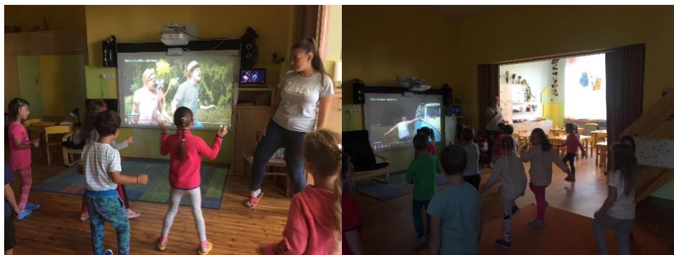
Obr. 5

Když byly děti hotové, tak jsme se přesunuli k interaktivní tabuli, kde jsme si pustili písničku Hejbní kostrou. Postavila jsem se k tabuli a dětem předváděla taneček. Ihned se jim podařilo se zapojit, jen některé děti při prvním pokusu některé pohyby nestihly. Tento taneček byl následně hodnocen jako jedna z nejlepších aktivit dnešního dne.