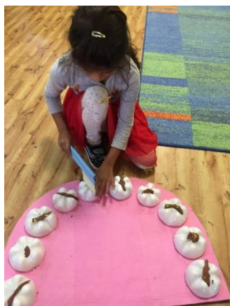
Obr. 7

Následovala hra na zubaře, kdy se děti rozdělily do skupin a vyzkoušely si roli zubaře. Do skupiny jsem jim dala velký model zubů a kartáček na zuby. Na zubech byla modelína, která představovala nečistoty a kazy a děti musely zuby vyčistit. Tato činnost je moc bavila.