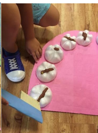
Obr. 8 zdroj vlastní

Kdo byl hotový u předchozí činnosti, tak si vzal papír s nakreslenými zuby a na stole si bral položená písmenka. Děti zkusily opisovat písmenka, u čehož jsem na ně dohlížela a když nastal nějaký problém, tak jsem jim pomohla. Když děti písmenko neznaly, tak jsem jim ho poradila a ukázali jsme si, jak ho správně napsat.