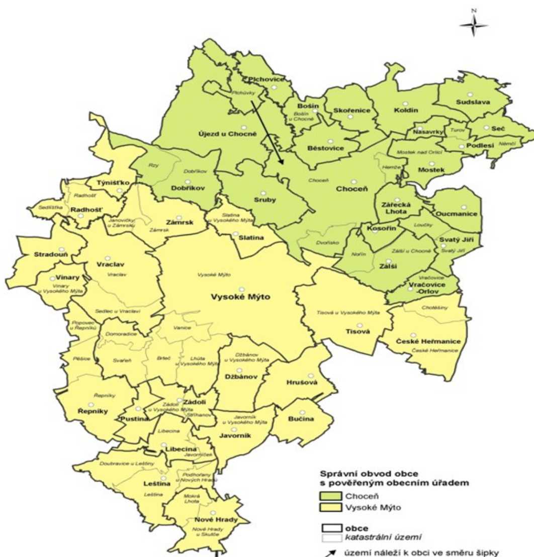
Obrázek 3: Správní obvod obce Vysoké Mýto s rozšířenou působností 81

Město Vysoké Mýto má funkci obce s rozšířenou působností nebo tzv. obce III. stupně a tvoří mezičlánek přenesené působnosti státní správy mezi krajskými úřady a obecními úřady. Městský úřad je tvořen místostarostou, tajemníkem městského úřadu, zaměstnanci města zařazenými do městského úřadu a v jeho čele stojí starosta. Městský úřad plní úkoly, které mu byly uloženy zastupitelstvem města nebo radou města a rovněž pomáhá výborům a komisím v jejich činnosti. 80