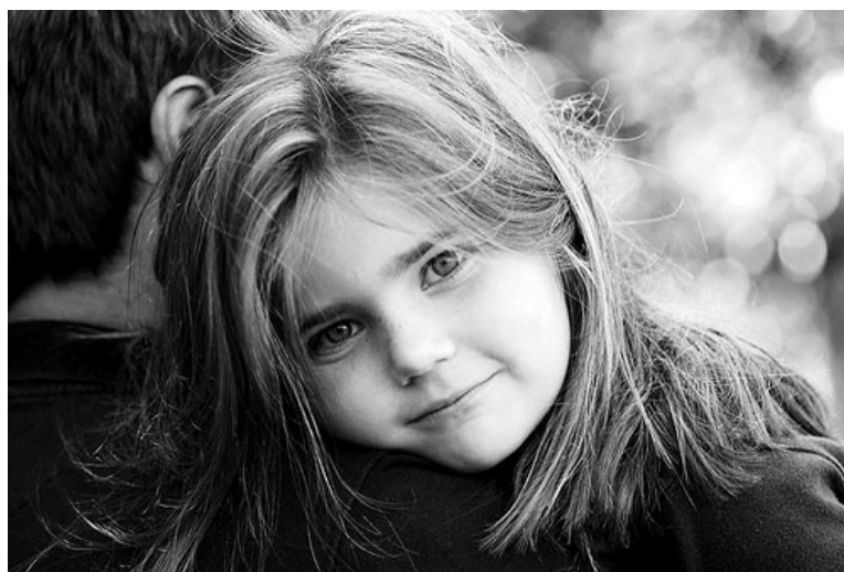
Obrázek 1: Dívka 1

„Některé děti se chovají tak, jako kdyby neměly rodiče. To proto, že někteří rodiče se chovají tak, jako kdyby neměli děti.“