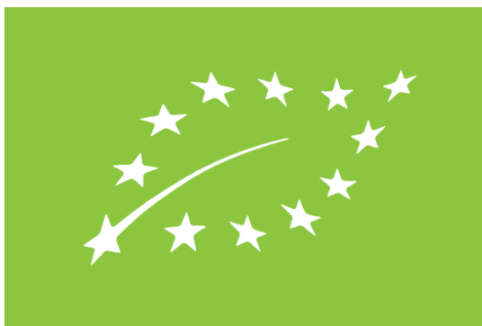
Obrázek 3.1: Grafický znak, označující biopotraviny, které byly vyprodukovány a baleny v Evropské unii tzv. eurolist (Ministerstvo zemědělství 2017a)

(Homolka et al. 2005; Sutherland et al. 2013). Kvůli tomuto byl zaveden již zmíněný kontrolní systém, který všechny tyto požadavky spotřebitelům zaručí a zajistí tak jejich důvěru k producentovi.