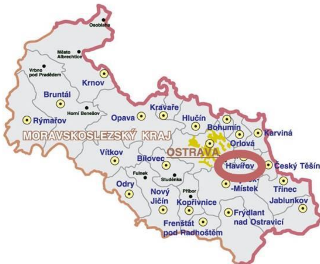
Obrázek č. 2 Mapa Moravskoslezského kraje ( http://spravnimapa.topograf.cz/moravskoslezsky-kraj )

Výzkumná část bakalářské práce je zaměřena na využití alternativních trestů u mládeže. V rámci výzkumného šetření bylo vybráno město Havířov. Město Havířov je nejmladším městem České republiky.