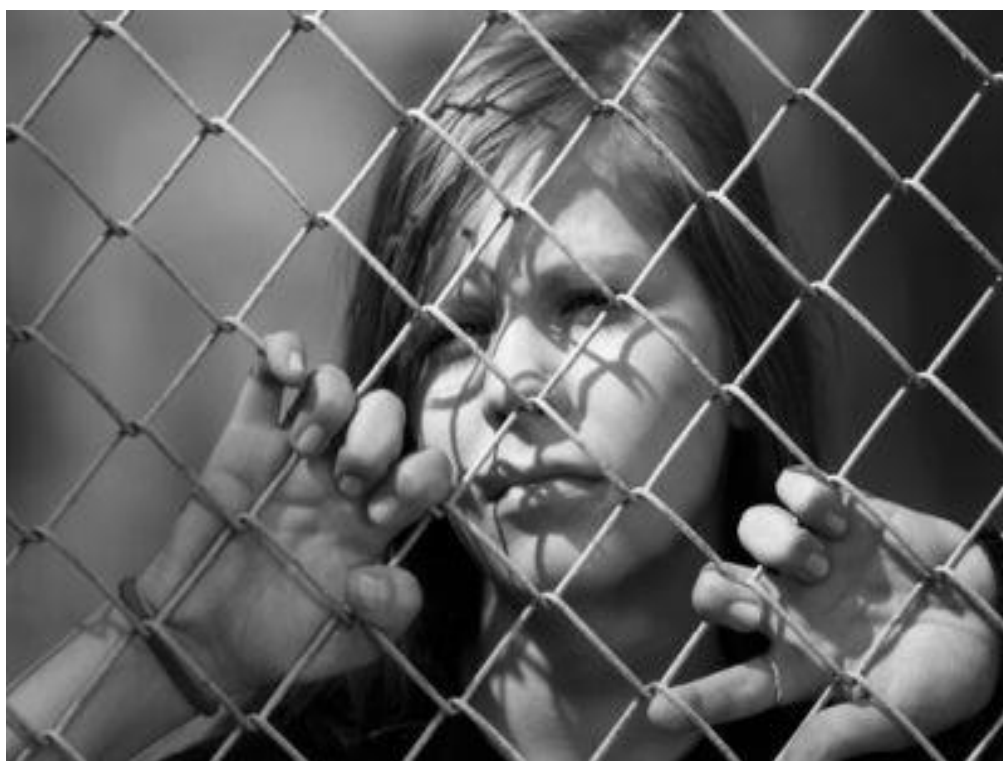
Obrázek č. 1 Dívka za plotem ( http://najmama.aktuality.sk/clanok/226792/poznate-si-dieta-nie-je-delikvent-a-kriminalnik/ )

“Je to smutné, ale mláďa musí jednou odejít. I když si jej člověk zachová v srdci, žel přírodě, nezachová si je v kolenou“ (Jan Werich)