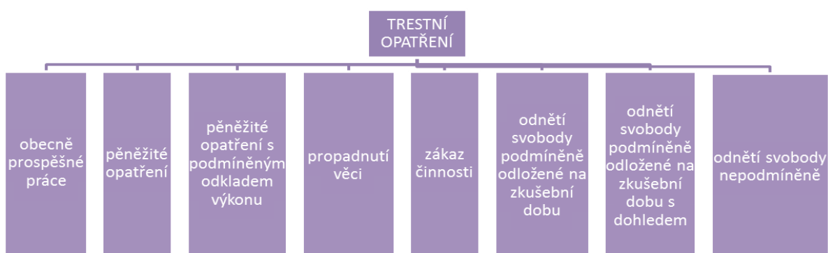
Schéma č. 4 Trestní opatření (Delongová)

Po objasnění kompetencí kurátora pro děti a mládež a se seznámení se s právními předpisy, se zaměříme na jednotlivé metody práce s mládeží.