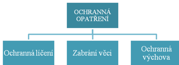
Schéma č. 3 Ochranná opatření (Delongová)