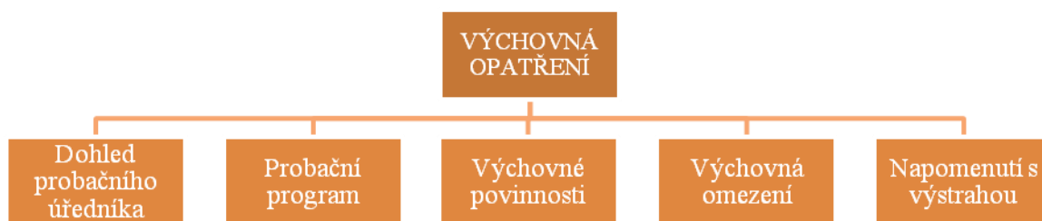
Schéma č. 2 Výchovná opatření (Delongová)