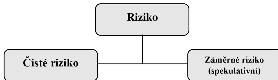
Obr. 1: Riziko (Zdroj: Upraveno podle 4, str. 15)