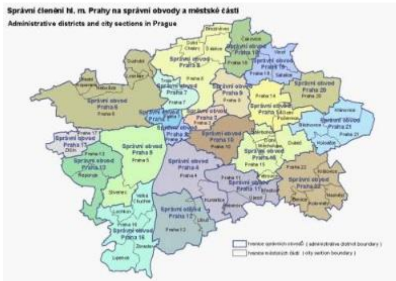
Obrázek 1: Správní členění hlavního města Prahy na správní obvody a MČ