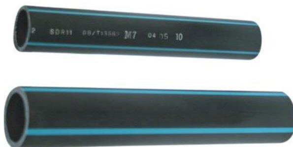
Obr. 1-Vodovodní potrubí z PE

Jedná-li se o vodovod o profilu potrubí DN větší jak 80 mm, tak se ocenění provede podle § 17 Inženýrské stavby. Pokud se jedná o ocenění vodovodní přípojky o DN menší jak 50 mm, provede se ocenění podle § 18 Venkovní úpravy. Pro ocenění je velmi důležité znát stáří stavby a délku potrubí. Tyto údaje je možné zjistit například ze stavebního povolení či jiného rozhodnutí o povolení stavby. Předpokládaná životnost potrubí při běžné údržbě činí zpravidla u inženýrských a speciálních pozemních staveb 50 až 100 let podle druhu konstrukce. U venkovních úprav je předpokládaná životnost uvedena v příloze č. 21 oceňovací vyhlášky.