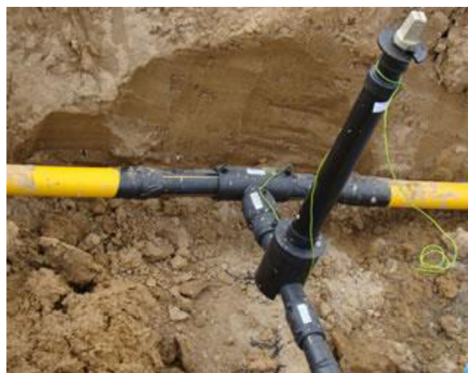
Obr. 6 Plynové potrubí [49]

vyšší či nižší. Jedná-li se o plynovou přípojku menší než DN 40 mm, provede se ocenění jako ocenění venkovních úprav