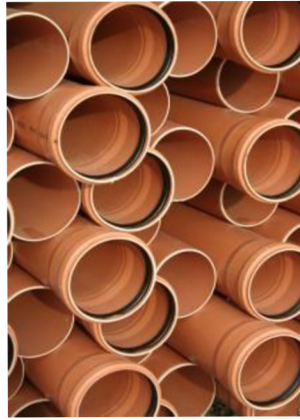
Obr. 2 - Kanalizační potrubí z PVC [39]