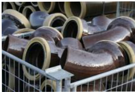
Obr. 4 Kanalizační potrubí kameninové[39]