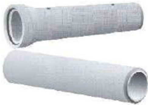
Obr. 3 Kanalizační potrubí betonové[39]