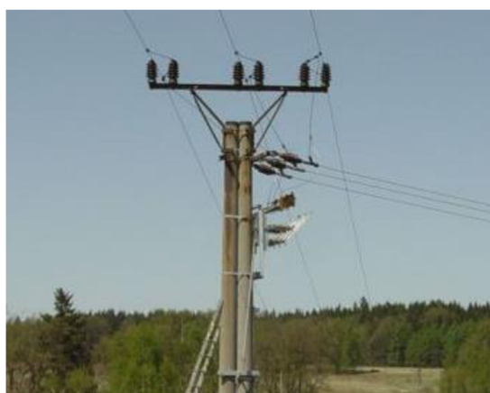
Obr. 5 Vzdušné vedení elektrické sítě [40]

Pro ocenění rozvodů kabelového silnoproudého vysokého napětí se použije příloha č. 15, kde je provedeno rozdělení na 10 kV, 22 kV a 35 kV. Přípojky elektro se oceňují jako venkovní úprava s pomocí přílohy č. 17, kde je nutné znát průřez kabelu a způsob vedení. Zda se jedná o vzdušné vedení či zemní kabel.