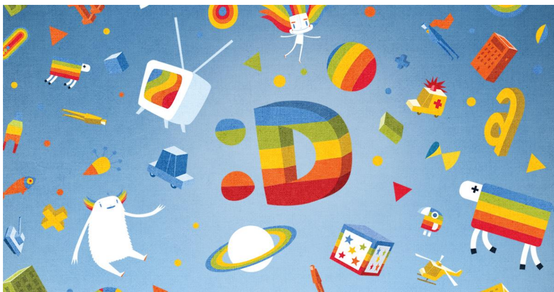
Příloha č. 2, Grafika ČT :D, dostupné z: http://decko.ceskatelevize.cz/