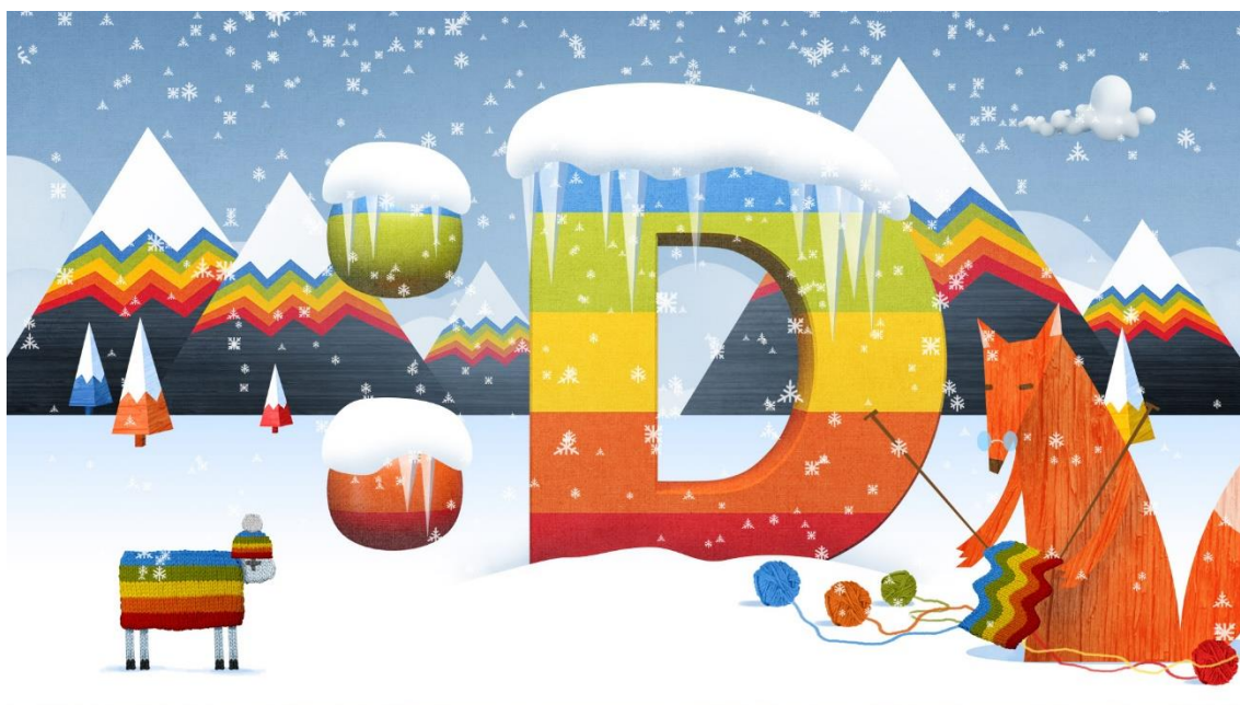
Příloha č. 1, Zimní grafika ČT :D