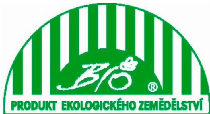
Obrázek 2. České značení pro biopotraviny (tzv. biozebra)

celostátní ochranná známka pro biopotraviny a musí je nést nejen biopotraviny, ale všechny bioprodukty vyrobené v ČR. Je také nutné, aby na obalu byl umístěn číselný kód kontrolní organizace: CZ-BIO-xxx (eAGRI, 2022).