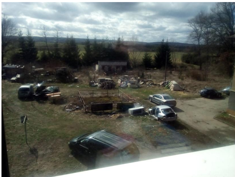
Obr. č. 3: Vyloučená lokalita 2