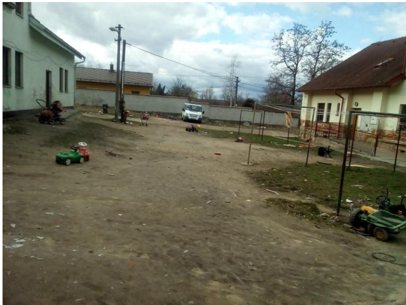
Obr. č. 2: Vyloučená lokalita 1