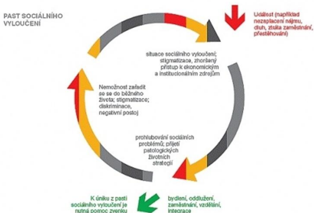
Obr. č. 1: Past sociálního vyloučení