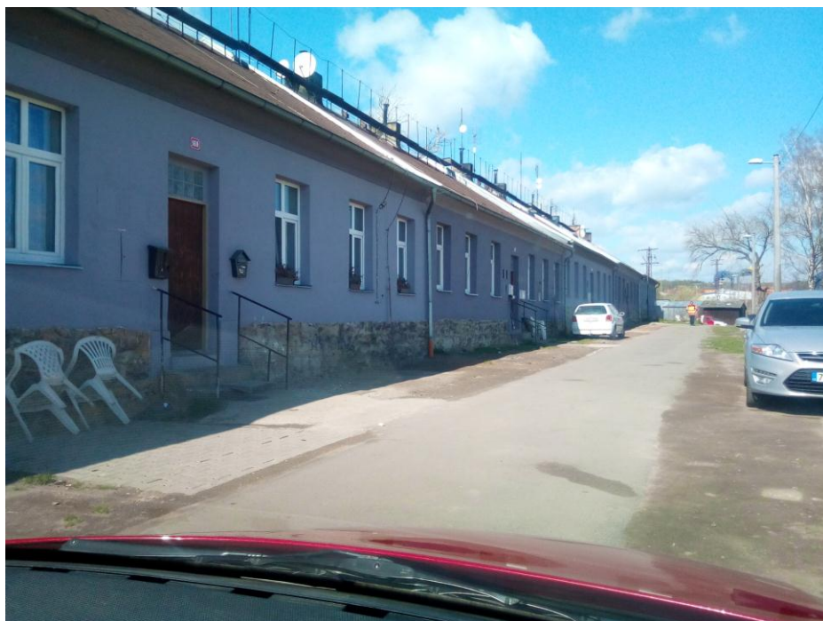
Obr. č. 4: Vyloučená lokalita 3