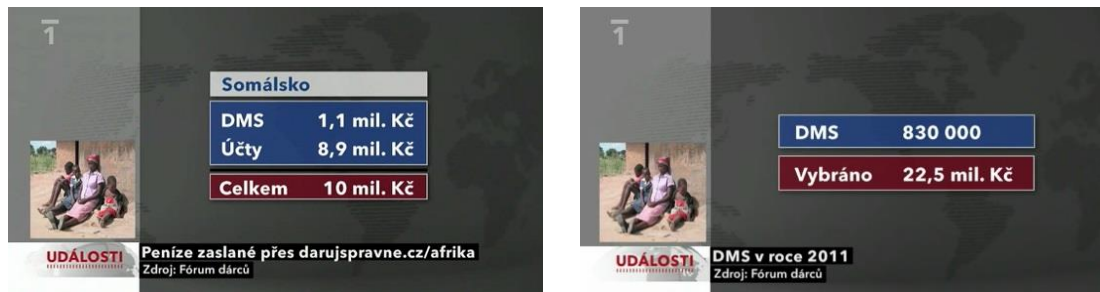
Obrázek 2: Příklad zobrazování číselných dat

Tabulka se ve zprávě objevila ve spojitosti s financemi – ve zprávě Dárcovství se objevily celkem 2, přičemž první dokladovala množství financí plynoucí do Somálska pomocí tzv. dárcovských sms či účtů, další potom celkové množství financí vybraných přes dárcovské sms. U obou tabulek si lze povšimnout ilustračního obrázku africké matky 35 sedící se svými dětmi před chatrčí, ačkoli se druhá tabulka již nutně nevztahuje čistě k Somálsku (či obecně Africe). 36 To může divákovi implikovat množství financí, které putují pouze do Somálska či jiných afrických zemí. 37 Číselné hodnoty se rovněž objevují na imaginárním displeji mobilního telefonu, množství peněz je pak posíláno obrázkem bankovek a konkrétní částkou. Všechny tyto vizualizace pak mohou v divákovi zanechávat dojem, že se na charitu posílá velké množství peněz a že jsou Češi dobrými dárci (to je ostatně naznačeno i v samotné reportáži: „přestože jsou Češi nuceni kvůli zdražování a zvyšování daní spíše šetřit, na charitu nezanevřeli“).