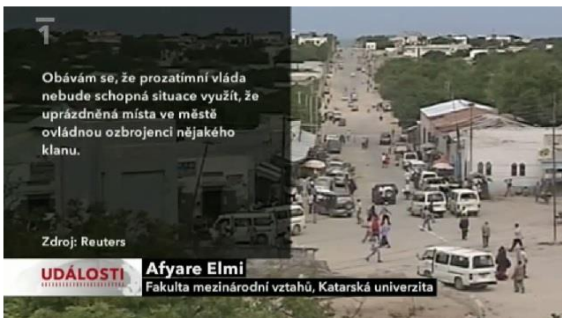
Obrázek 4: příklad přepisu citace

Dalším prvkem, který může významně podpořit pochopení zprávy a posílit sdělované, je textová část, která se objevuje v levé části obrazovky. Jedná se např. o přepisy tiskového prohlášení (Taliban s odkazem na zdroj AP), akademického pracovníka univerzity apod. Tyto přepisy jsou během zobrazení na obrazovce zároveň čteny reportérem a mohou tak podpořit zapamatování si sdělované informace. Vyskytují se pravděpodobně v momentech, kdy není možné získat výpověď svědka či autority přímo. Tyto vizualizace se objevují většinou při záběrech „doprovodného“ typu (záběry na vojáky, na vesnici apod.). Je zcela zřejmé, že se tento doprovodný prvek objevuje ve zprávách běžně a není přítomný pouze v příspěvcích s rozvojovou tematikou, klíčovým zde ale lze sledovat citovaný zdroj, jehož nedostatečně dlouhé zobrazení může mít vliv na další chápání sdělované informace.