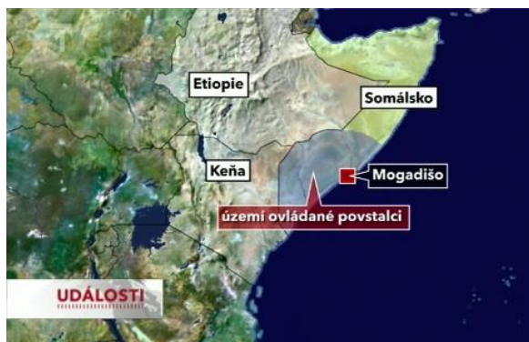
Obrázek 3: Ukázka vizualizace místa

Mimo zobrazení mapy samotného státu dále následovalo grafické označení hlavního města a území, kde se aktuální jev vyskytuje, výjimkou není ani označení okolních států (viz obrázek č. 3). K tomu došlo v reportáži Naděje pro hladovějící pravděpodobně proto, že se o sousedících zemích dále ve zprávě dále referovalo, v příspěvku Žehlení prsou byla takto opět zvýrazněna Nigérie, ač se o ní ve zbytku reportáže nerefereuje. 40 Mapa Kamerunu se rovněž jako jediná objevila již během úvodního moderátorského slova a ne až v samotné reportáži. To může ve spojení se silně hodnotícími prvky (viz dále kategorie Zapůsobení), které se objevují také již v předmluvě moderátora, navodit dojem, že je tomuto příspěvku připisován větší význam.