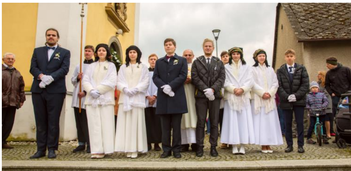
Obrázek č. 11. Matičky v Bohuňovicích. Slavnostní nedělní oděv matiček a mládenců