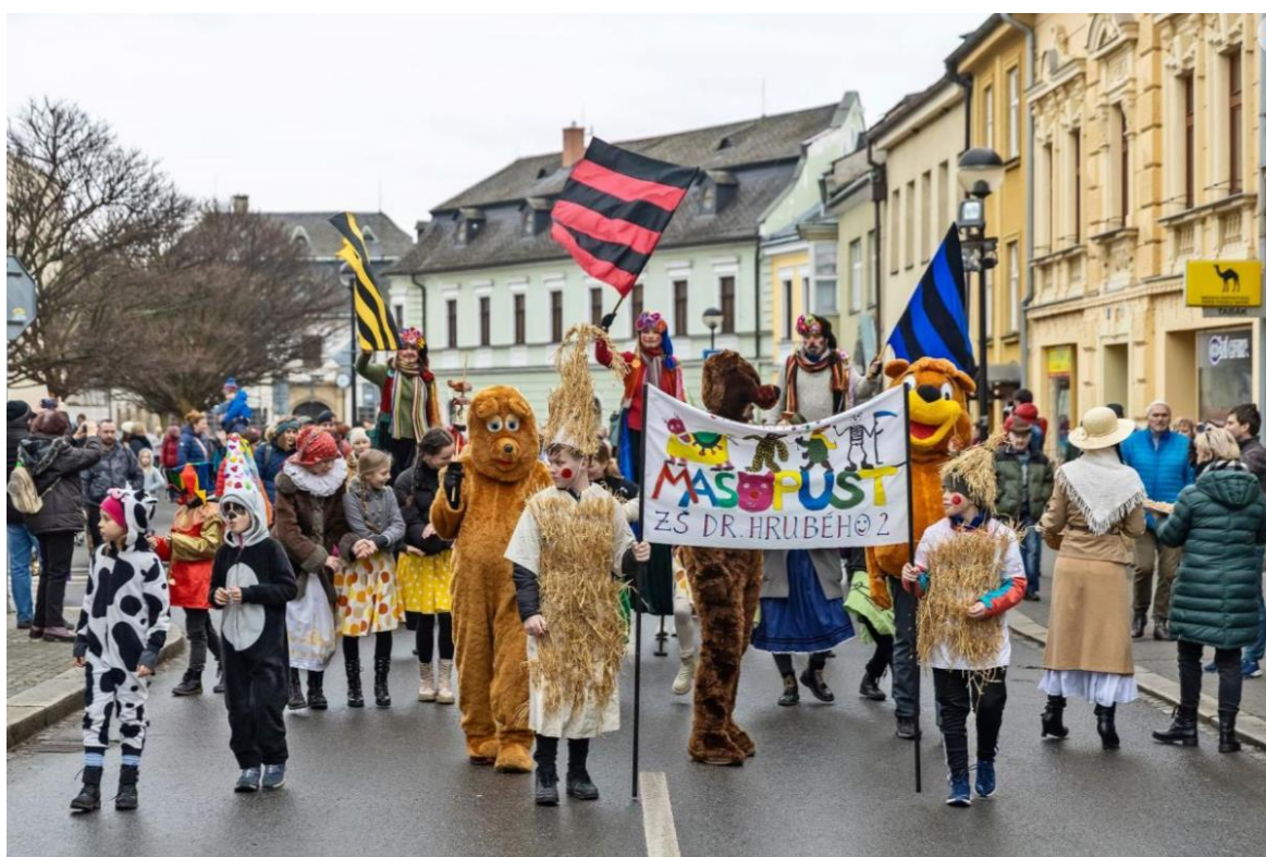
Obrázek č. 3. Masopustní průvod ve Šternberku, 18.02.2023

Tento tradiční křesťanský svátek byl ve Šternberku obnoven v roce 2018, kdy poprvé v novodobé historii prošel městem masopustní průvod. Tuto tradici nyní každoročně organizují Městská kulturní zařízení ve spolupráci se základní školou v ulici Dr. Hrubého ve Šternberku a městem Šternberk. Součástí masopustu je tradiční průvod maškar vycházející od školy směrem na Hlavní náměstí, hned po tom, co je předáno masopustní právo. Ukázka z tradičního průvodu je zachycena na obr. č. 3.