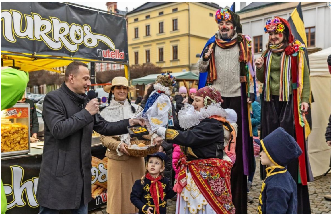
Obrázek č. 4. Masopustní veselice na náměstí ve Šternberku, 18.02.2023 (Dostupné z: Masopustní veselí oživilo centrum Šternberka - Oficiální stránky město Šternberk (sternberk.eu) )

Na základní škole v ulici Dr. Hrubého, která je jedním ze spoluorganizátorů akce, předchází masopustnímu veselí pár týdnů příprav. Učitelé si s žáky povídají o původu a smyslu masopustu a o masopustních zvycích, vyrábí kostýmy, nacvičují písně, tvoří a malují výzdobu. Ve škole se pečou masopustní koláče, jejichž vůní je nasátá celá škola. 99