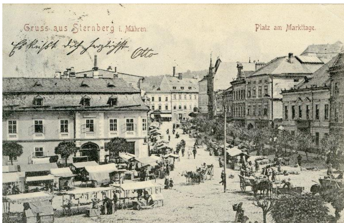
Obrázek č. 8. Trhy na náměstí ve Šternberku a na ul. Radniční na počátku 19. stol.

Atmosféru konání trhů na Hlavním náměstí ve Šternberku v minulosti a v současnosti nám přibližují obrázky č. 8 a č. 9.