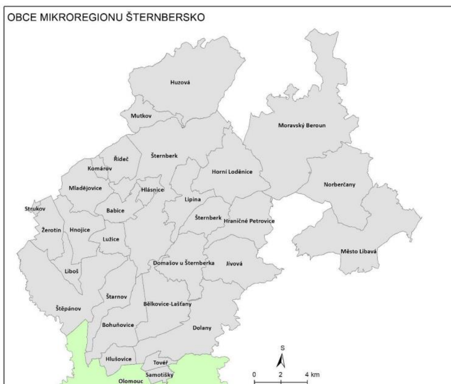
Obrázek č. 2. Členské obce Mikroregionu Šternbersko

V současné době tvoří mikroregion 29 obcí – Babice, Bělkovice-Lašťany, Bohuňovice, Dolany, Domašov u Šternberka, Hnojice, Hlásnice, Hlušovice, Horní Loděnice, Hraničné Petrovice, Huzová, Jívová, Komárov, Liboš, Lipina, Lužice, Město Libavá, Mladějovice, Moravský Beroun, Mutkov, Norberčany, Řídeč, Samotíšky, Strukov, Štarnov, Šternberk, Štěpánov, Tověř a Žerotín. Prostorové rozložení členských obcí mikroregionu je vyznačeno na obr. č. 2.