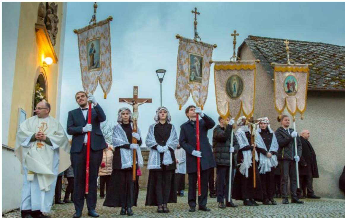
Obrázek č. 10. Matičky v Bohuňovicích. Slavnostní sobotní oděv matiček a mládenců (Zdroj: https://bohunovice.cz/assets/File.ashx?id_org=643&id_dokumenty=8745 )

za Moravskou Loděnici, dva páry za Bohuňovice a Trusovice, tzn. jeden pár za Bohuňovice a jeden za Trusovice a dále do bohuňovického kostela přichází další dva páry mládenců a matiček za Lašťany. 138 Ukázka slavnostního sobotního a nedělního oděvu matiček a mládenců je k vidění na obrázcích č. 10. a 11.