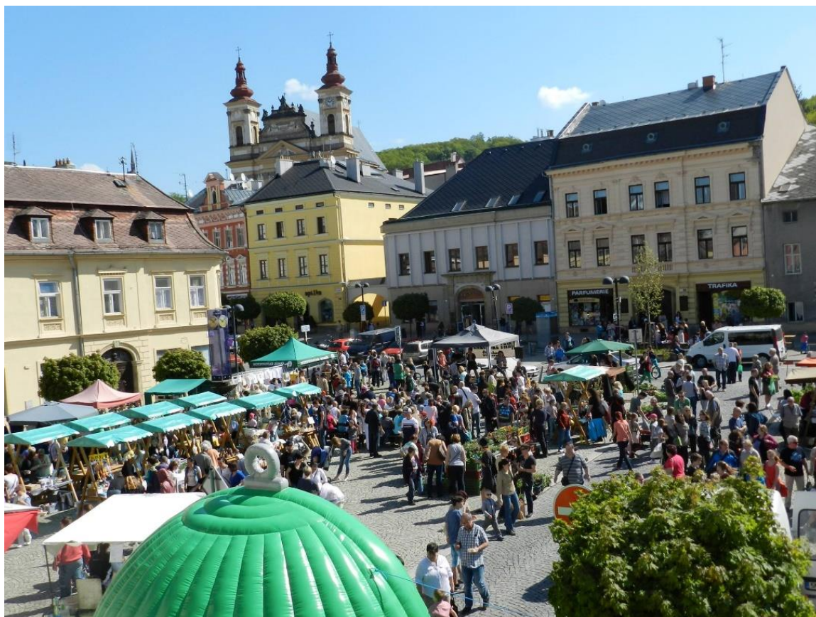
Obrázek č. 9. Venkovské trhy na náměstí ve Šternberku v roce 2016