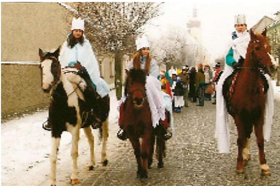
Obrázek č. 12. Příjezd Tří králů do Bohuňovic v r. 2008