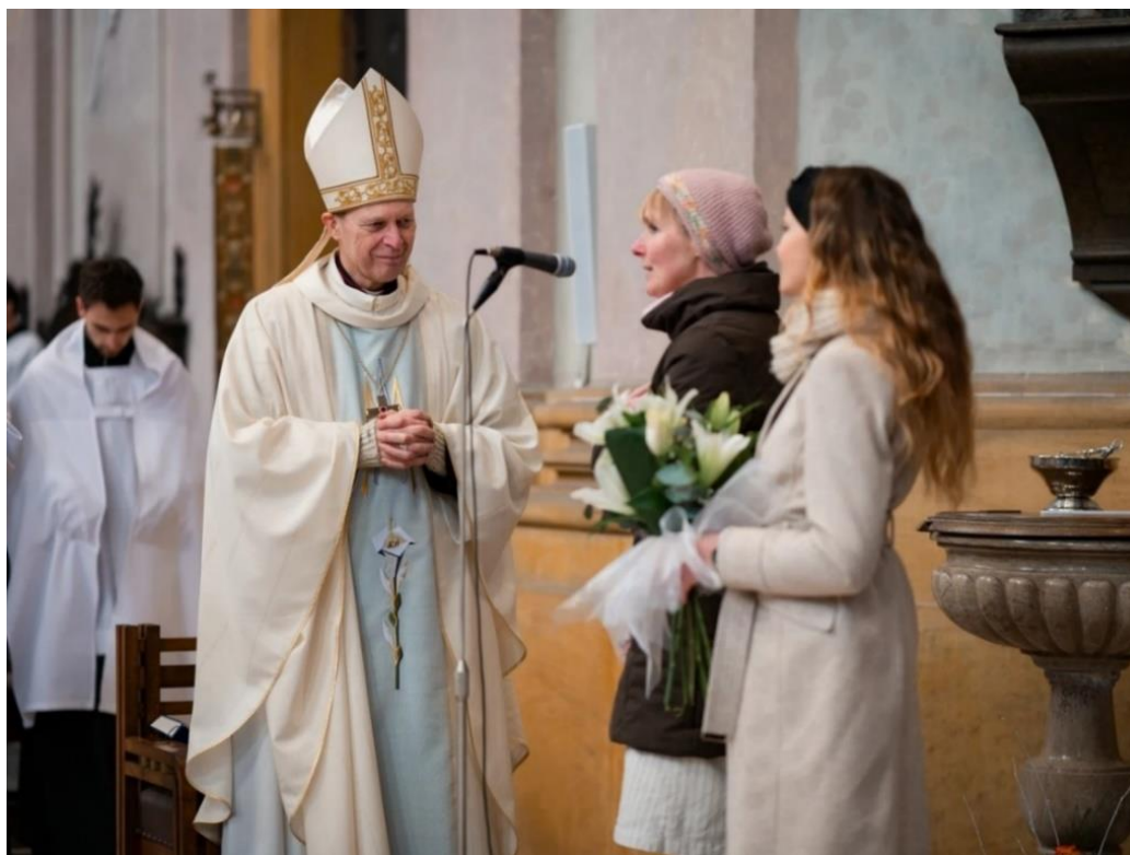
Obrázek č. 5. Hromniční pouť matek ve Šternberku 4. února 2023

K obnovení zvyku hromniční poutě ve Šternberku došlo roku 2004, jejím obnovitelem a iniciátorem se stal P. Josef Červenka (1968-2022), kněz, který působil v Římskokatolické farnosti ve Šternberku. V dnešní době tento zvyk symbolizuje oslavu mateřství a rodiny, kdy „matky prosí o ochranu a dar víry pro naše děti a odvrácení zla od našich nejbližších. Obětní svíci přináší tradičně vždy nejmladší maminky ve farnosti“. Každý rok se této poutě účastní stovky žen z celé republiky, včetně členek Hnutí modlitby matek. 102 Ukázku z poutě můžeme vidět na obr. č. 5.