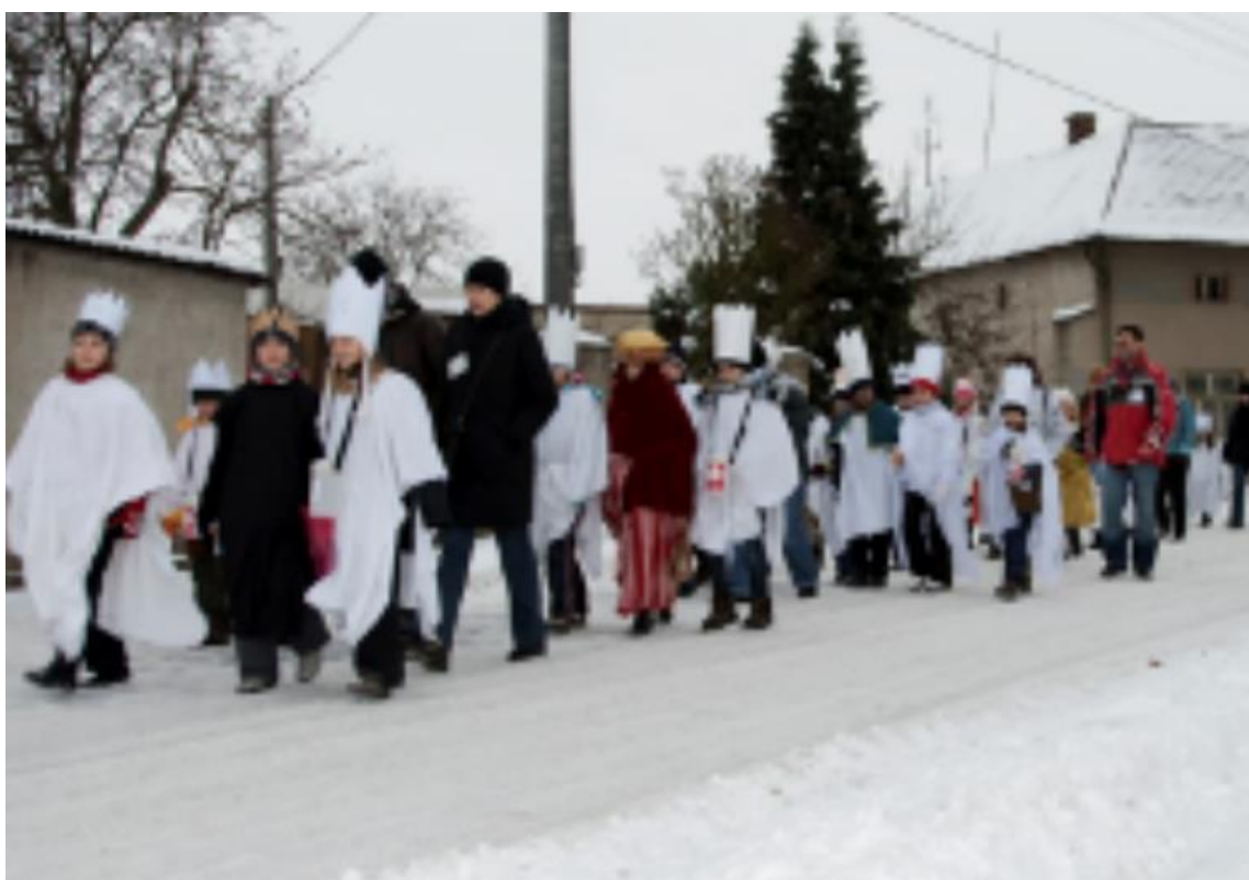
Obrázek č. 13. Tříkrálový průvod obcí v r. 2009