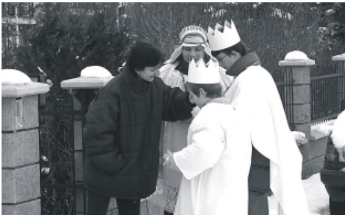
Obrázek č. 7. Tříkrálová obchůzka ve Šternberku v r. 2006

šternberského skautského střediska, ze šternberské farnosti a ostatní koledníci), chodí od domu k domu, vinšují štěstí, zdraví, dlouhá léta a na rám vstupních dveří zapisují iniciály K+M+B, do připravených pokladniček vybírají peníze. Ukázkou z tříkrálové obchůzky ve Šternberku nám přibližuje obrázek č. 7. Celkový výtěžek z tříkrálové sbírky je určen pro činnost charity a na přímou pomoc občanům v krizových situacích.