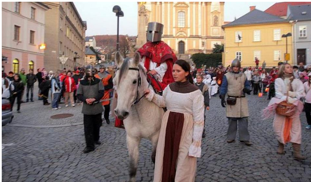
Obrázek č. 6. Svatomartinský průvod ve Šternberku v r. 2011

setkáváme – sv. Barbora, sv. Lucie, sv. Mikuláš a další. Prohlídky jsou pak zakončeny v liechtenštejnské kuchyni, kde bývají připraveny ochutnávky martinských specialit a vína. 108